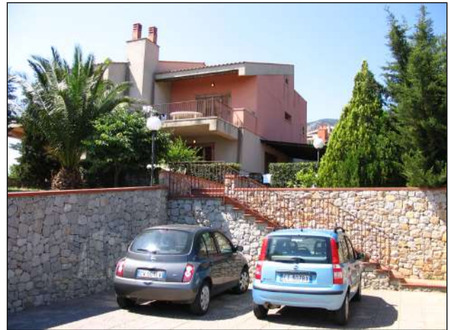
viste dello spazio adibito a parcheggio sul fronte dell'abitazione