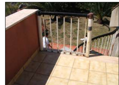
terrazzo del secondo piano