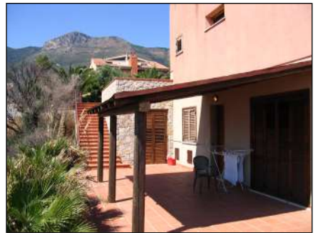
particolari del sito e dettagli costruttivi