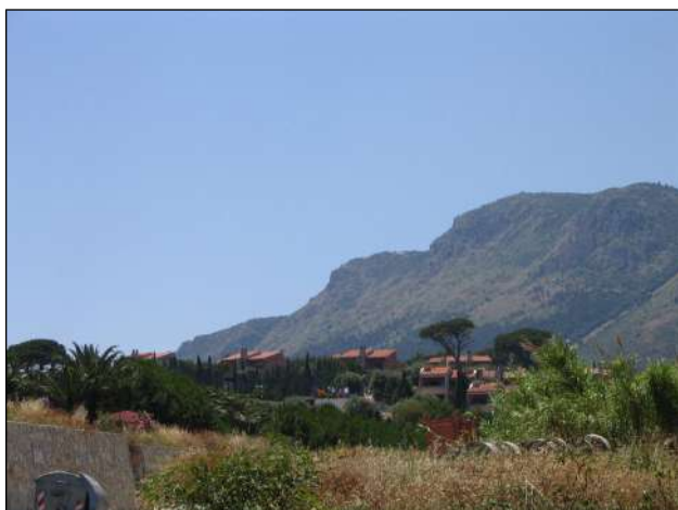
vista del complesso insediativo