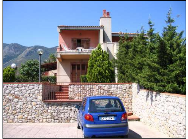
viste dello spazio adibito a parcheggio sul fronte dell'abitazione