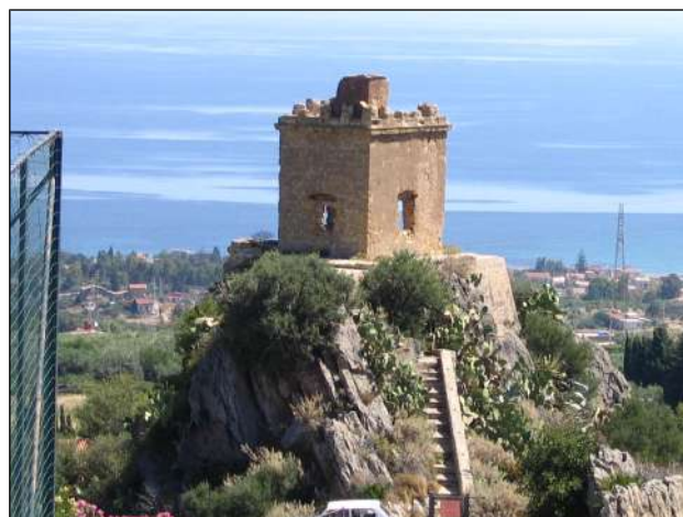
la torre Artale