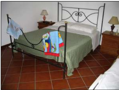
camera da letto