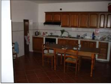
abitazione al pianterreno (spazio di soggiorno-pranzo e cucina, scala di collegamento col piano superiore e camera da letto)