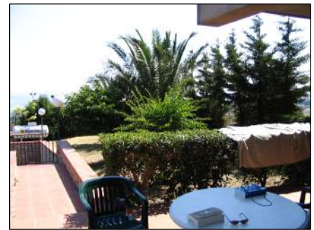
particolari del sito e dettagli costruttivi