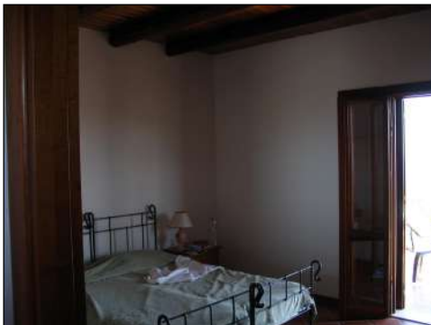
camera da letto