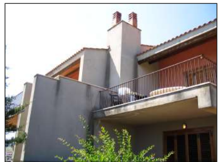
particolari del sito e dettagli costruttivi