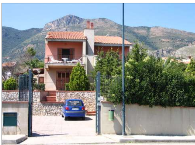
ingresso e parcheggio