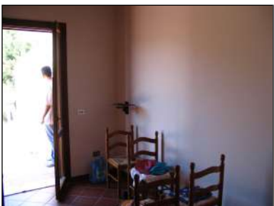
ingresso-soggiorno al primo piano