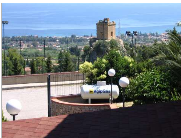
vista dal fabbricato verso il litorale