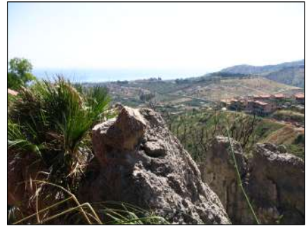
particolari del sito e dettagli costruttivi