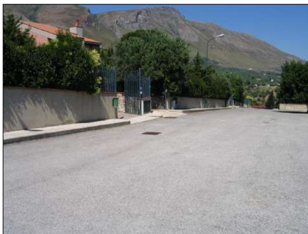
il viale di accesso al lotto n.31