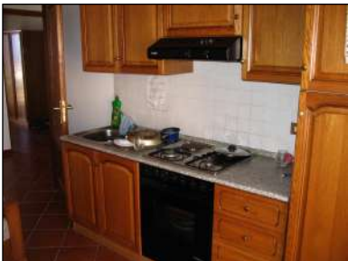
cucina al primo piano