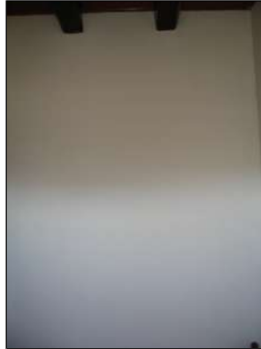
parete che chiude l'originario collegamento interno fra i due piani