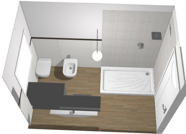
Rivestimenti bagno tipo 1