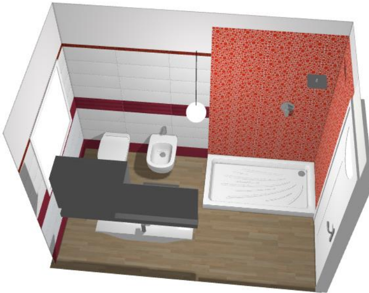
Rivestimenti bagno tipo 2