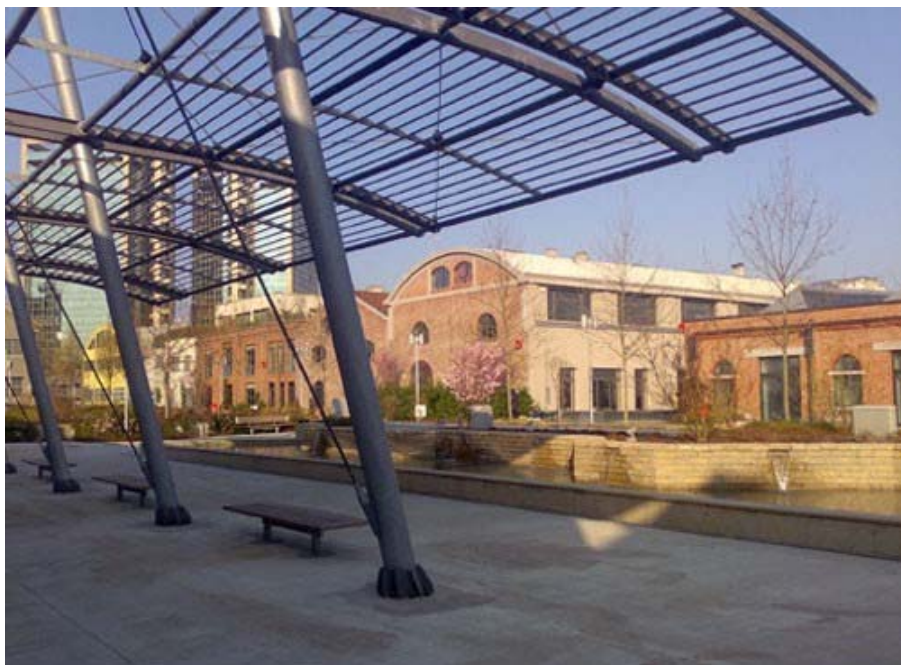
FOTO - Esterno PICTURES - Exterior