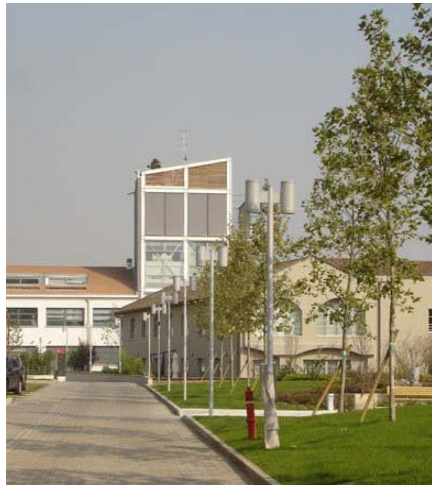
Sopra e a lato: Vista del condominio. Above and aside: View of building.