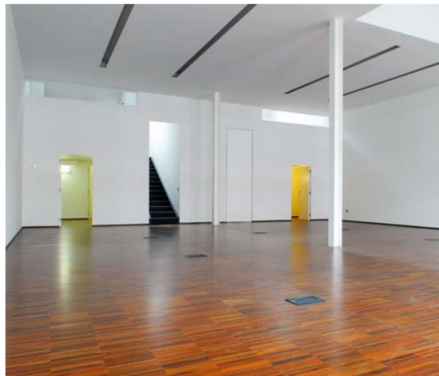
Sopra e a lato: Vista area verde e interno open space. Above and aside: View of green area and open space.