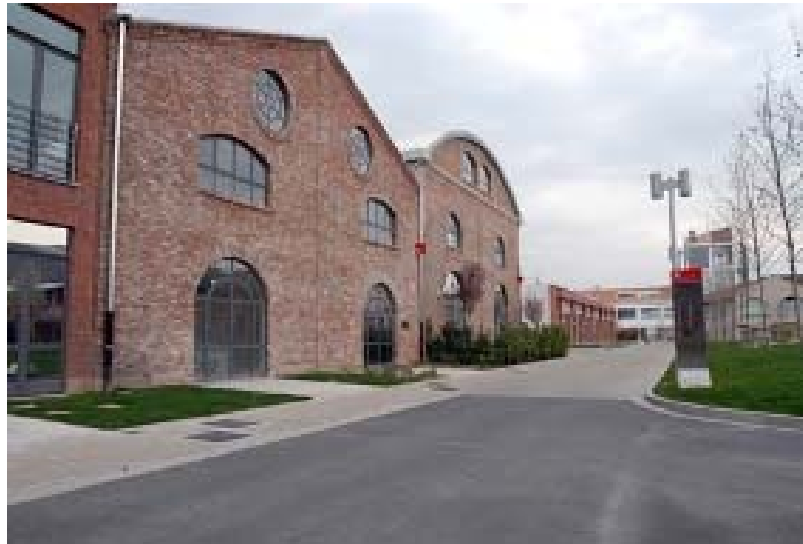
FOTO - Esterno PICTURES - Exterior