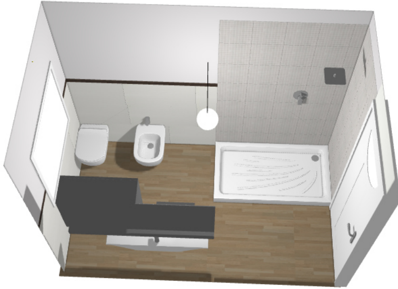
Bagno tipo 1