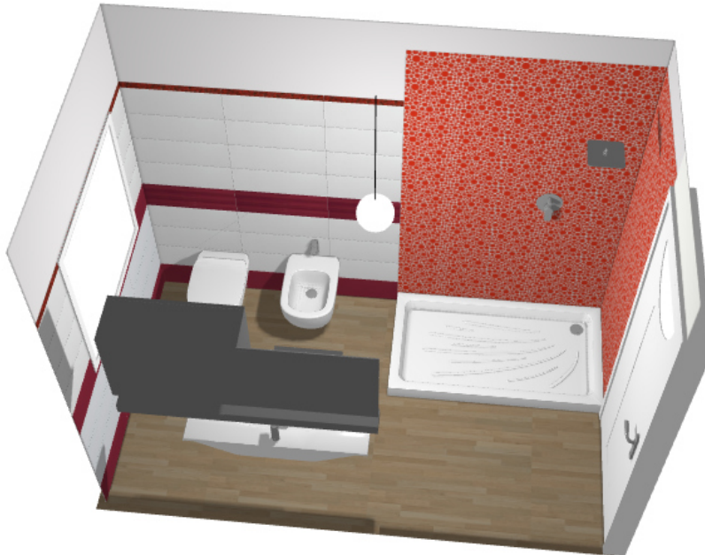
Bagno tipo 2