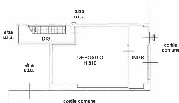
PIANO TERRA H. 375