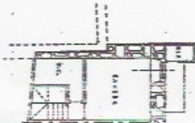
Pianta Piano PRIMO h: 2,00