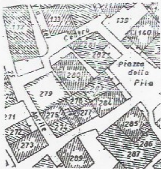
Estratto Mappa M.C.T. Foglio 21 Mappale 283