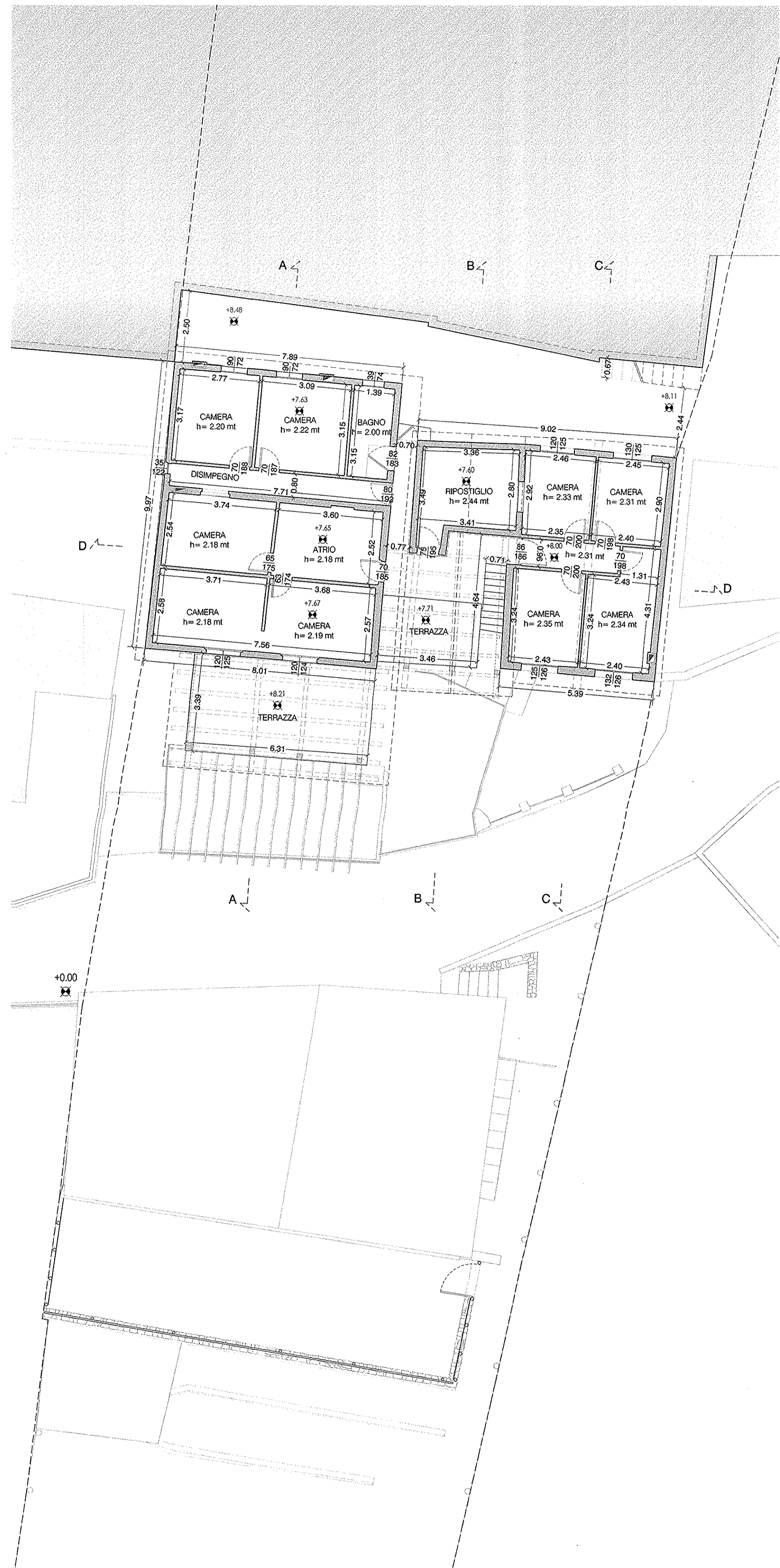
Pianta quota +8.50 mt scala 1:100