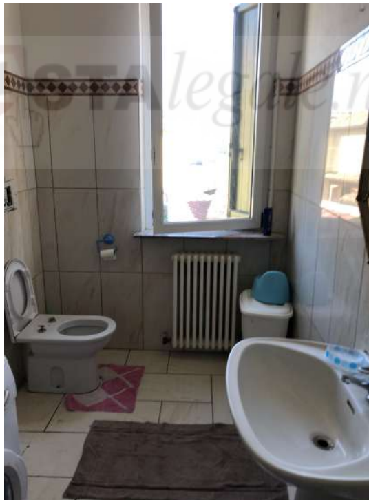
Vista interna - corpo A locale servizio igienico