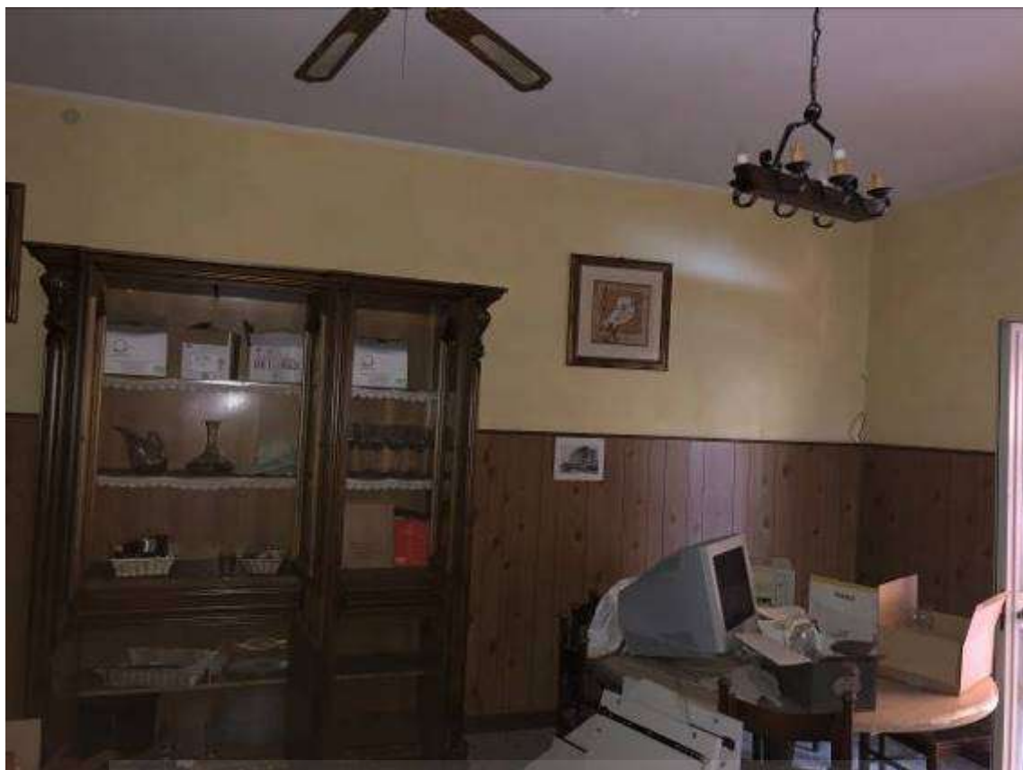
Vista interna – unità immobiliare Corpo B (locale taverna)