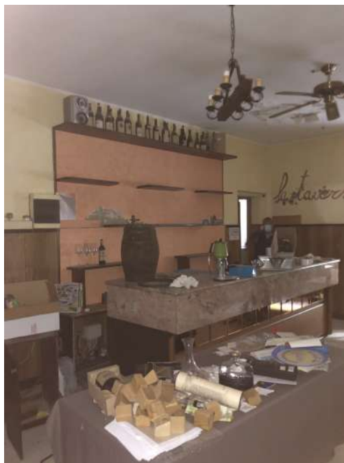
Vista interna – unità immobiliare Corpo B (locale bar)