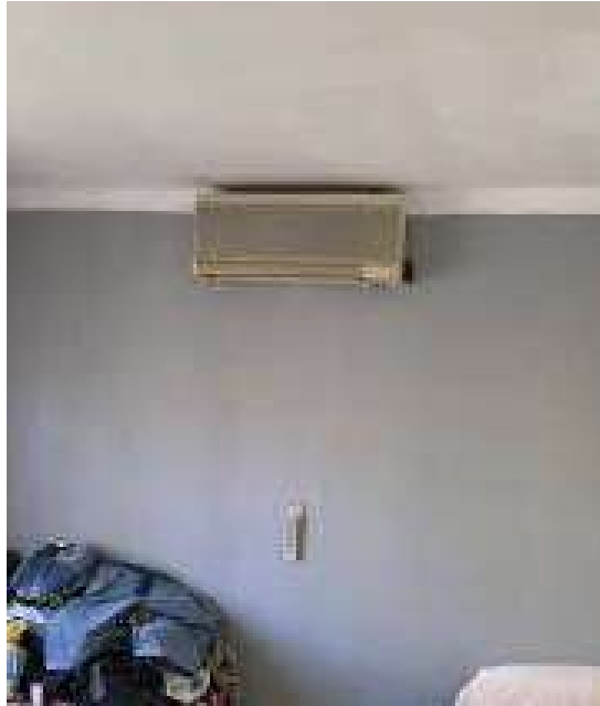
Vista interna - corpo A locale camera da letto