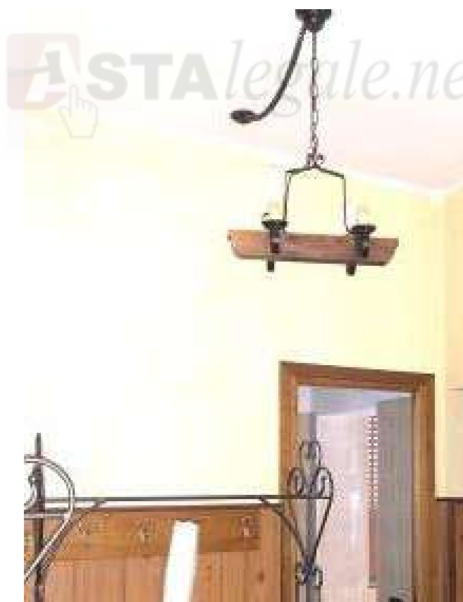
Vista interna – unità immobiliare Corpo B