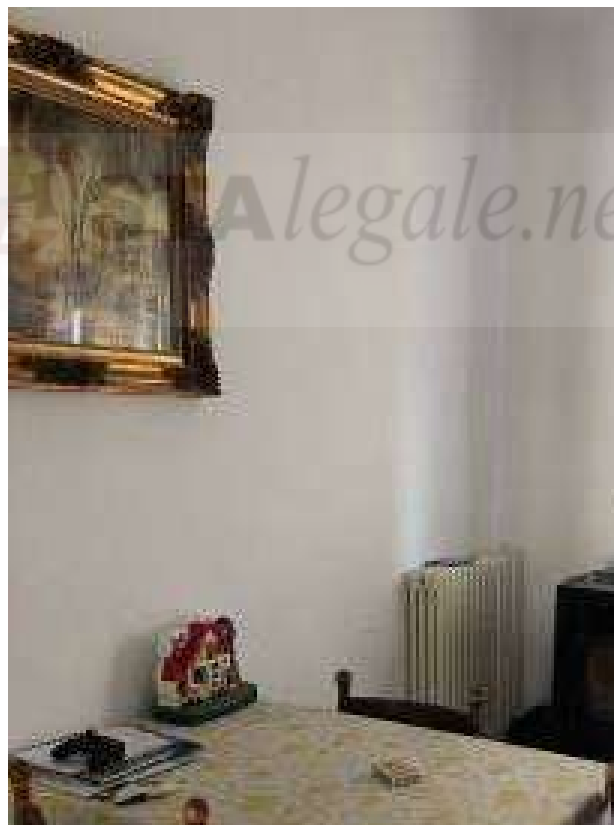
Vista interna - corpo A locale soggiorno