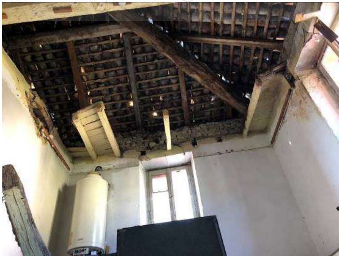
Vista interna – unità immobiliare Corpo B -LOCALE CUCINA ZONA INTERESSATA DA CROLLO PARZIALE COPERTURA