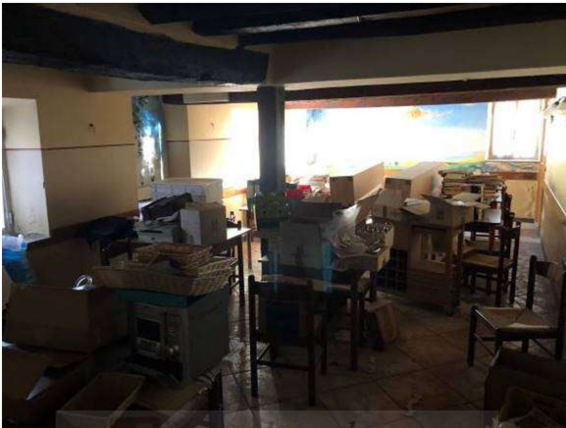
Vista interna – unità immobiliare Corpo B (locale taverna)