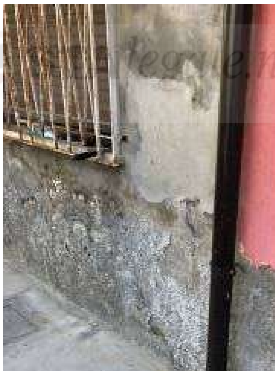
Vista esterna – dettaglio pozzetto pluviale