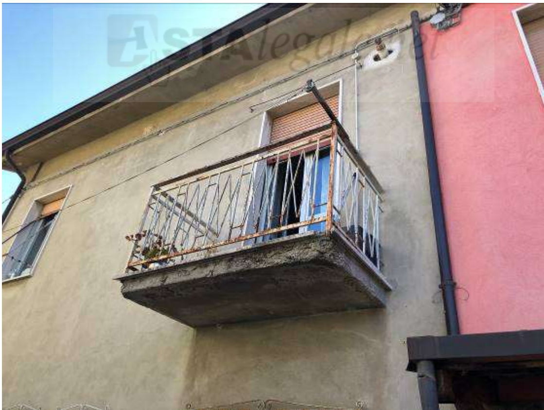
Vista esterna lato ovest (balcone appartamento unità A)