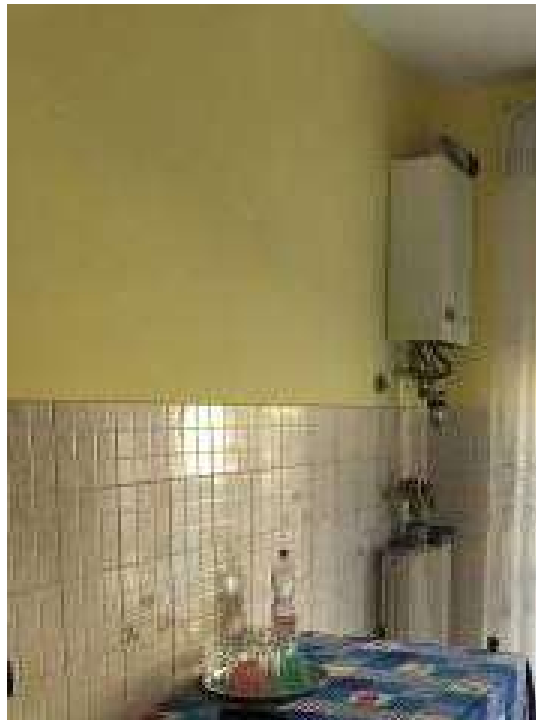
Vista interna - corpo A locale cucina