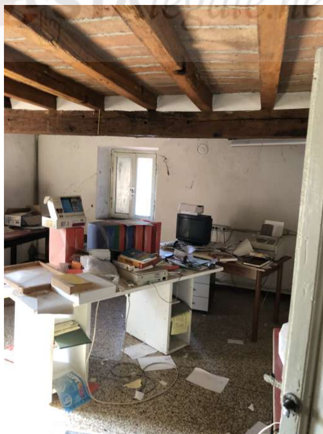
Vista interna – unità immobiliare Corpo B