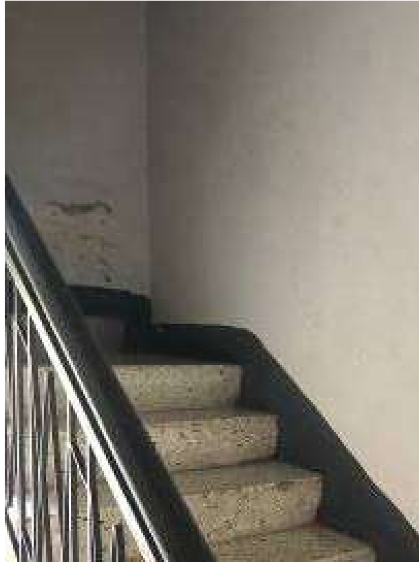
Vano scala ingresso appartamento primo corpo A