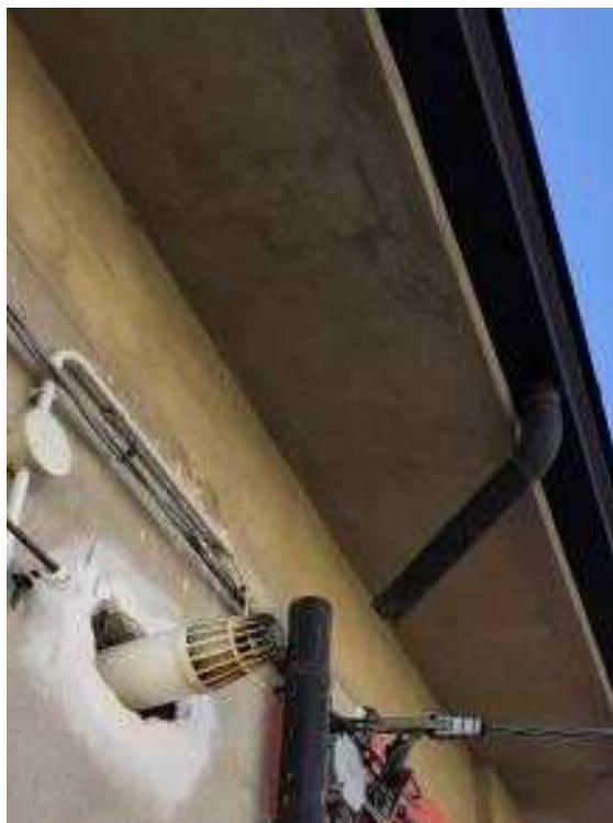
Vista esterna – dettaglio scarico caldaia corpo A in facciata e pluviale