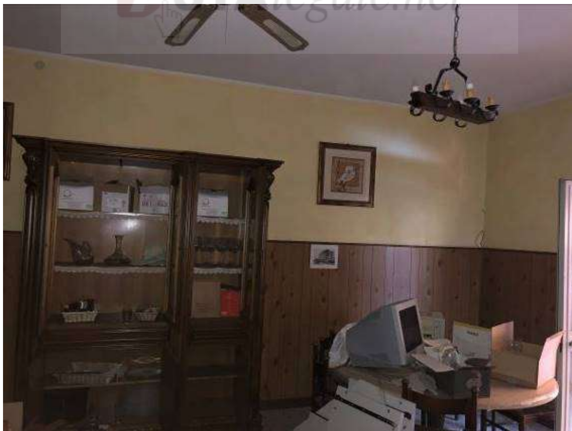
Vista interna – unità immobiliare Corpo B (locale taverna)