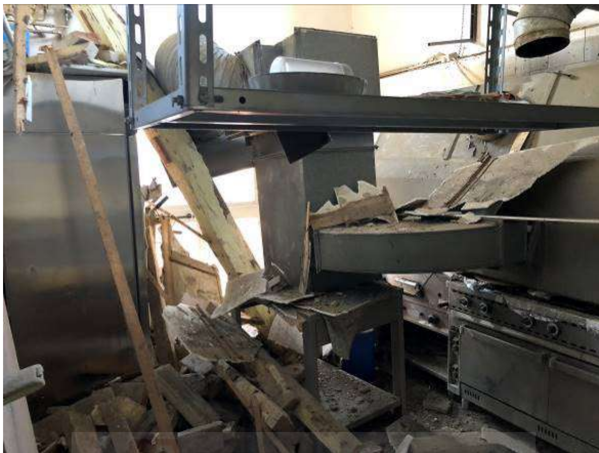
Vista interna – unità immobiliare Corpo B -LOCALE CUCINA ZONA INTERESSATA DA CROLLO PARZIALE COPERTURA