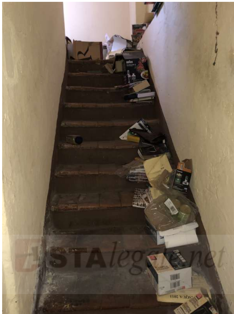
Vista interna – unità immobiliare Corpo B – scala di collegamento interno alla soffitta