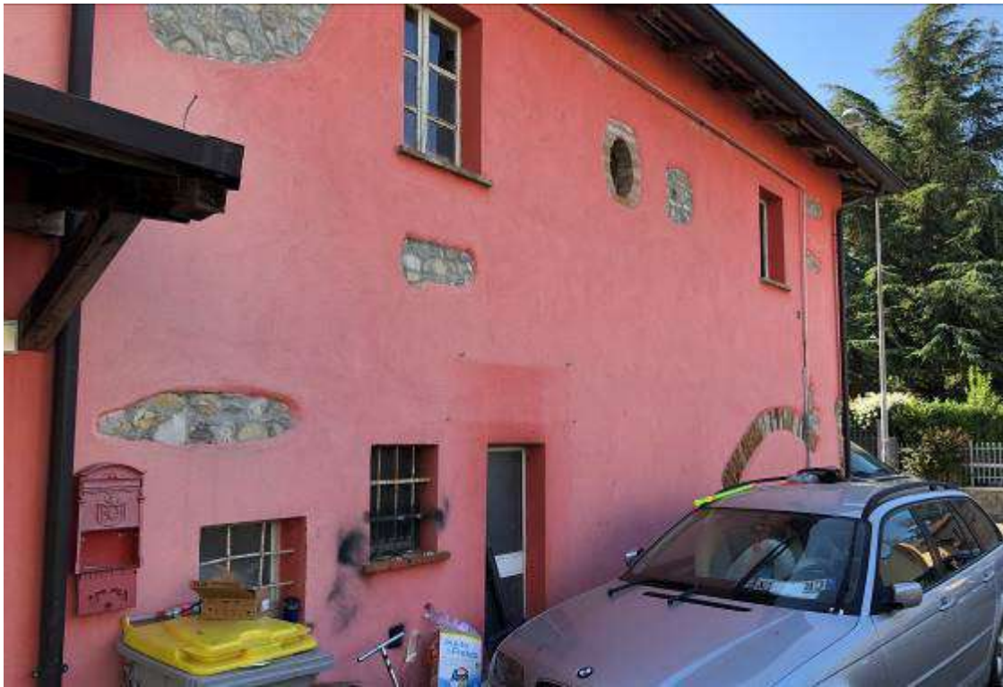
Vista esterna lato ovest