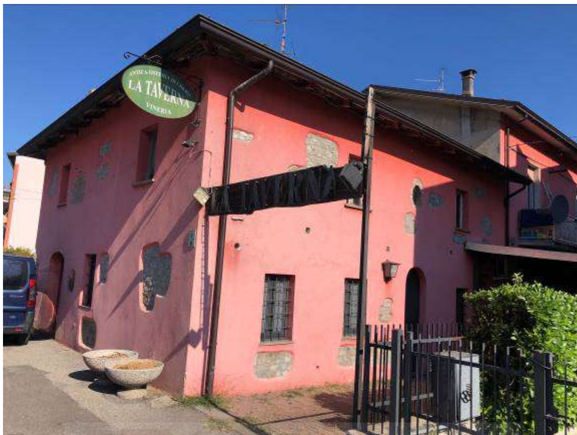
Vista esterna sud est