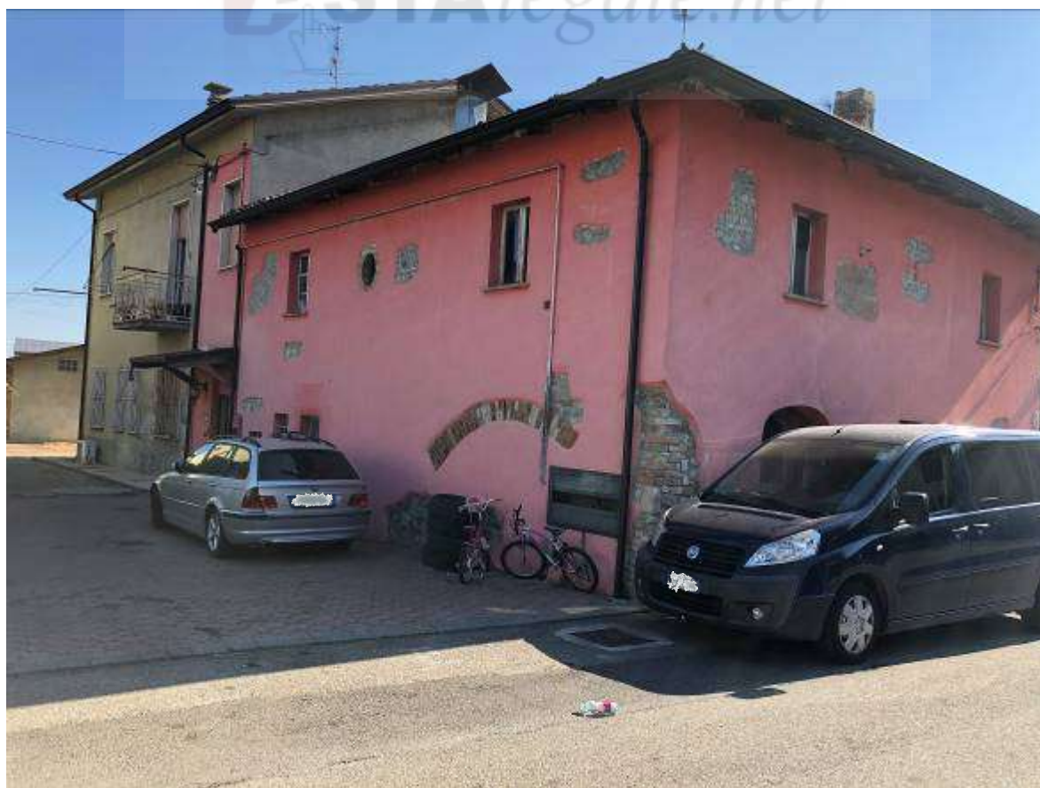
Vista esterna sud ovest