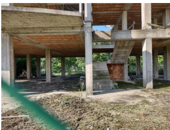
Fabbricato in costruzione: particolare del piano interrato e del piano terra