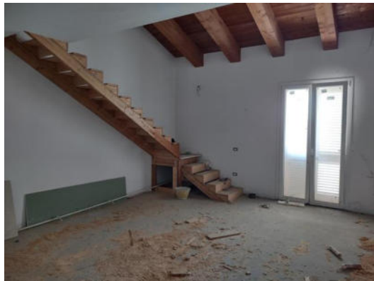
Ingresso e scala comuni; appartamento: soggiorno con angolo cottura