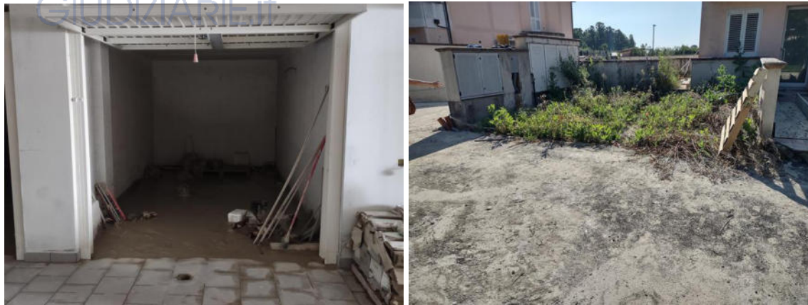
Garage e posto auto