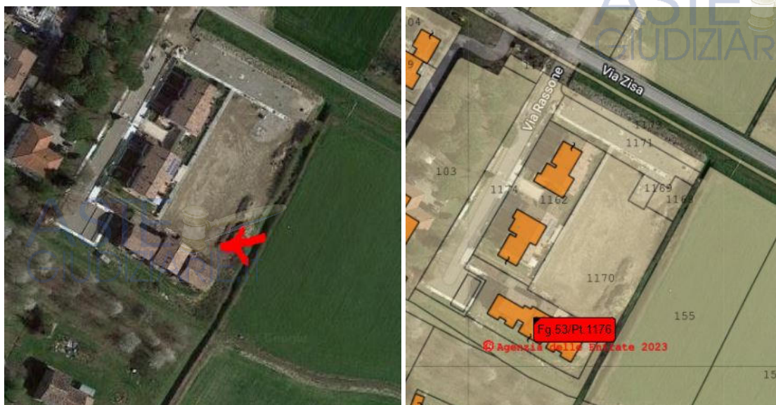
Foto dall'alto del fabbricato da completare e foto con mappa catastale sovrapposta

I beni oggetto del pignoramento sono composti da: