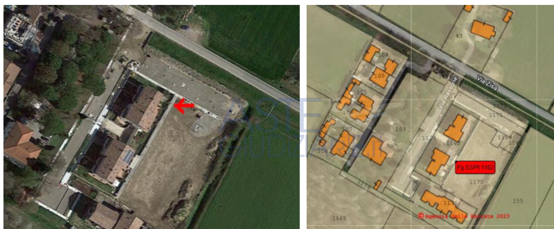
Foto dall'alto del fabbricato condominiale e foto con mappa catastale sovrapposta

I beni oggetti di pignoramento sono costituiti da un appartamento con garage e posto auto, collocati in un complesso abitativo (condominio Sisa 1) sito a Borgo Sisa (frazione di Forlì) in via Rassone n. 19 . Via Rassone è una piccola strada di lottizzazione a fondo chiuso che immette in via Sisa, la via principale del paese che divide il territorio del Comune di Forlì da quello di