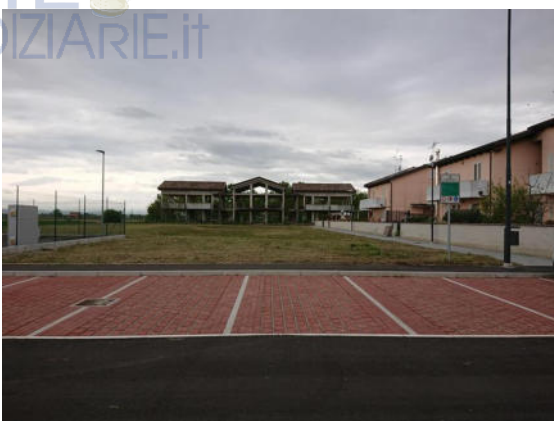
Terreni da cedere al Comune di Forlì: Via Rassone, parcheggio pubblico e area a verde