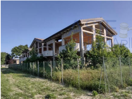
Fabbricato in costruzione