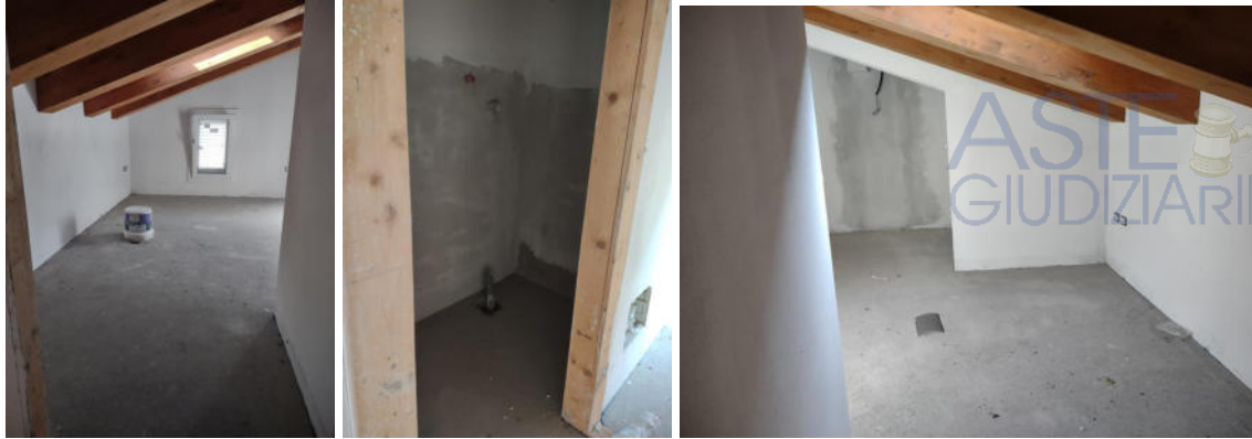
Appartamento: i tre vani del sottotetto