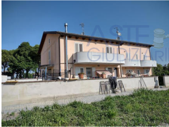
Il fabbricato condominiale:fronte su Via Rassone e retro del blocco 1 con l'appartamento al P.1.