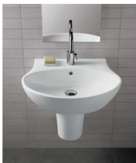
Serie HATRIA serie NIDO