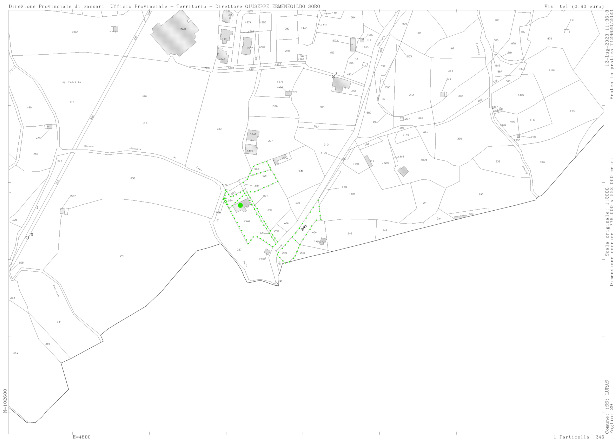
terreni - estratto di mappa catastale