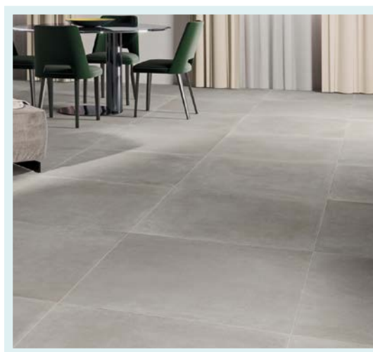
Formato 80x80 tinta unita