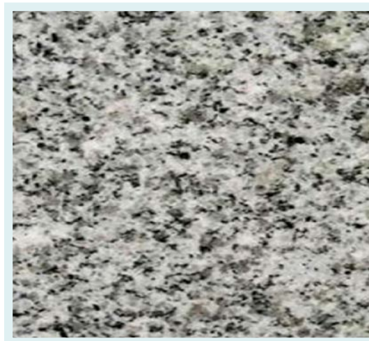
Granito bianco sardo

Per le parti comuni i colori ed i formati saranno scelti a cura della parte venditrice.