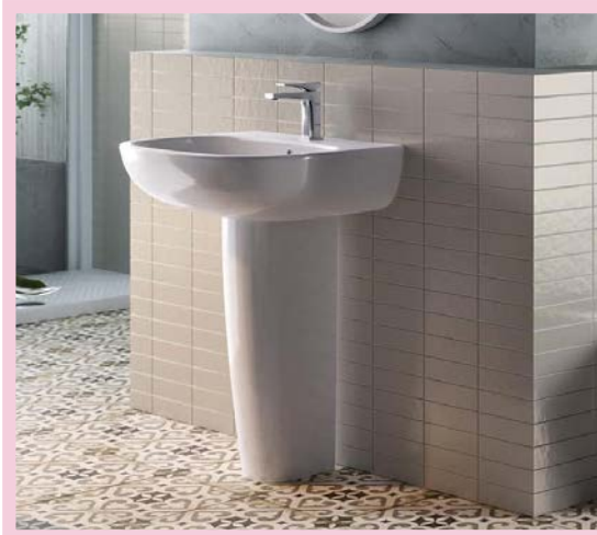
Lavabo a Colonna