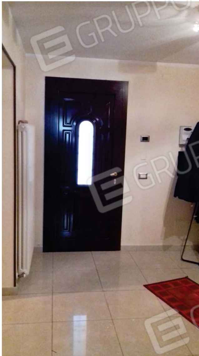
FOTO 13 INGRESSO ALLOGGIO PRINCIPALE LATO DESTRO DEL FABBRICATO

Via M. D'Azeglio 38 - 48121 Ravenna - www.stefanofocacciaarchitetti.it T +390544215210 F +390544246754 M. info@stefanofocacciaarchitetti.it C.F. FCCSFN66S10C553W P.I.V.A. 00599440393