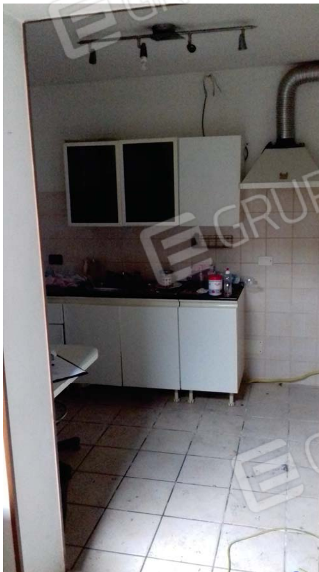
FOTO 8 CUCINA UNITA' IMMOBILIARE CON ACCESSO SUL RETRO

Via M. D'Azeglio 38 - 48121 Ravenna - www.stefanofocacciaarchitetti.it T +390544215210 F +390544246754 M. info@stefanofocacciaarchitetti.it C.F. FCCSFN66S10C553W P.I.V.A. 00599440393