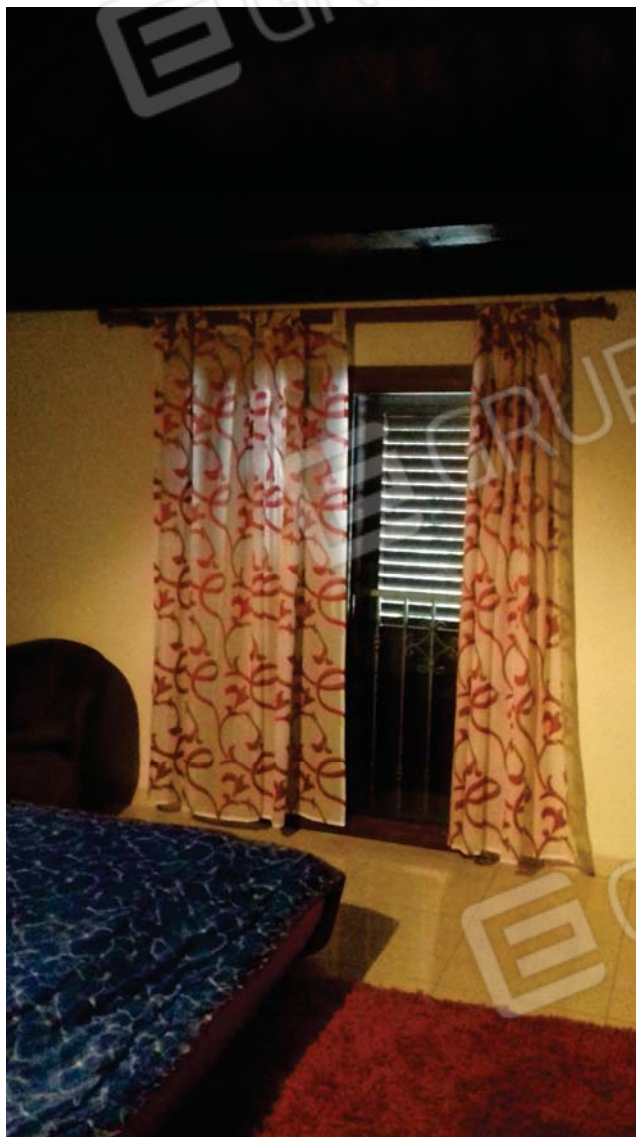
FOTO 17 ALLOGGIO PRINCIPALE STANZA LETTO PRIMO PIANO

Via M. D'Azeglio 38 48121 Ravenna www.stefanofocacciaarchitetti.it T +390544215210 F +390544246754 M. info@stefanofocacciaarchitetti.it C.F. FCCSFN66S10C553W P.I.V.A. 00599440393