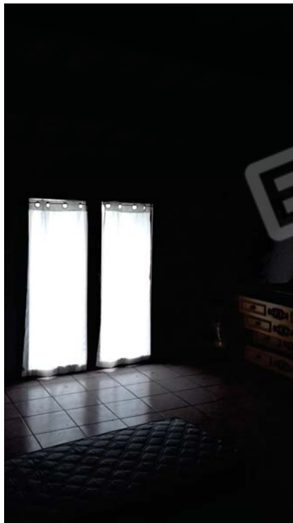
FOTO 12 STANZA DA LETTO UNITA' CON ACCESSO SUL RETRO