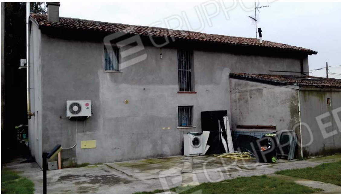
FOTO 3 RETRO

Via M. D'Azeglio 38 48121 Ravenna www.stefanofocacciaarchitetti.it T +390544215210 F +390544246754 M. info@stefanofocacciaarchitetti.it C.F. FCCSFN66S10C553W P.I.V.A. 00599440393