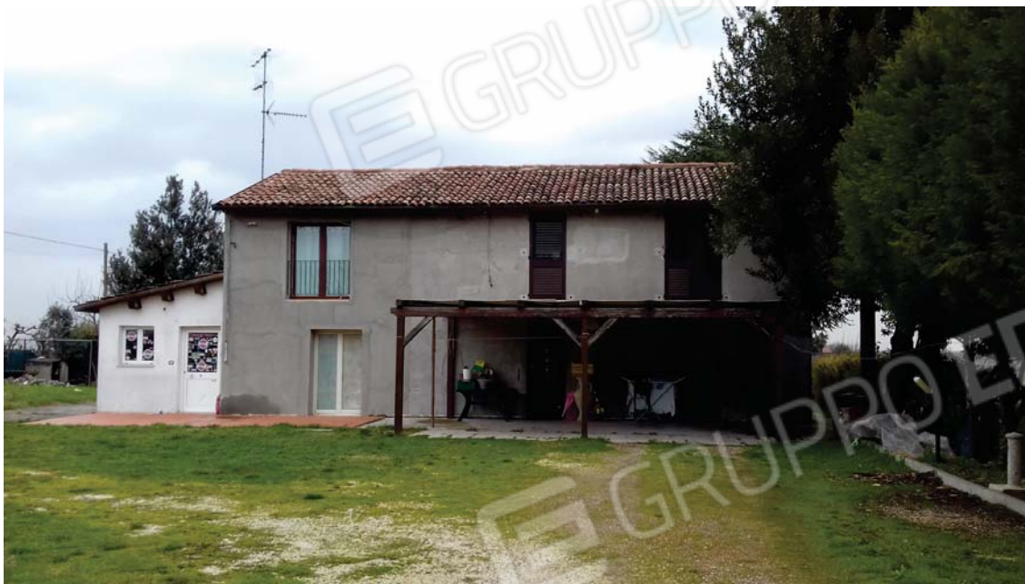
FOTO 1 FRONTE FABBRICATO

Via M. D'Azeglio 38 48121 Ravenna www.stefanofocacciaarchitetti.it T +390544215210 F +390544246754 M. info@stefanofocacciaarchitetti.it C.F. FCCSFN66S10C553W P.I.V.A. 00599440393