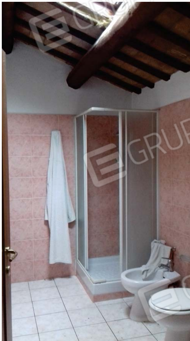
FOTO 10 BAGNO AL PIANO PRIMO UNITA' CON ACCESSO SUL RETRO

Via M. D'Azeglio 38 48121 Ravenna www.stefanofocacciaarchitetti.it T +390544215210 F +390544246754 M. info@stefanofocacciaarchitetti.it C.F. FCCSFN66S10C553W P.I.V.A. 00599440393