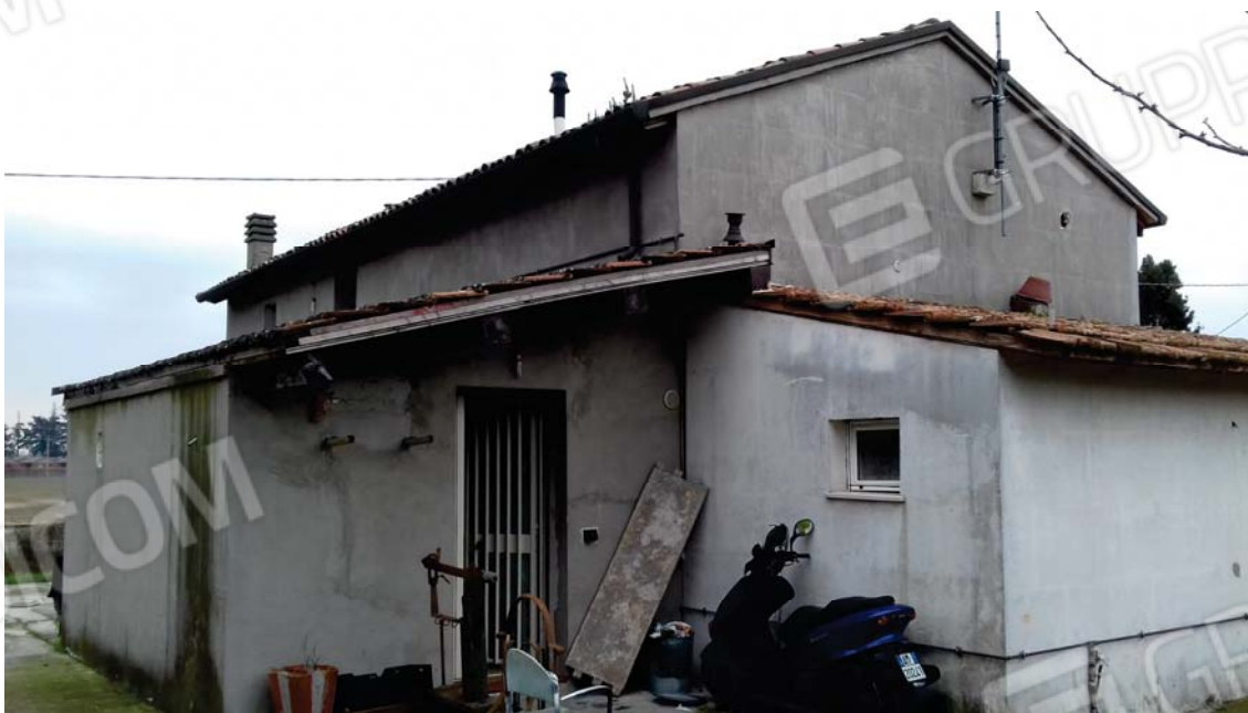
FOTO 2 FIANCO-RETRO