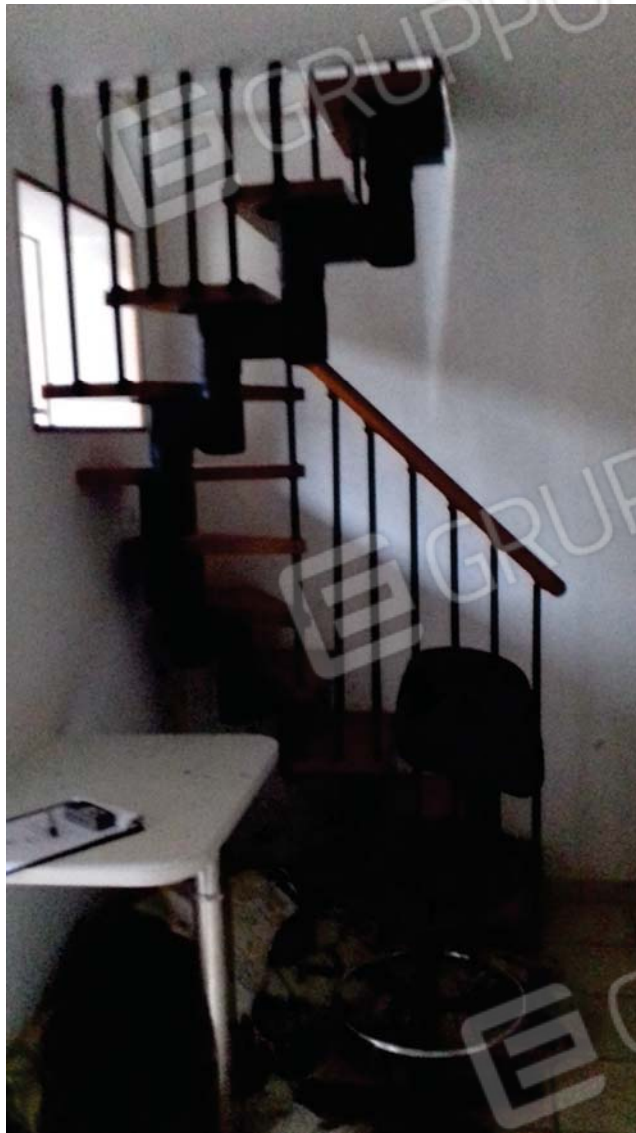
FOTO 9 SCALA DI ACCESSO AL PIANO PRIMO UNITA' SULRETRO

Via M. D'Azeglio 38 48121 Ravenna www.stefanofocacciaarchitetti.it T +390544215210 F +390544246754 M. info@stefanofocacciaarchitetti.it C.F. FCCSFN66S10C553W P.I.V.A. 00599440393