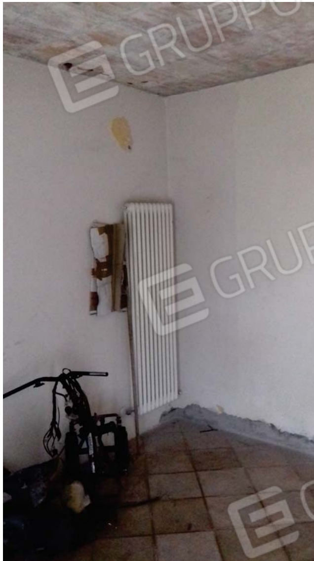
FOTO 6 RIPOSTIGLIO COLLEGATO ALLA MONOSTANZA PIANO TERRA

Via M. D'Azeglio 38 - 48121 Ravenna - www.stefanofocacciaarchitetti.it T +390544215210 F +390544246754 M. info@stefanofocacciaarchitetti.it C.F. FCCSFN66S10C553W P.I.V.A. 00599440393