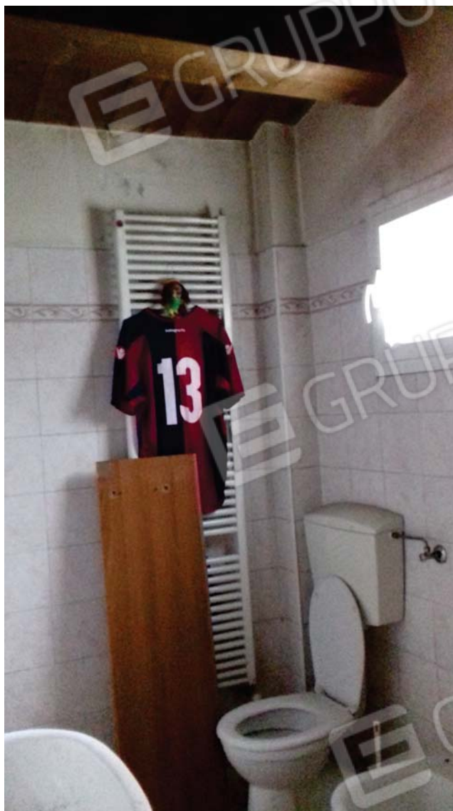
FOTO 5 BAGNO RICAVATO NELL'AUTORIMESSA

Via M. D'Azeglio 38 - 48121 Ravenna - www.stefanofocacciaarchitetti.it T +390544215210 F +390544246754 M. info@stefanofocacciaarchitetti.it C.F. FCCSFN66S10C553W P.I.V.A. 00599440393