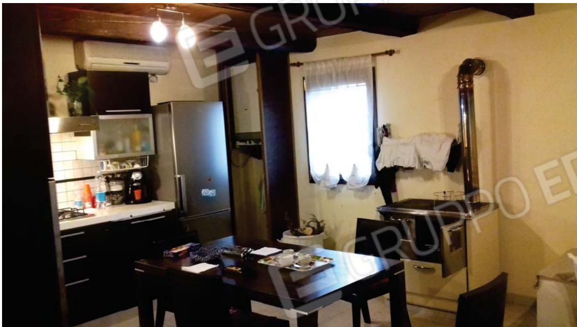
FOTO 13 ALLOGGIO PRINCIPALE SOGGIORNO CUCINA

Via M. D'Azeglio 38 48121 Ravenna www.stefanofocacciaarchitetti.it T +390544215210 F +390544246754 M. info@stefanofocacciaarchitetti.it C.F. FCCSFN66S10C553W P.I.V.A. 00599440393