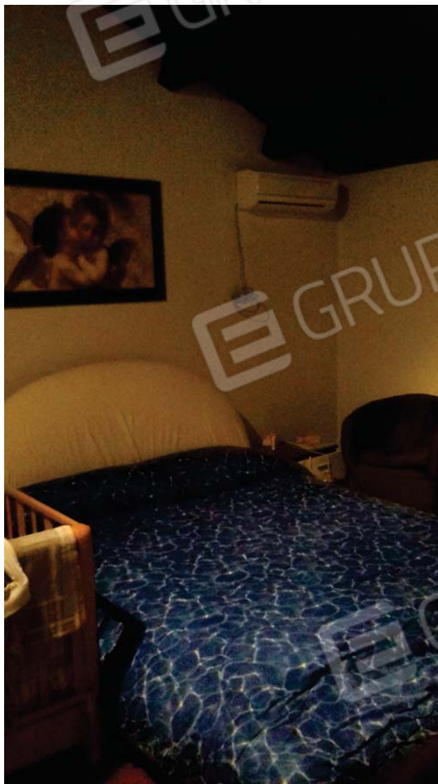
FOTO 16 ALLOGGIO PRINCIPALE STANZA LETTO PRIMO PIANO

Via M. D'Azeglio 38 - 48121 Ravenna - www.stefanofocacciaarchitetti.it T +390544215210 F +390544246754 M. info@stefanofocacciaarchitetti.it C.F. FCCSFN66S10C553W P.I.V.A. 00599440393