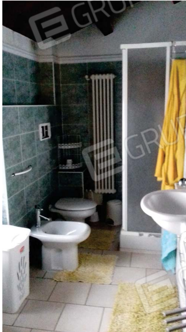
FOTO 15 ALLOGGIO PRINCIPALE BAGNO PRIMO PIANO