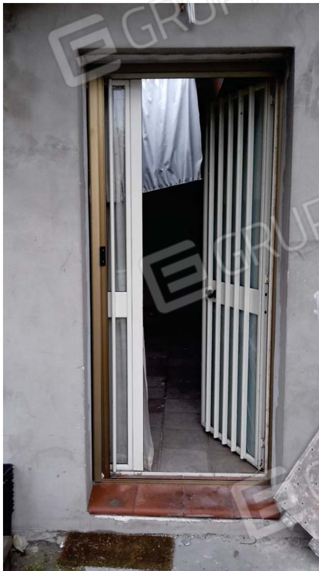
FOTO 7 INGRESSO UNITA' IMMOBILIARE RICAVA CON ACCESSO SUL RETRO

Via M. D'Azeglio 38 48121 Ravenna www.stefanofocacciaarchitetti.it T +390544215210 F +390544246754 M. info@stefanofocacciaarchitetti.it C.F. FCCSFN66S10C553W P.I.V.A. 00599440393