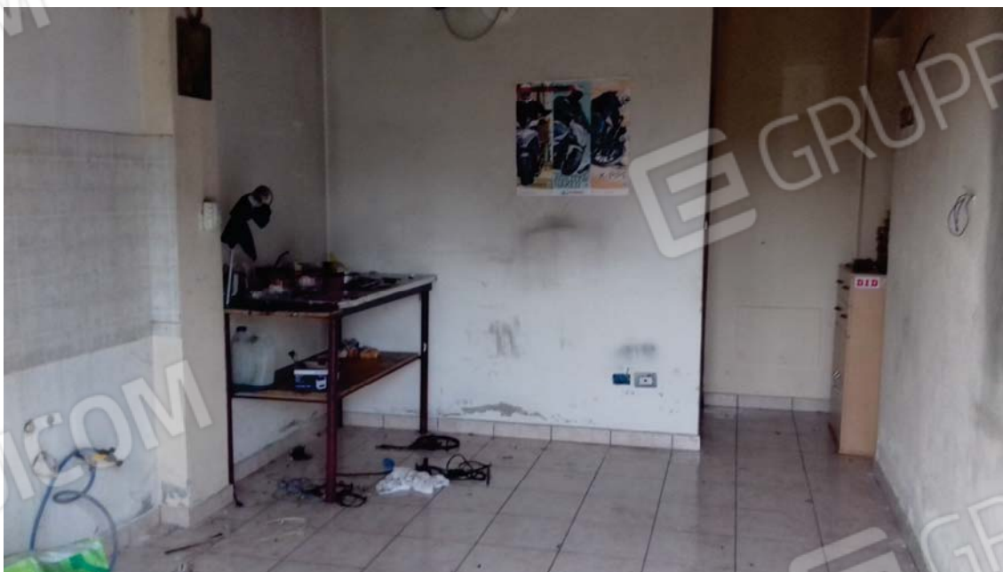
FOTO 4 MONOSTANZA AL PIANO TERRA LATO SINISTRO RICAVATA NELL'AUTORIMESSA