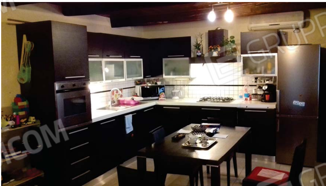
FOTO 14 ALLOGGIO PRINCIPALE SOGGIORNO CUCINA