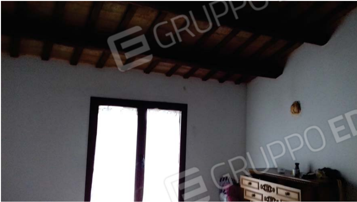
FOTO 11 STANZA DA LETTO UNITA' CON ACCESSO SUL RETRO