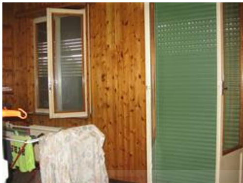
vista interna camera 3