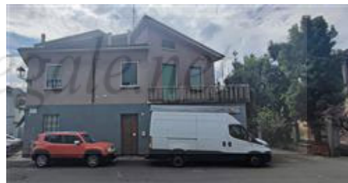
vista esterna da via De Gasperi