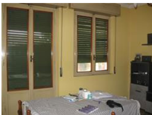
vista interna del soggiorno