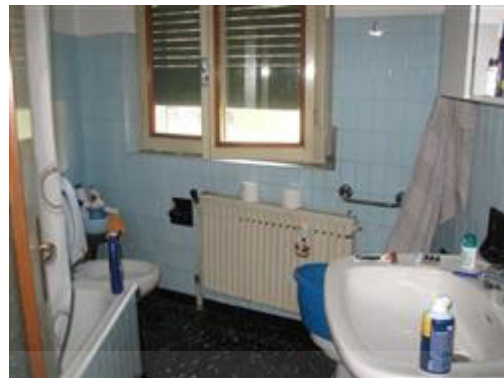
vista interna bagno