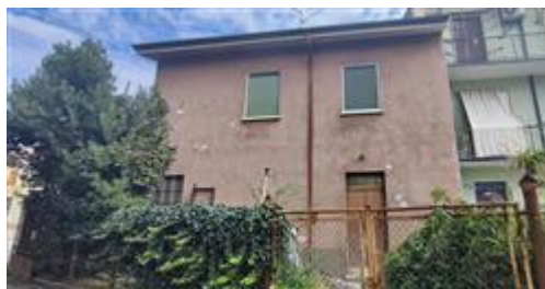
vista esterna lato ovest