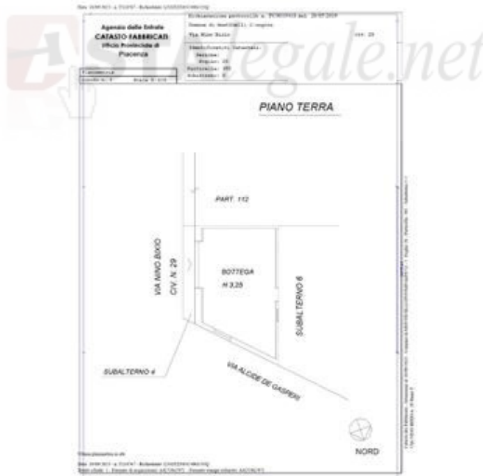
negozio planimetria catastale sub 5