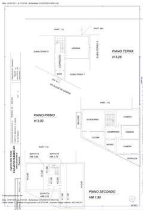
appartamento planimetria catastale sub 6