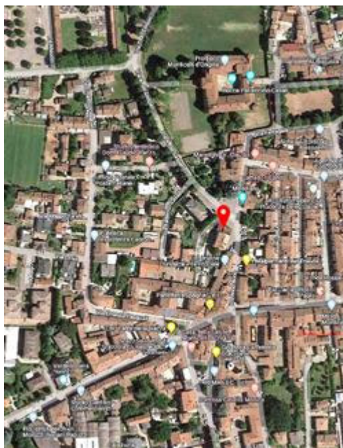
vista area della zona centrale di Monticelli D'Ongina