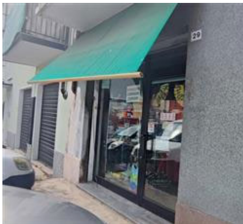
vista esterna negozio via Nino Bixio 29