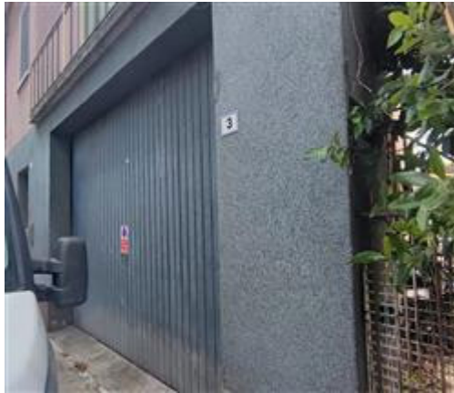
vista esterna dell'autorimessa da via De Gasperi