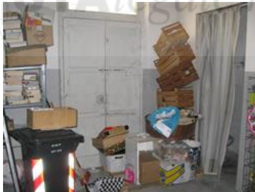
servizio non autorizzato situato dietro la tenda

Tempi necessari per la regolarizzazione: 7 giorni