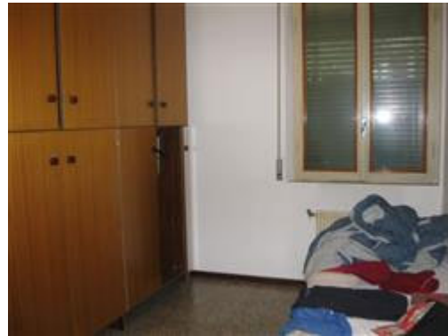
vista interna camera 2