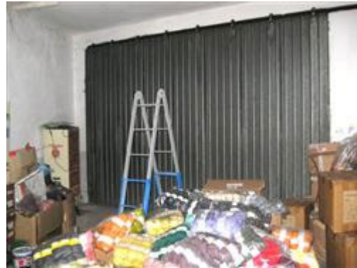
vista interna autorimessa