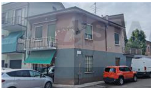
vista del fabbricato angolo via Bixio e via De Gasperi

L'intero edificio sviluppa 3 piani, 3 piani fuori terra, .