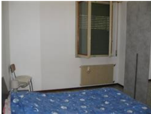
vista interna camera 1