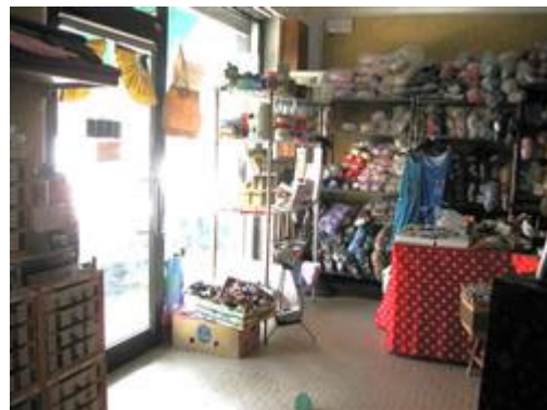
vista interna negozio