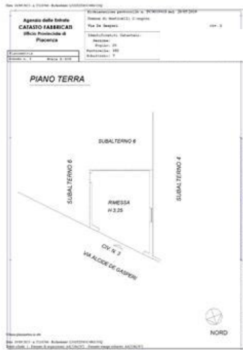
autorimessa planimetria catastale sub 7