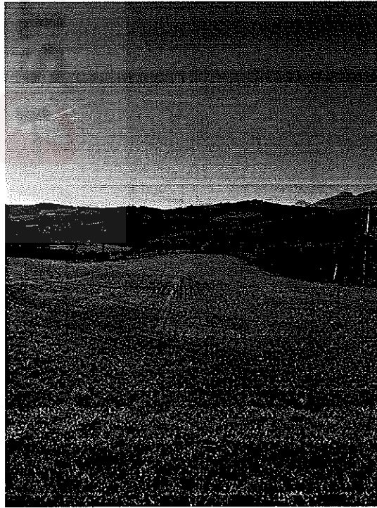
Vista terreni del LOTTO A