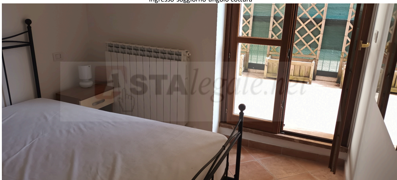
Camera e terrazzo