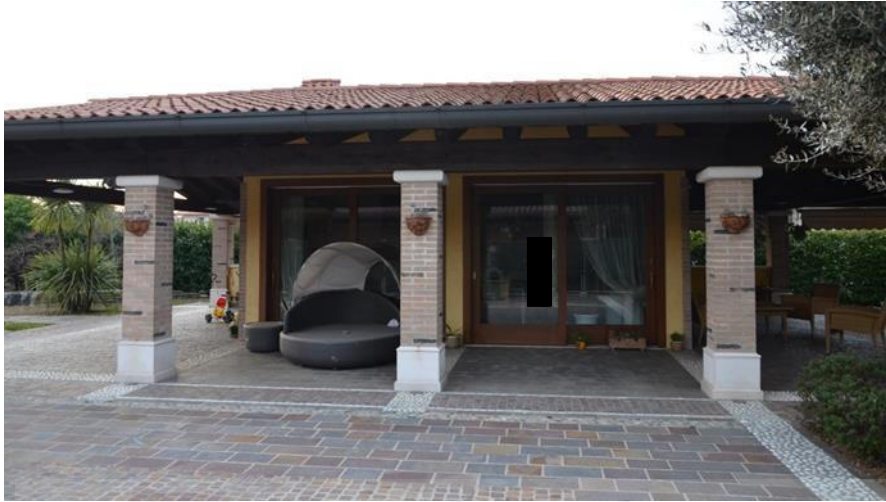
Lato est edificio autorizzato a garage sub 3 collegato con il pergolato all'abitazione

perimetrale in laterizio intonacato e tinteggiato, travi in legno a vista, pilatri quadrati dimensioni 38 cm x 38 cm con finitura in mattoni in laterizio con faccia a vista, nel prospetto ovest sono presenti tre finestre protette da oscuri in legno. Si tratta di un edificio autorizzato a garage ma utilizzato a dependance con bagno, e predisposizione per cucina esterna lato sud, l'altezza autorizzata è pari a ml 2.50.