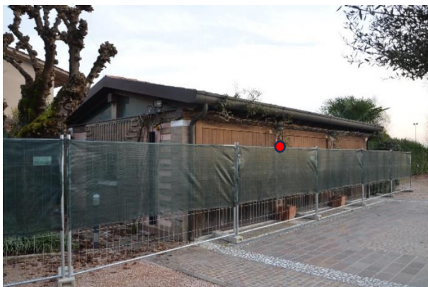
Edificio a garage porzione est in proprietà

Sul lato est della proprietà, lungo il confine, è indicata catastalmente e presente sul posto una porzione di edificio (sub 4) della quale non si è trovata traccia di autorizzazione edilizia, l'edificio risulta in gran parte realizzato su altra proprietà, non è stato possibile visionarlo internamente in quanto transennato.