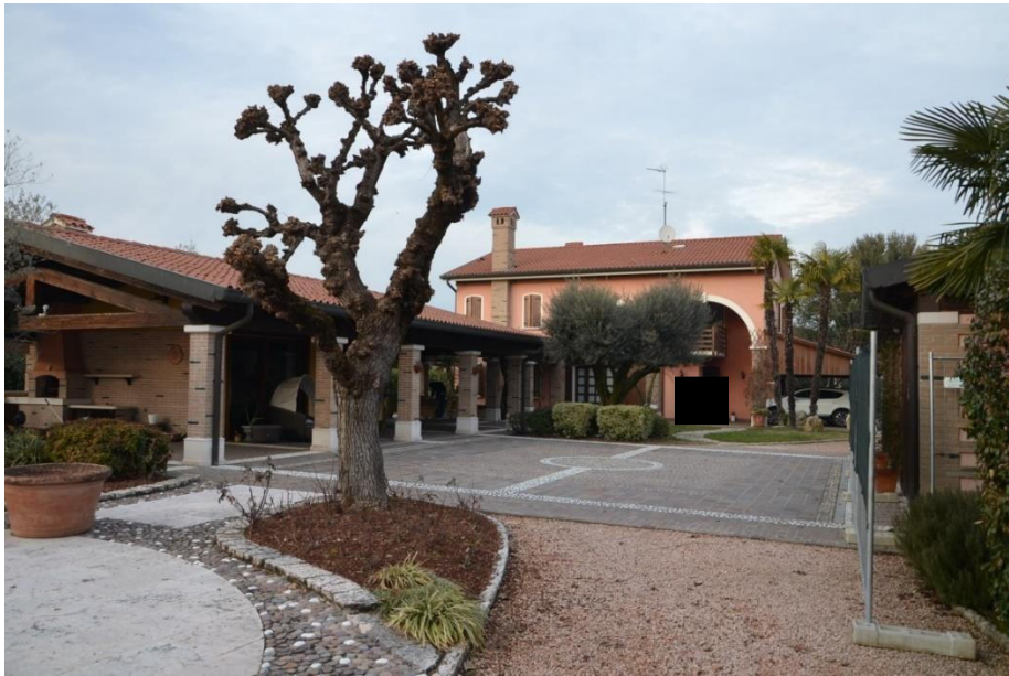
Vista da sud di parte del compendio immobiliare con aree esterne pavimentate

L'area esterna è in parte pavimentata con lastre di trachite, cubetti di porfido, ciottoli di fiume che formano disegni geometrici, camminamenti e spazi pertinenziali all'edificio: lato est del garage, lato sud del garage con piazzetta pavimentata e camminamenti, fascia di collegamento tra abitazione e garage nella zona corrispondente al ex pergolato ora portico.