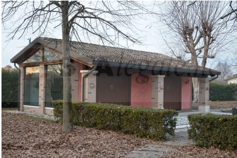
Edificio catastalmente identificato come disbrigo e individuato nella scheda con il sub 2

Si tratta di un edificio non visionato internamente, con tipologia simile al precedente immobile descritto e individuato con il sub 3, a un piano fuori terra con pianta rettangolare con dimensioni esterne di ml 5.80 x ml. 10.80 circa, tetto a due falde con copertura in coppi e lattonerie in rame, porticato sul fronte est con profondità di circa 140 cm, il portico è costituito da tre pilastri con dimensione 50 cm x 50 cm con finitura in mattoni pieni in laterizio con faccia a vista, le travature del tetto sono a vista dal portico. Altezza misurata in corrispondenza del colmo, sotto trave ml 3.97 e in corrispondenza dell'angolo sud est ml 3.04 (sotto al portico).