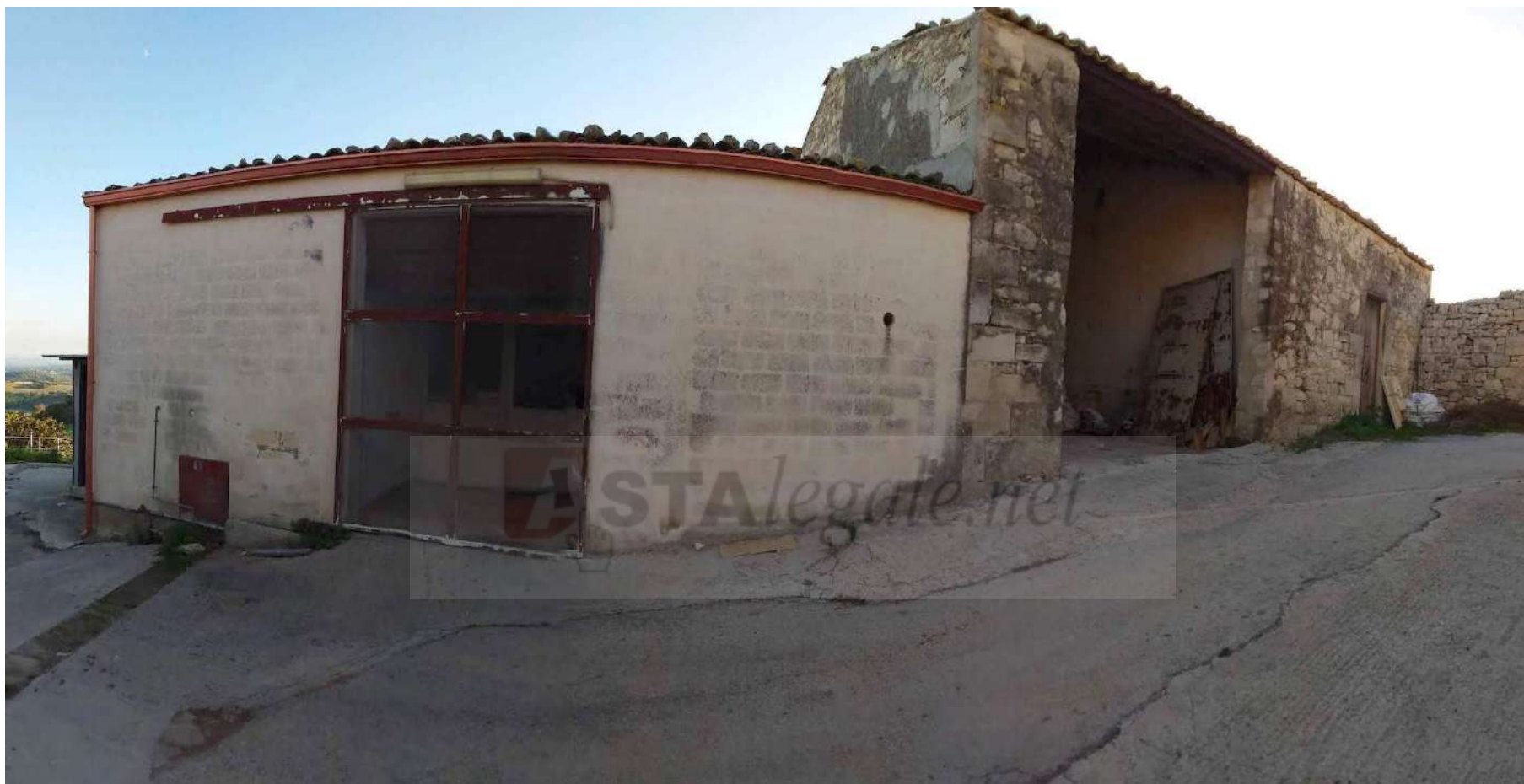
Foto 27 particella 421 caseificio cat D10