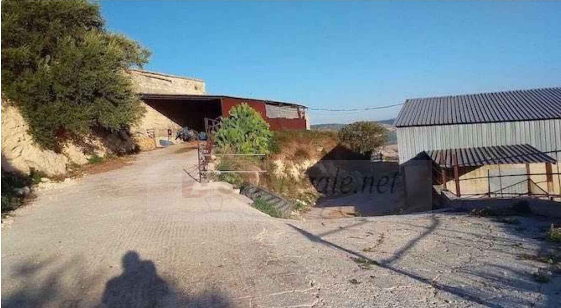
Foto 25 particella 440 tettoie cat D10