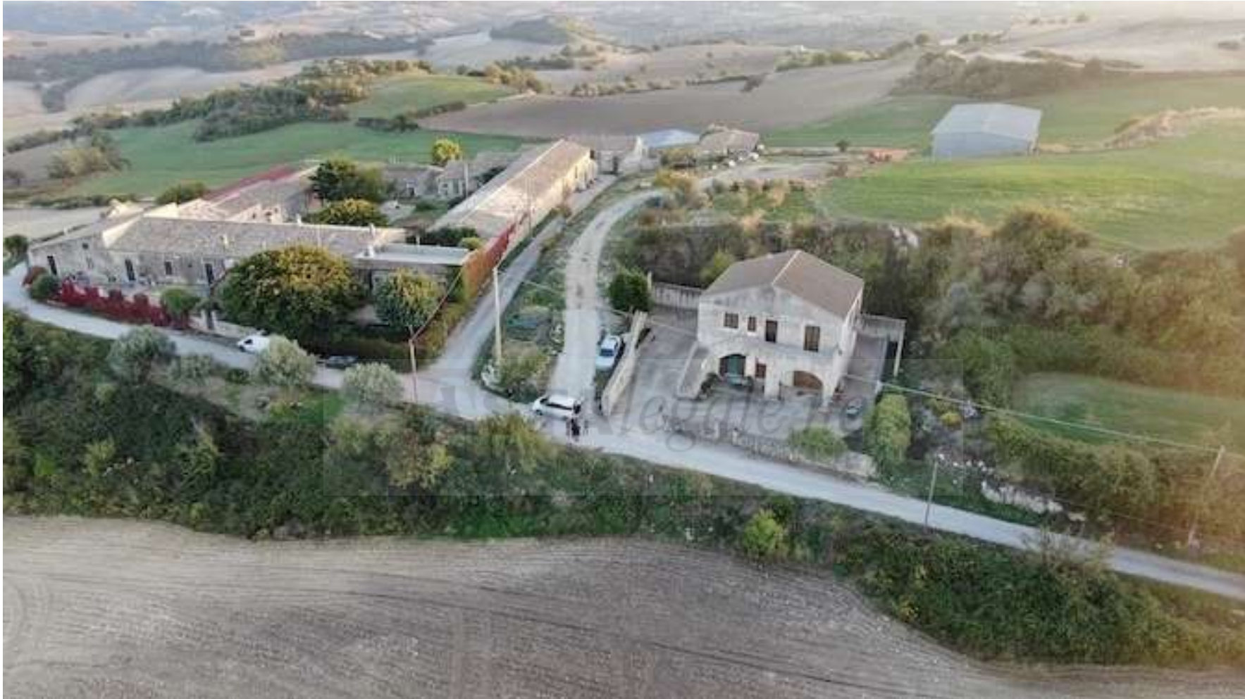
Foto 2 Lotti 1-2 accessi