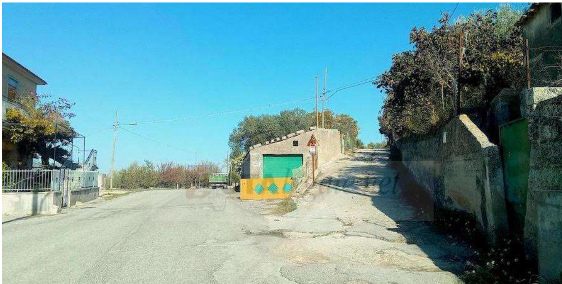
Foto 1 Lotti 1-2-3 accesso dalla SP53