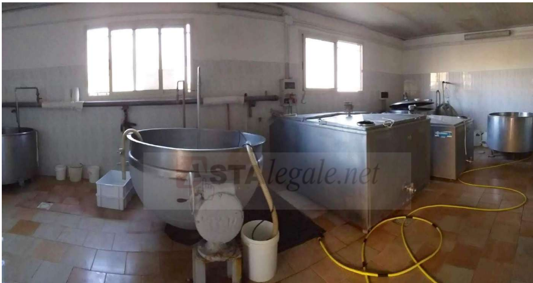
Foto 30 particella 421 caseificio cat D10