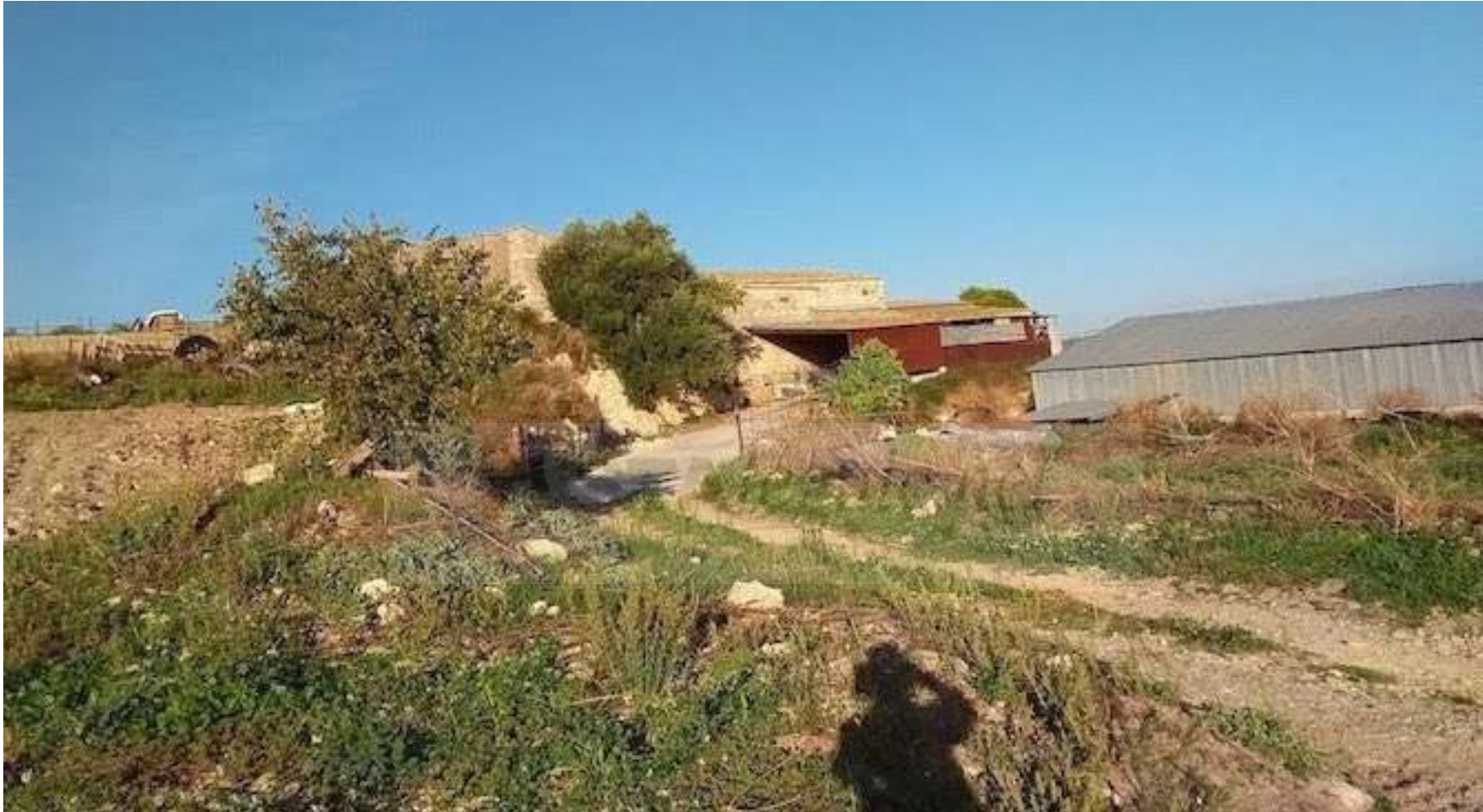
Foto 24 particella 440 tettoie cat D10