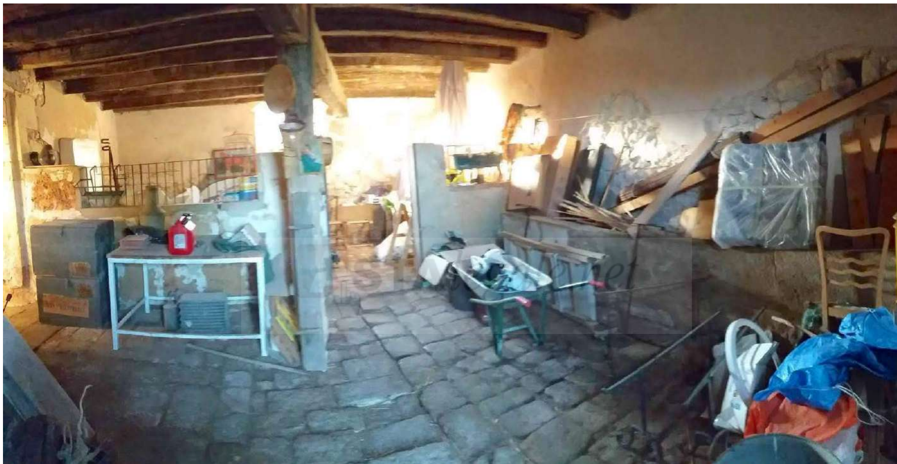
Foto 16 particella 451 deposito cat D10