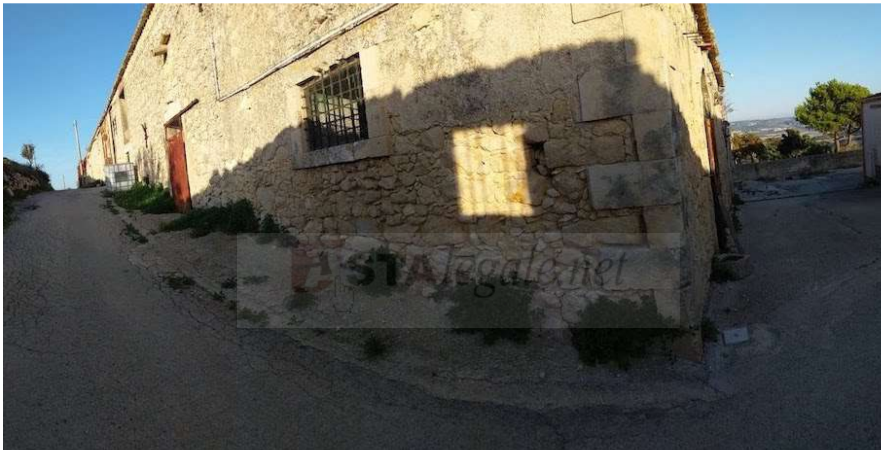
Foto 10 particella 451 deposito cat D10