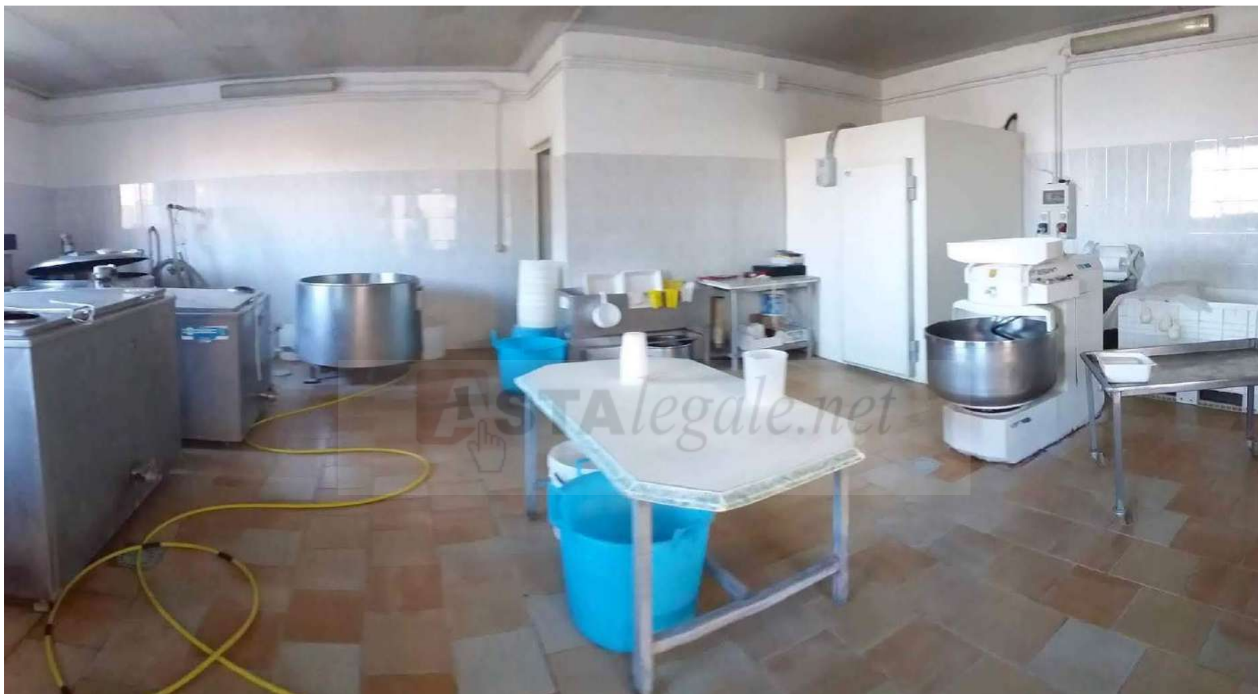
Foto 29 particella 421 caseificio cat D10