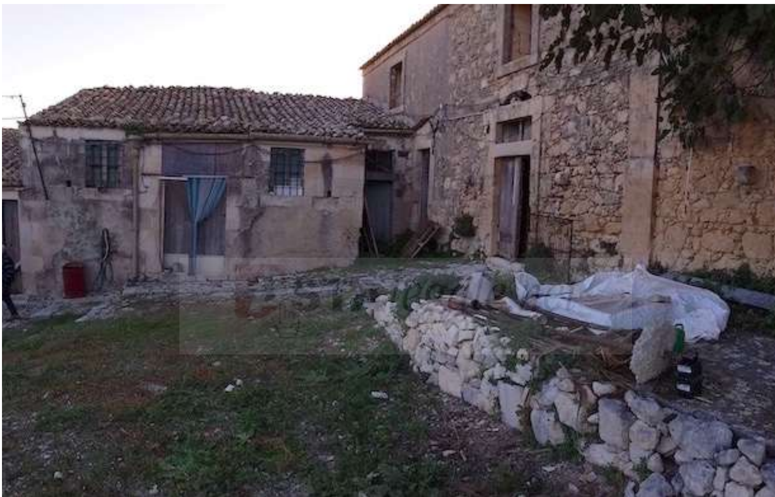
Foto 12 particella 451 deposito cat D10