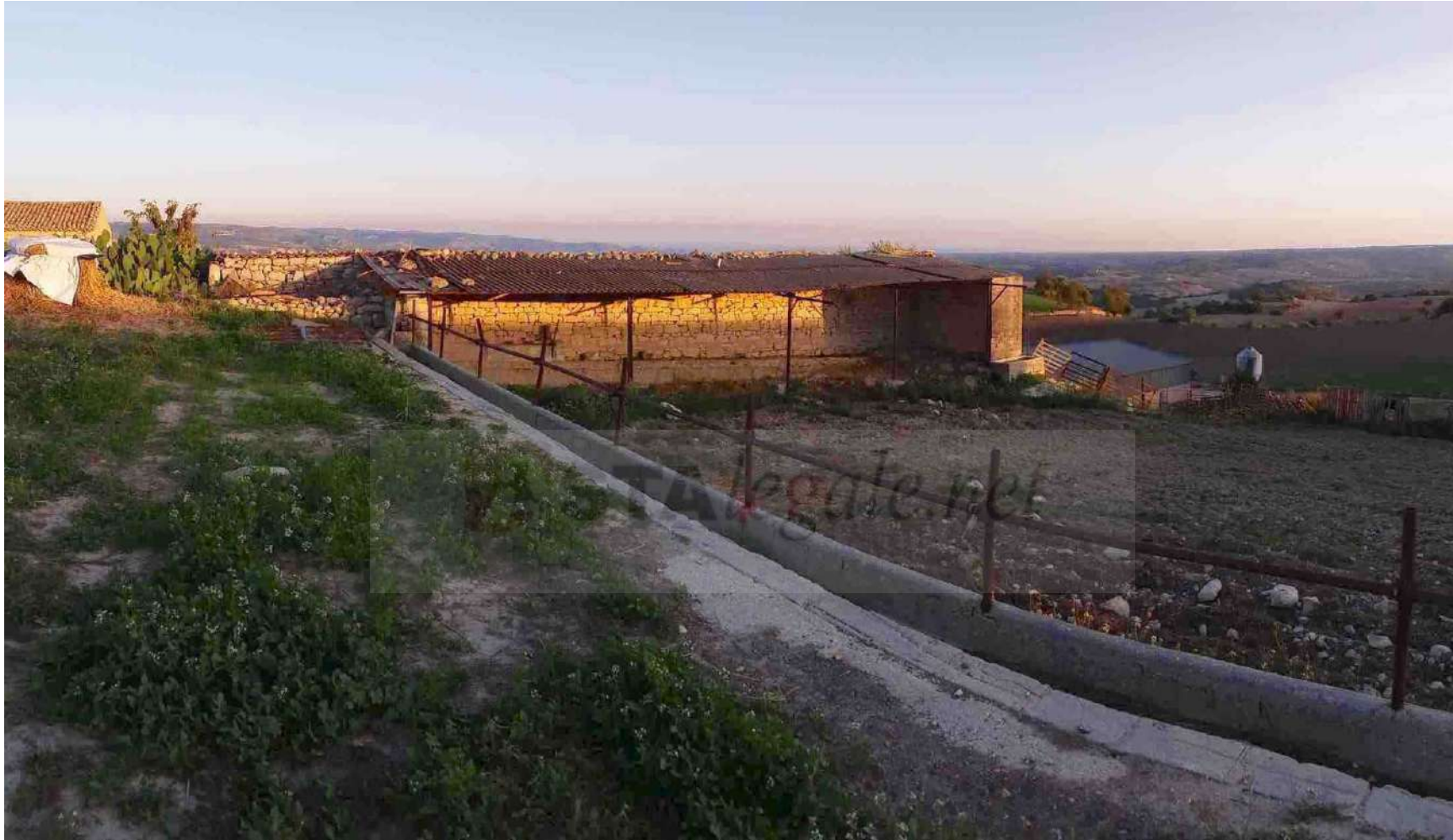
Foto 26 particella 440 tettoie cat D10