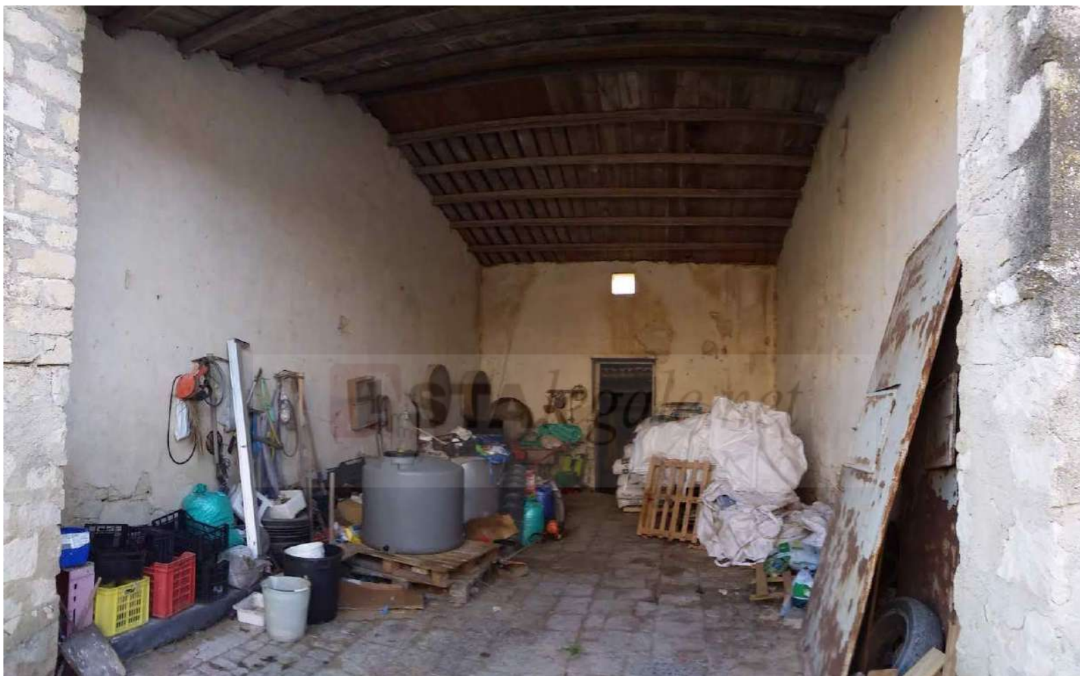
Foto 35 particella 421 deposito cat D10