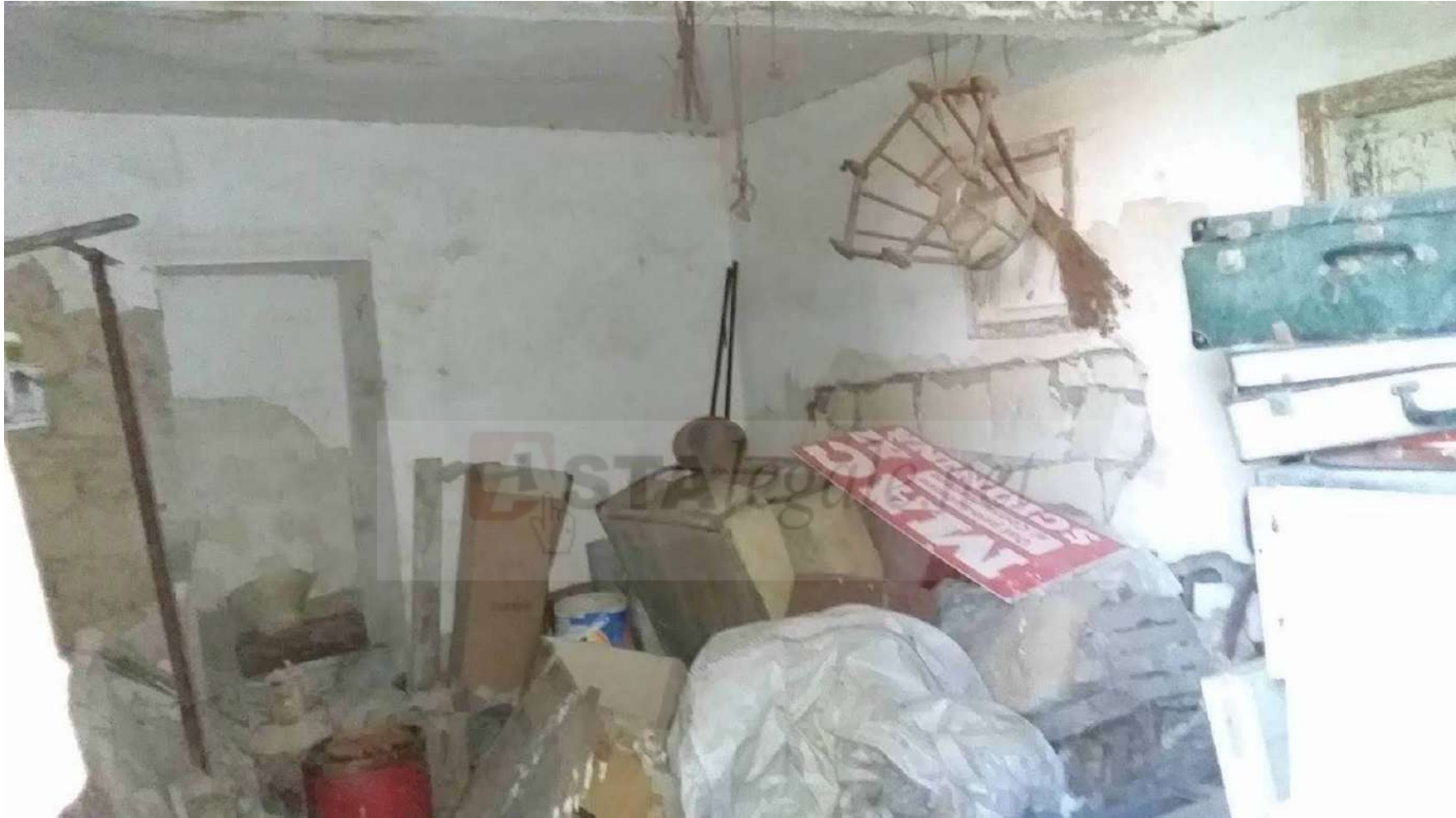
Foto 15 particella 451 deposito cat D10