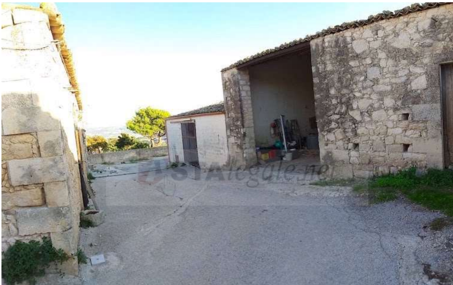
Foto 33 particella 421 deposito cat D10