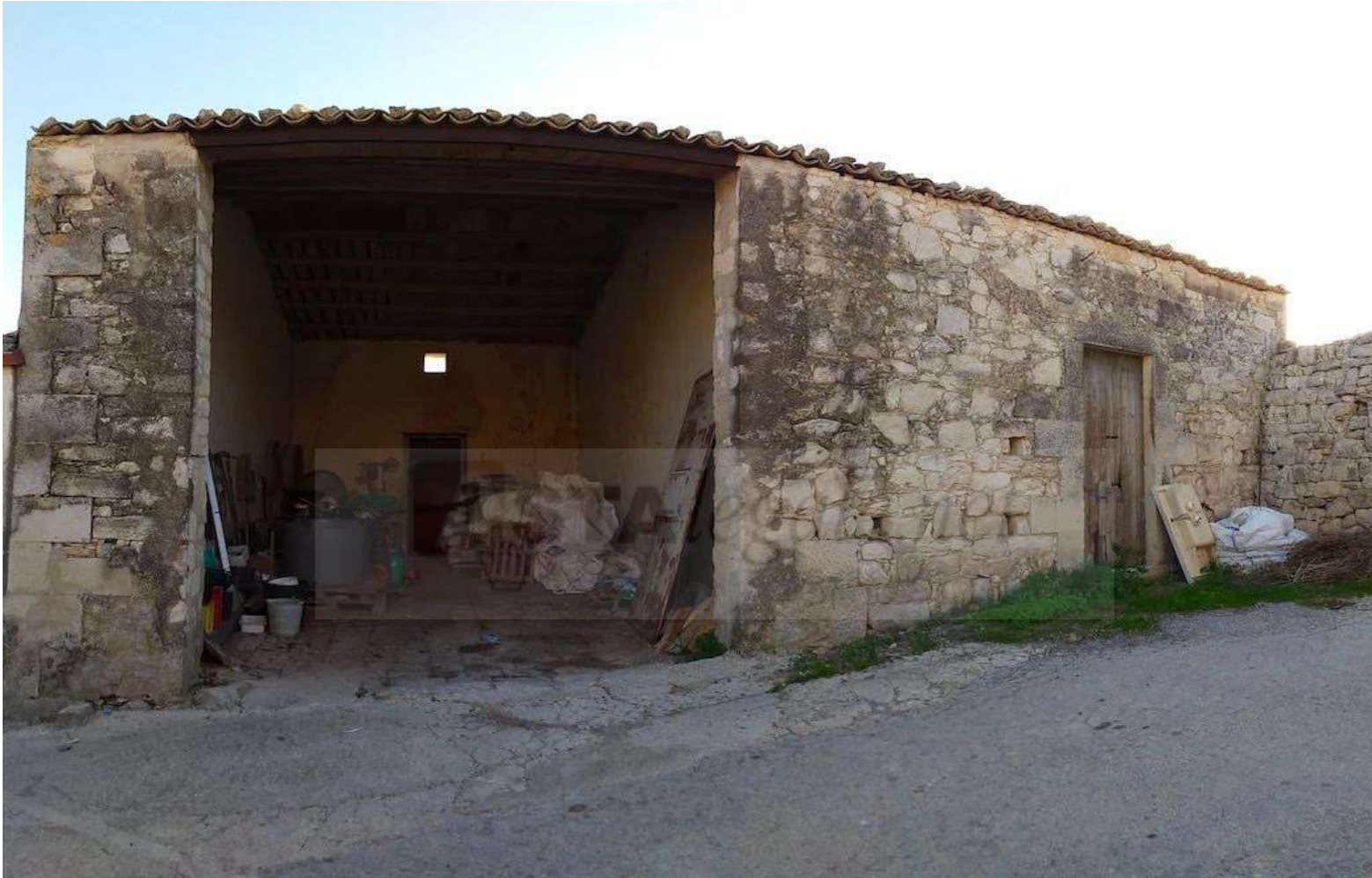
Foto 34 particella 421 deposito cat D10