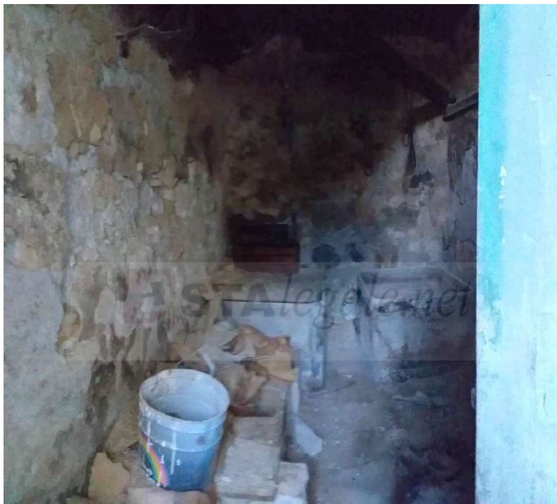
Foto 14 particella 451 deposito cat D10