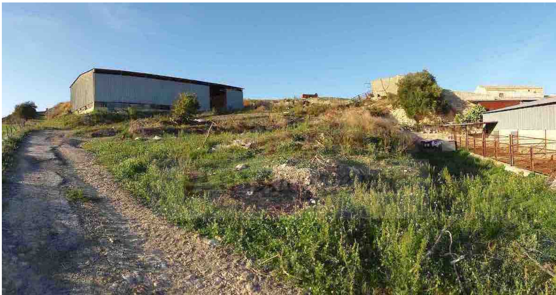
Foto 23 particella 440 fienile cat D10