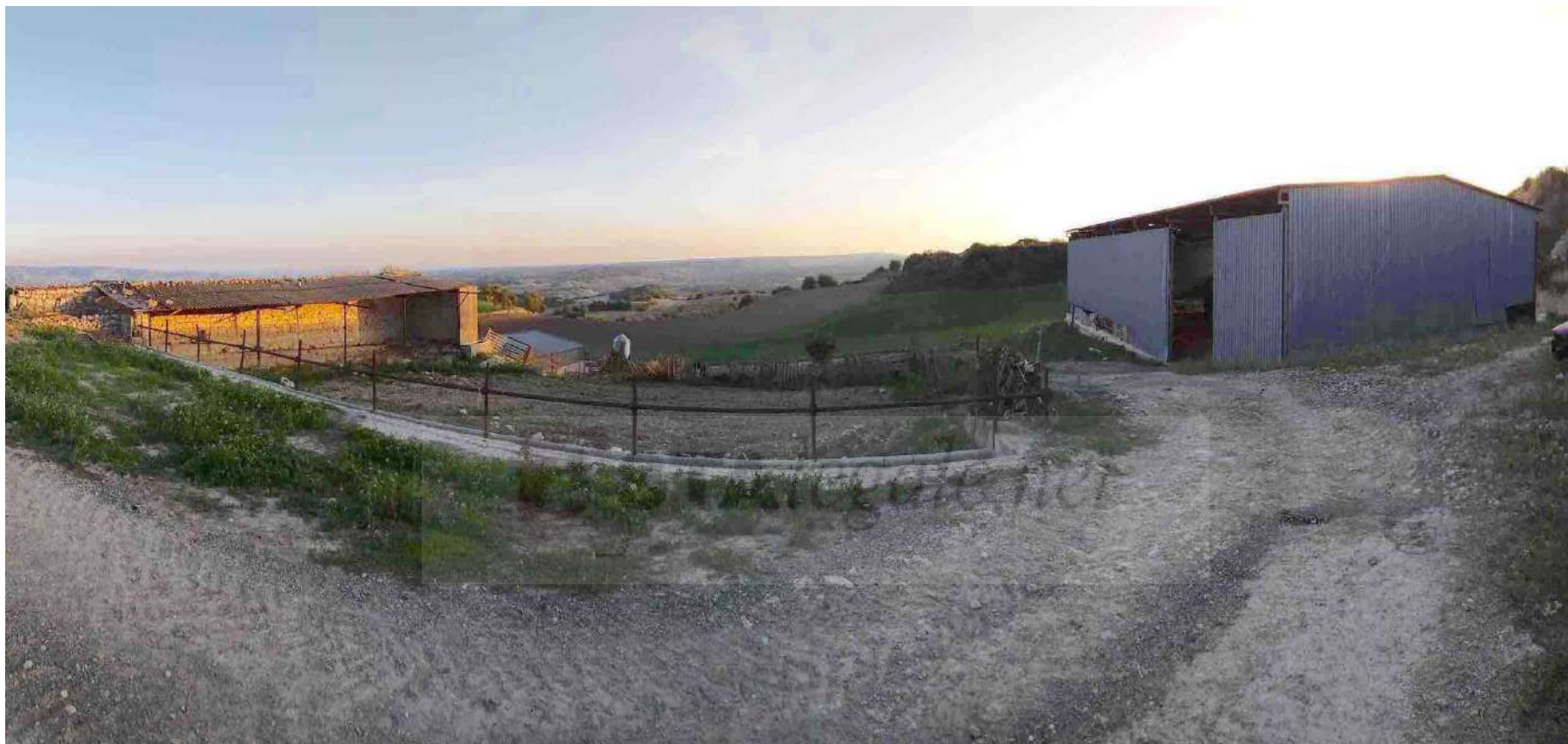
Foto 22 particella 440 fienile cat D10