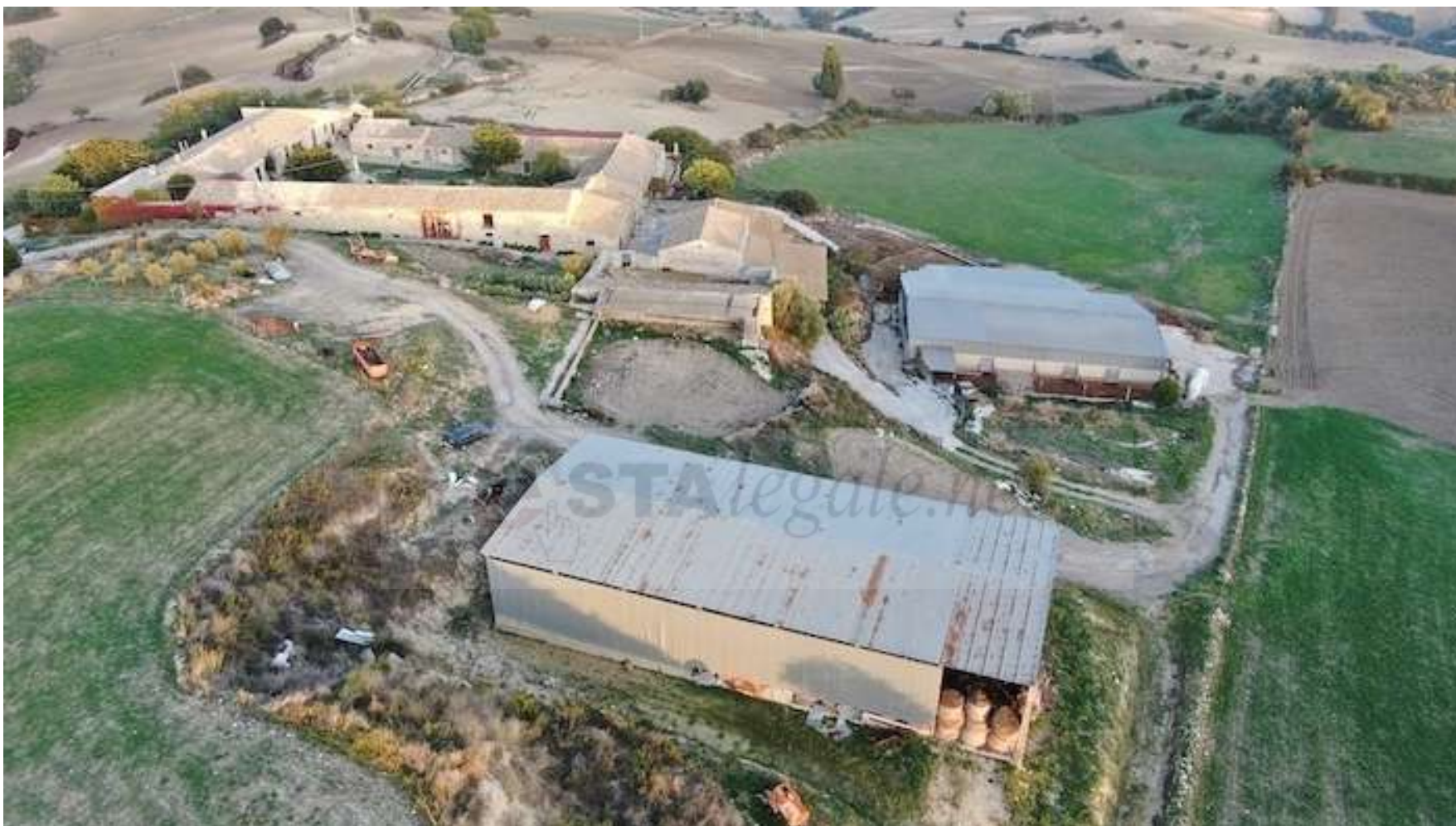
Foto 4 Lotto 2 fabbricati