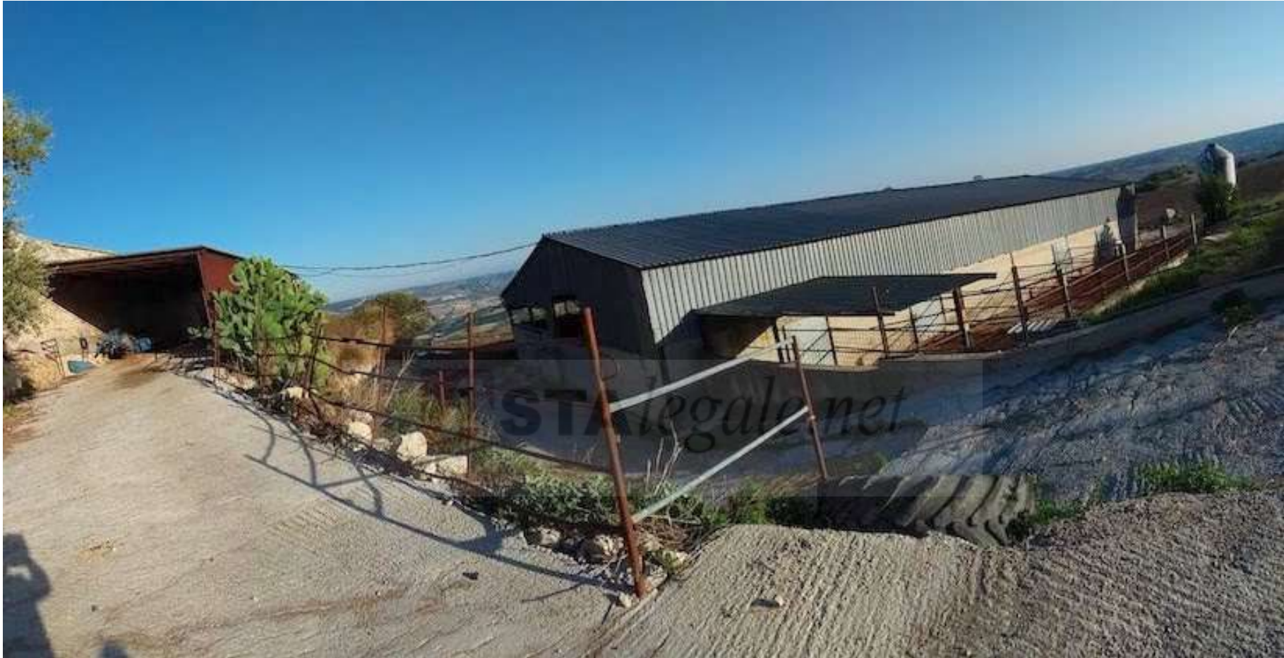
Foto 21 particella 440 stalla cat D10