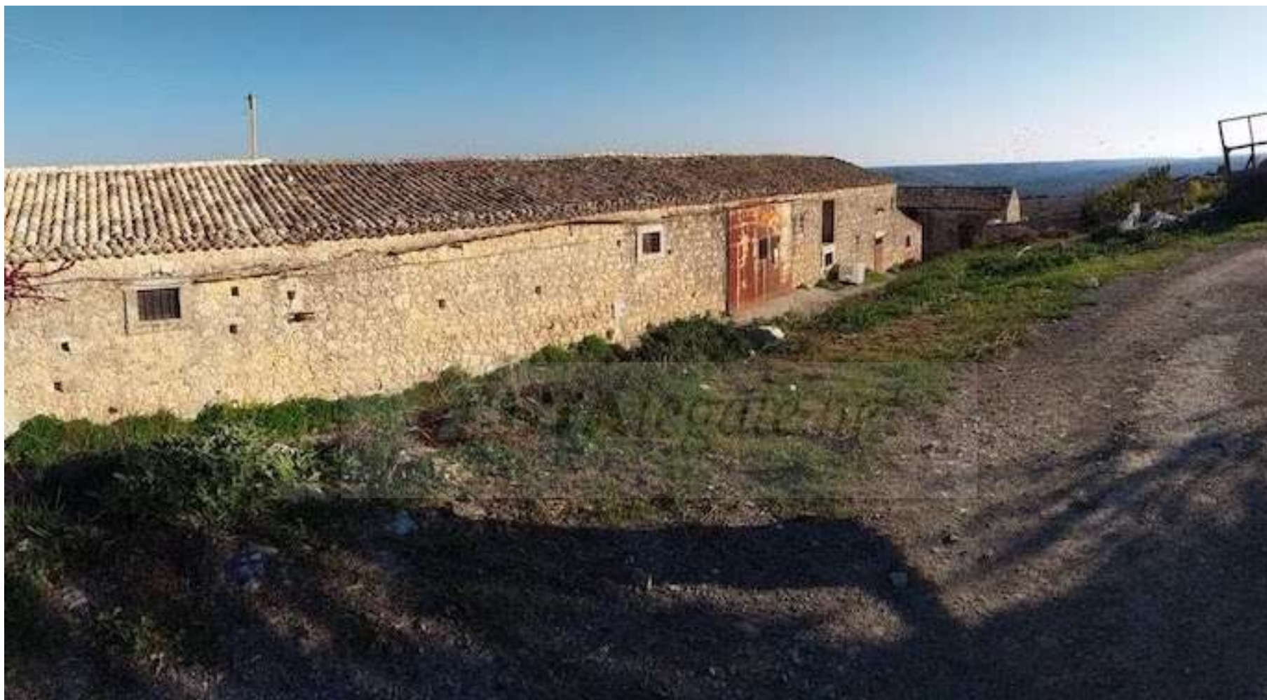
Foto 9 particella 451 deposito cat D10