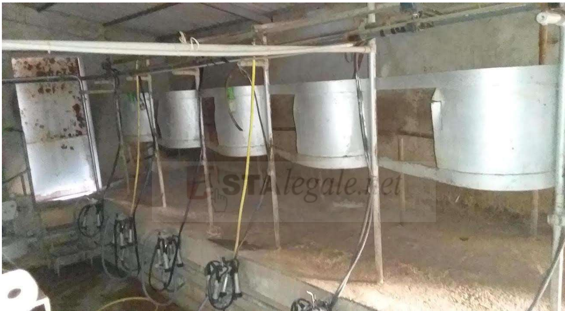
Foto 32 particella 421 sala mungitura cat D10