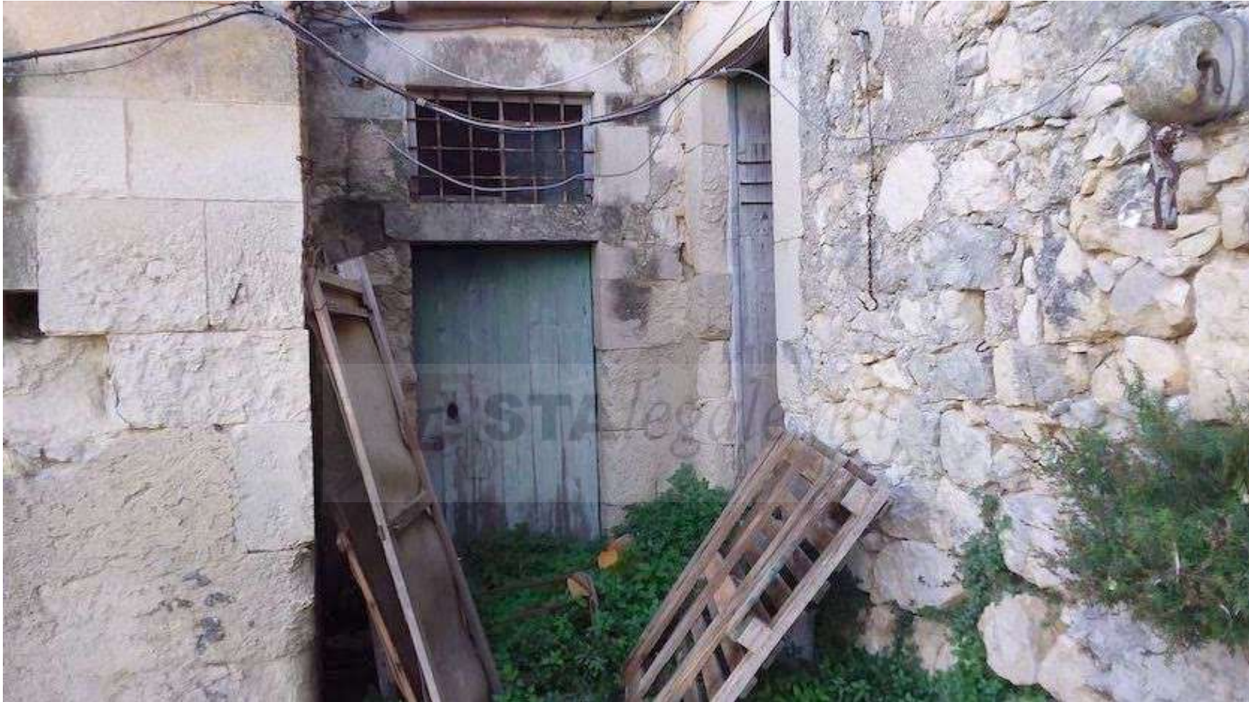
Foto 13 particella 451 deposito cat D10