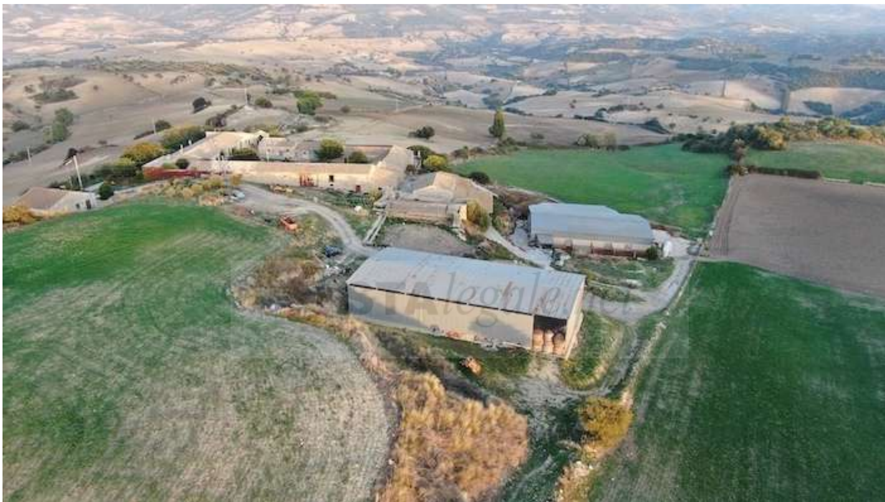
Foto 3 Lotti 1 e 2 panoramica