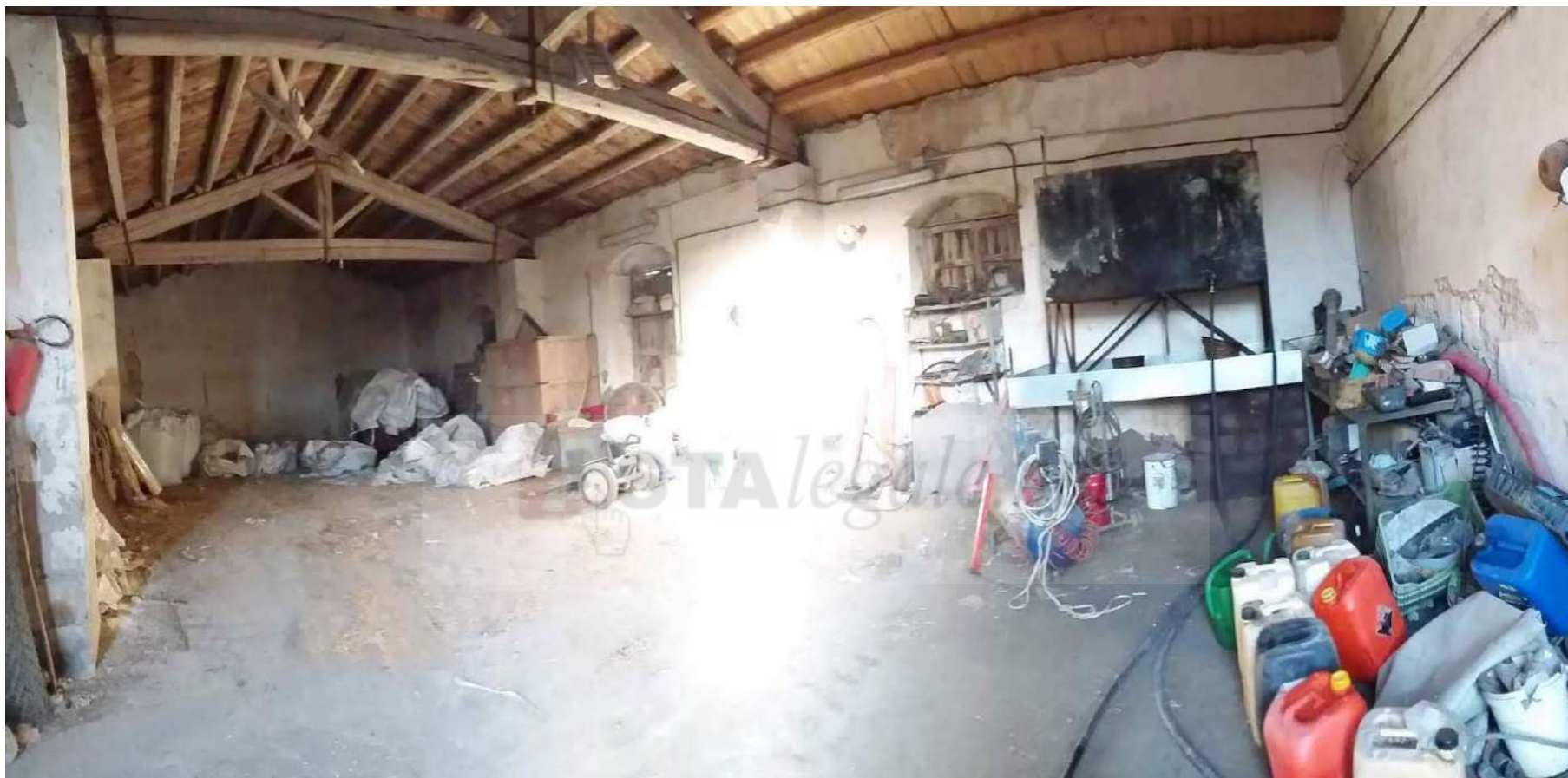
Foto 18 particella 451 deposito cat D10