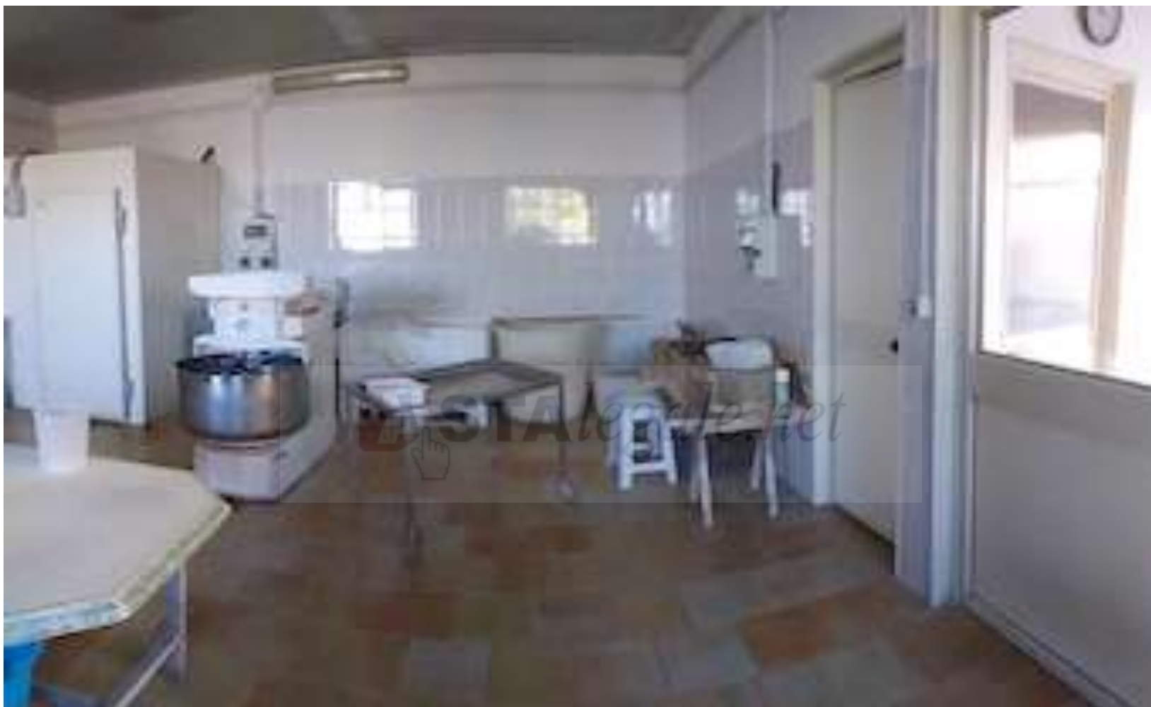
Foto 28 particella 421 caseificio cat D10