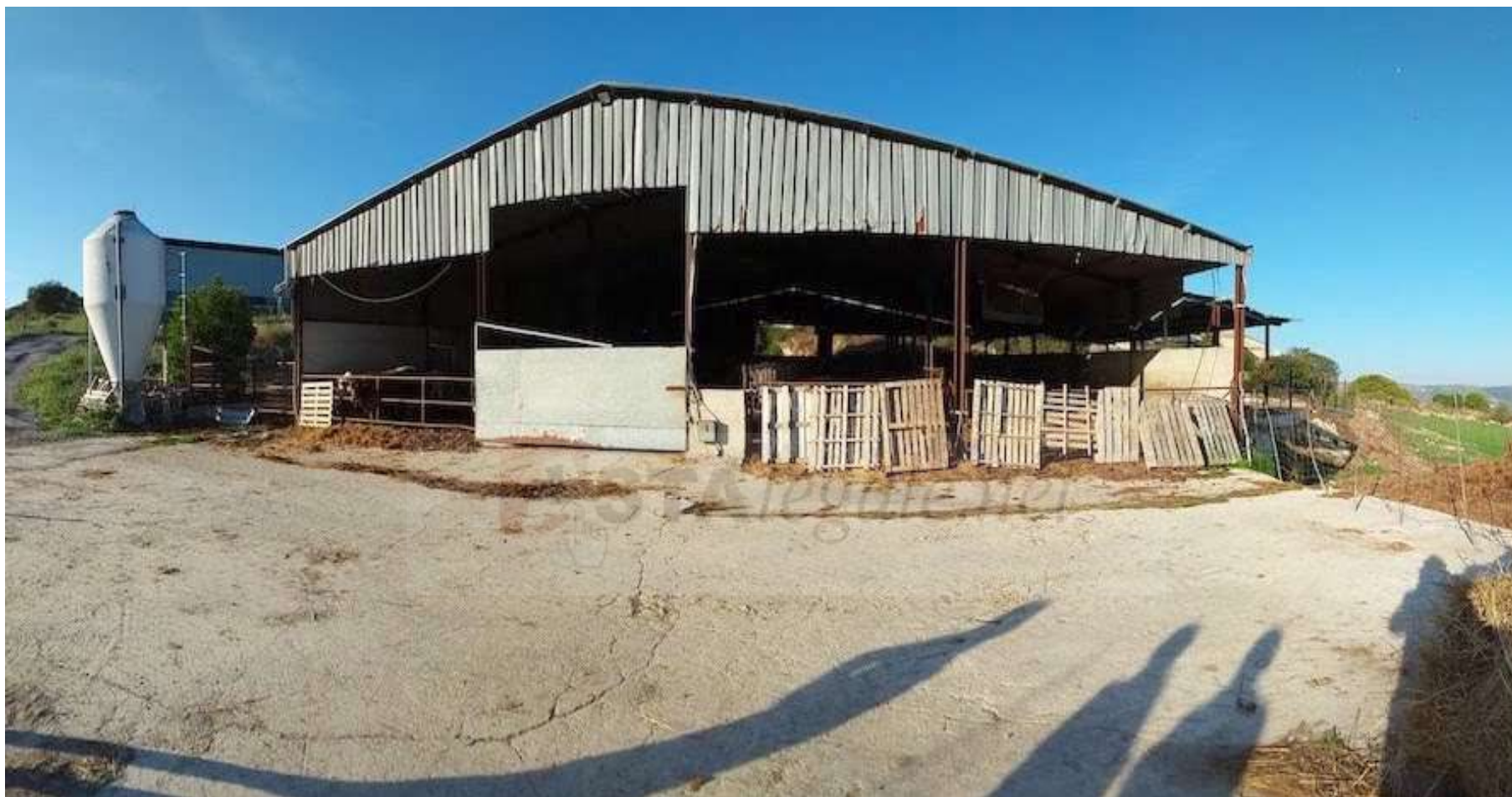
Foto 19 particella 440 stalla cat D10