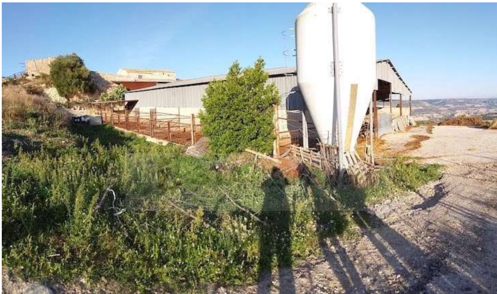
Foto 20 particella 440 stalla cat D10