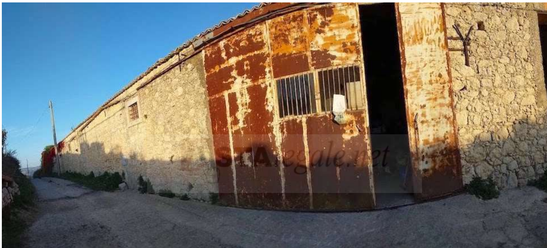
Foto 17 particella 451 deposito cat D10