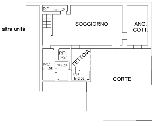
PIANO TERRA h= 2.45 m