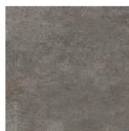
Colore: Dark Gray