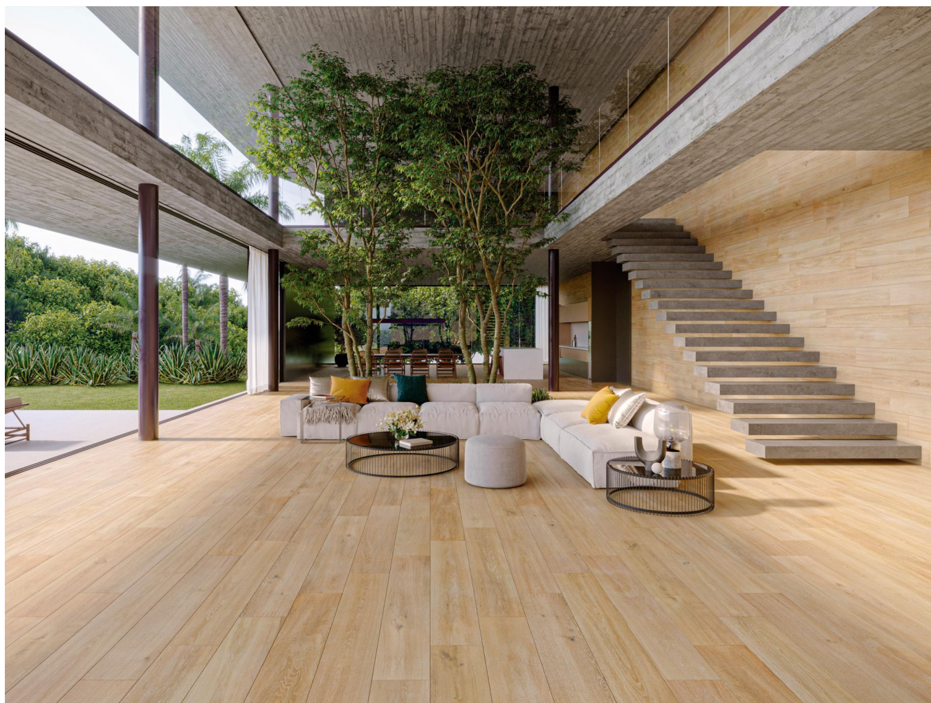
Smart – Tanzania Nut

Colore Tanzania Almond, Nut, Silver, White, Natural, Minnesota Ash