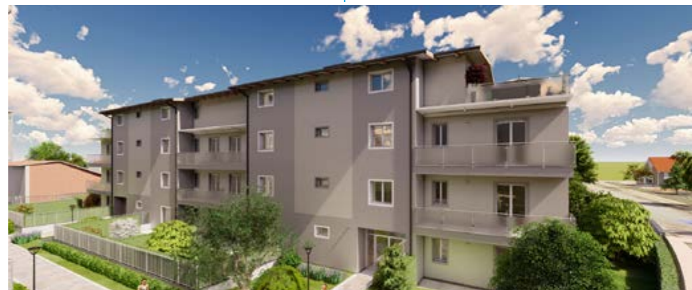
Edificio A - indipendente sui 4 lati