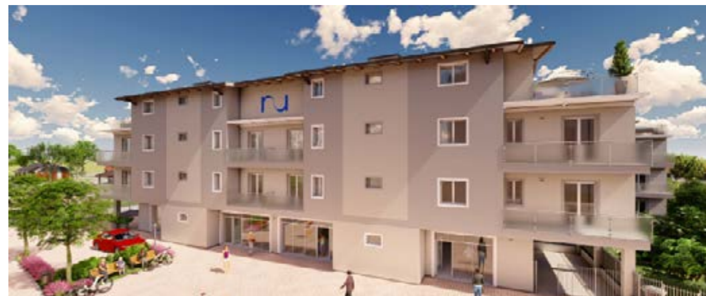
Edificio B - indipendente sui 4 lati