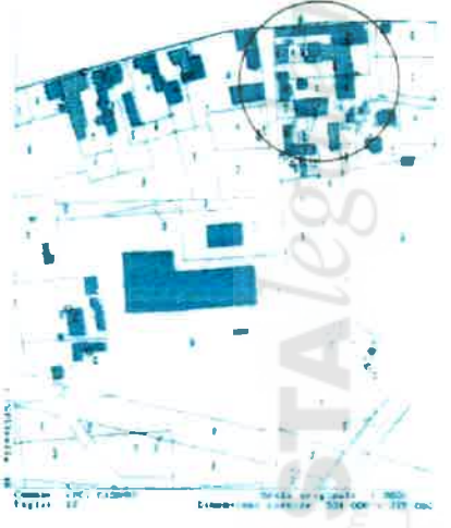
STRALCIO ESTRATTO DI MAPPA