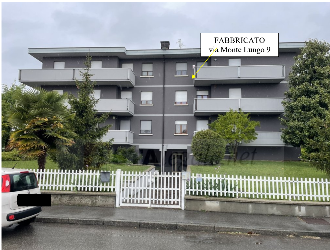
- VEDUTA FRONTE EST DEL FABBRICATO