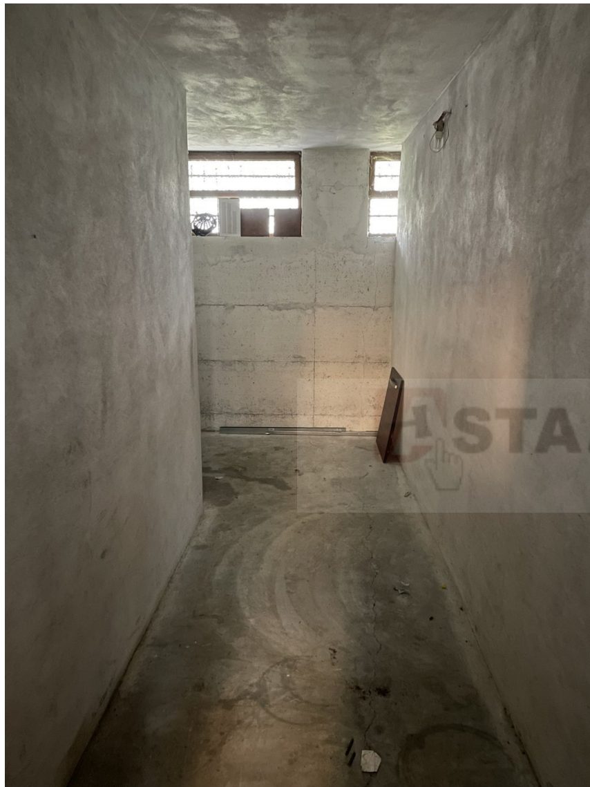
CANTINA (PIANO SEMINTERRATO)