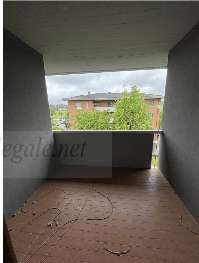
BALCONE COPERTO CUCINA