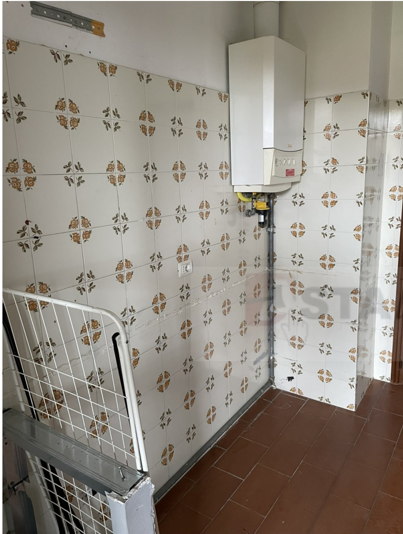
CALDAIA A MURO UBIcata IN CUCINA