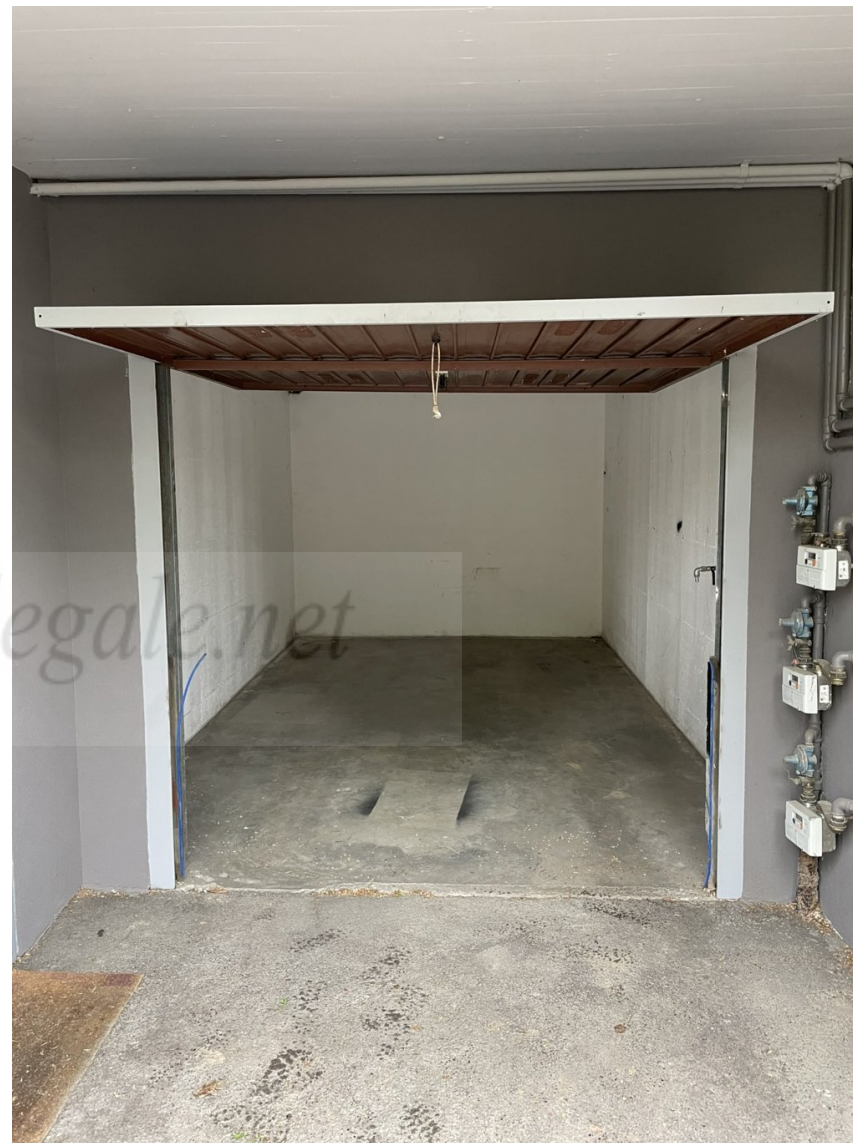
AUTORIMESSA -BOX- PIANO SMINTERRATO