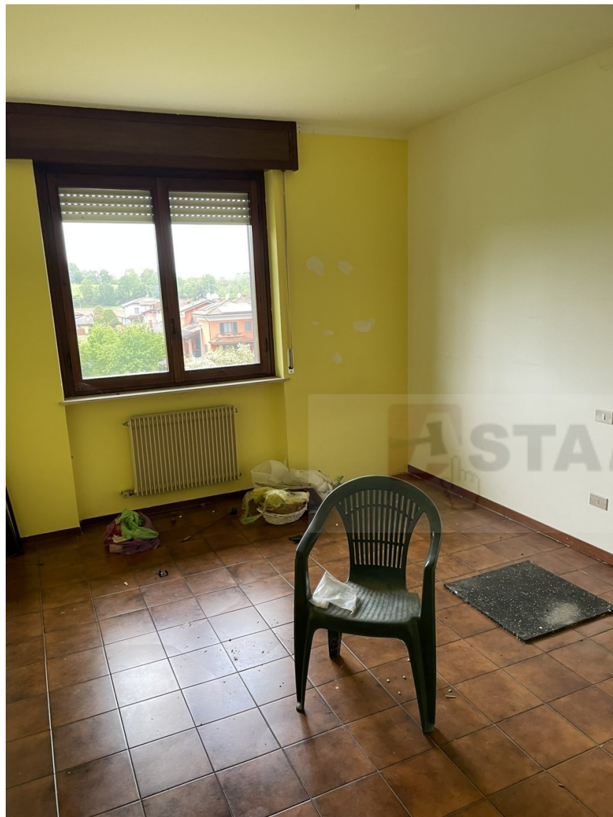
CAMERA DA LETTO n.1