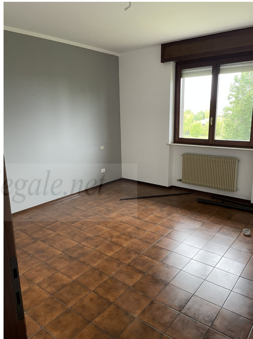
CAMERA DA LETTO n.2