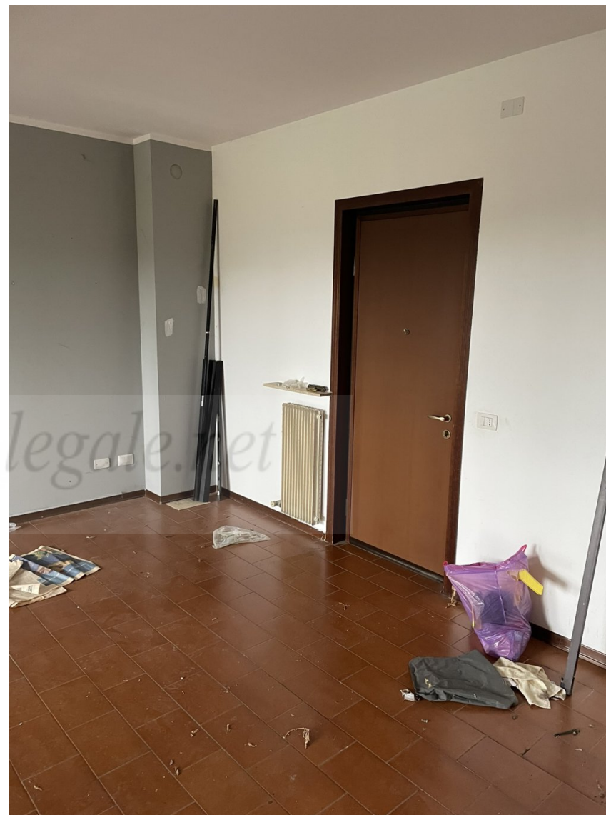
LOCALE INGRESSO- SOGGIORNO