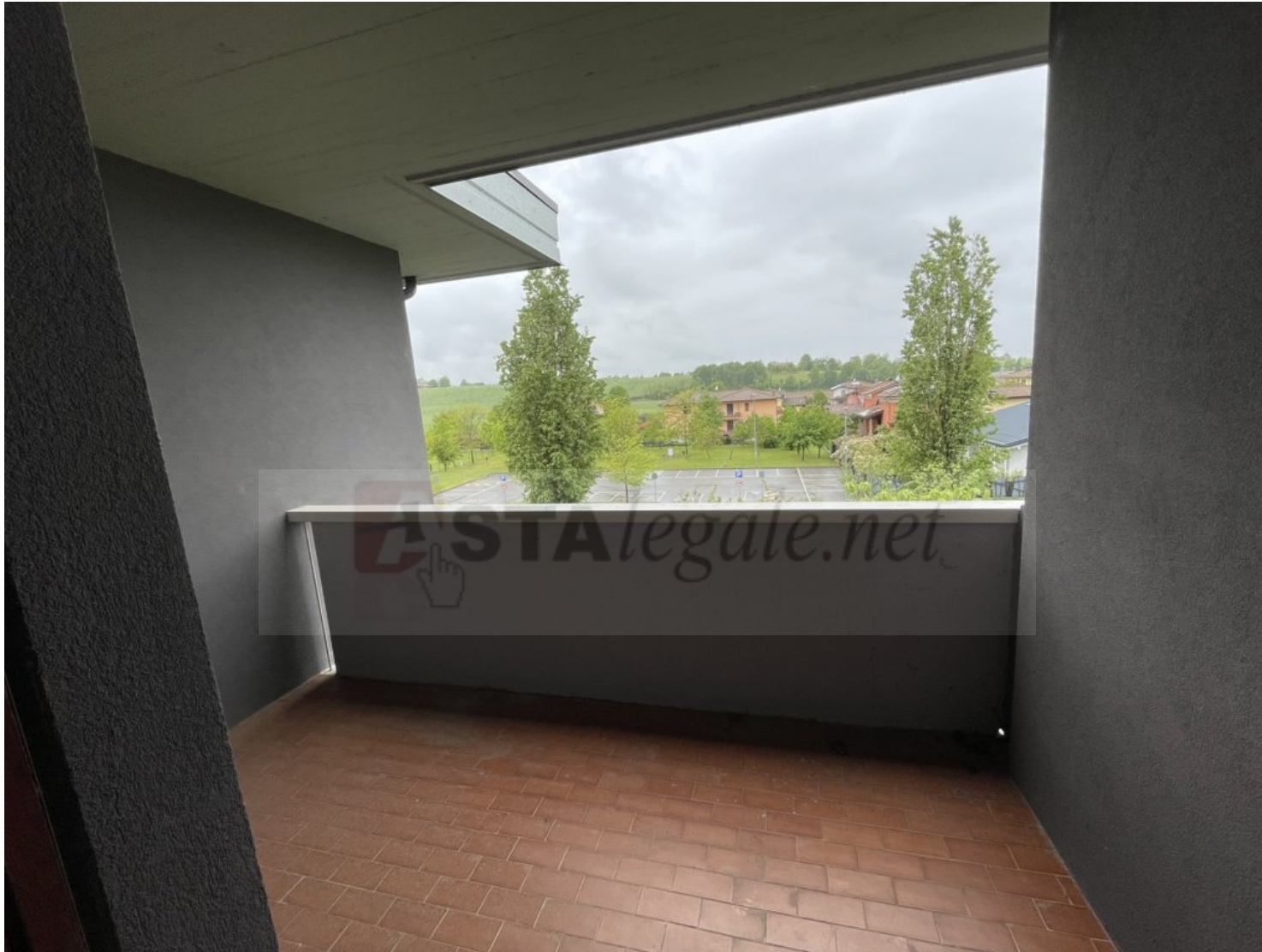
BALCONE COPERTO DEL SOGGIORNO