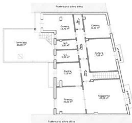
Appartamento primo piano