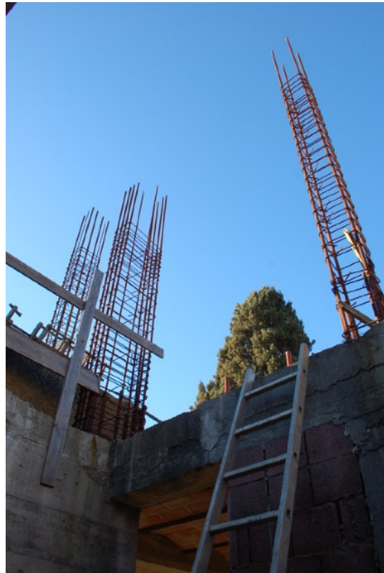
21-22 Fabbricato C (Ex Casa Colonica) interni PT