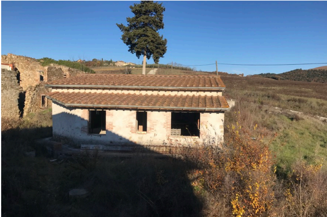
3) Fabbricato A (Ex Rimessa Agricola) vista laterale dalla finestra dell'ex fienile (B)