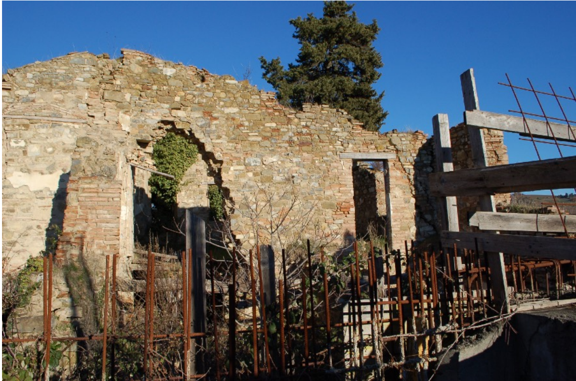
25) Fabbricato C (Ex Casa Colonica) interni