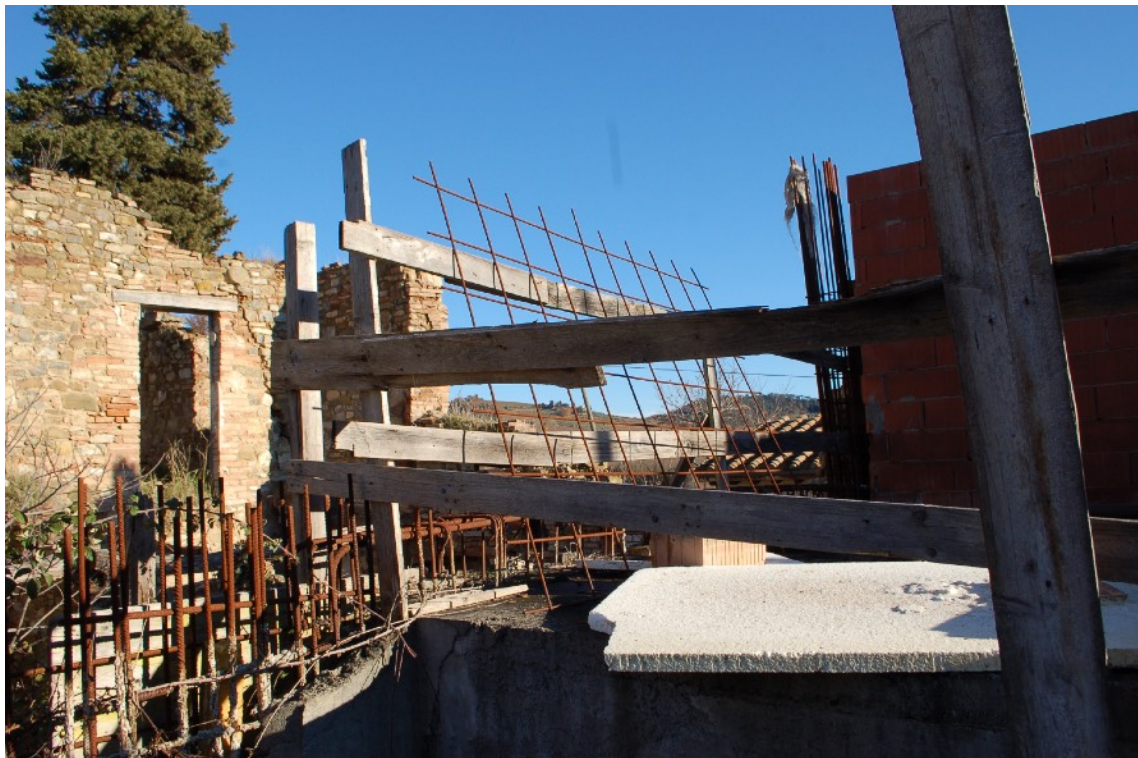
24) Fabbricato C (Ex Casa Colonica) interni