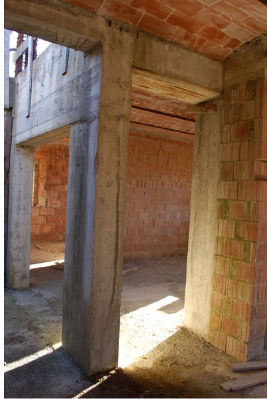
19-20 Fabbricato C (Ex Casa Colonica) interni PT