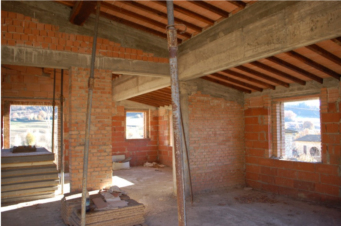
5) Fabbricato A (Ex Rimessa Agricola) interni