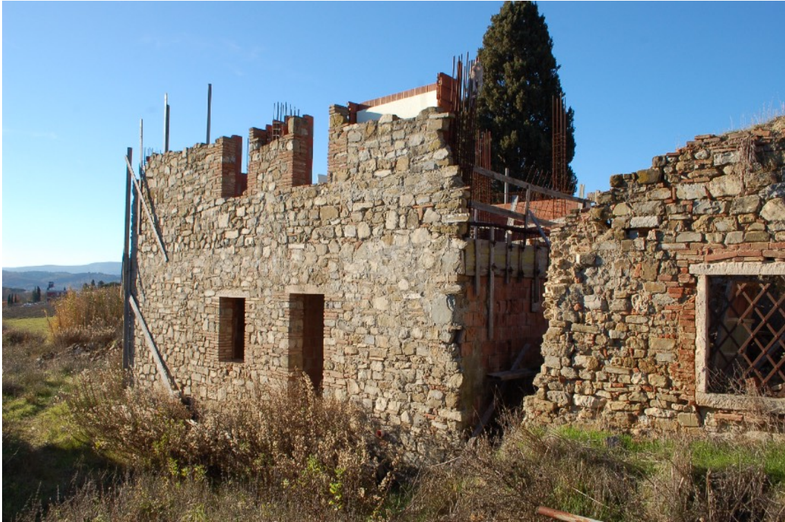
16) Fabbricato C (Ex Casa Colonica)