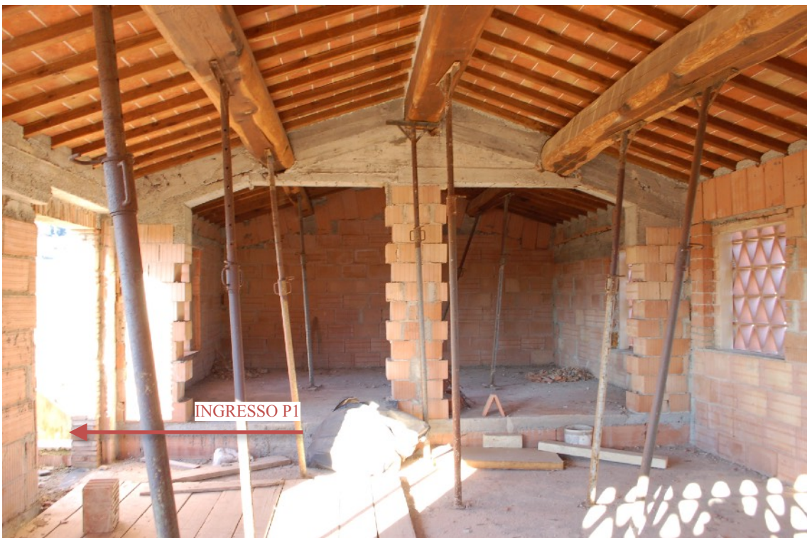
13) Fabbricato B (Ex Fienile) interni P1