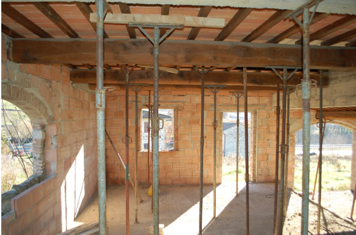
11) Fabbricato B (Ex Fienile) interni PT