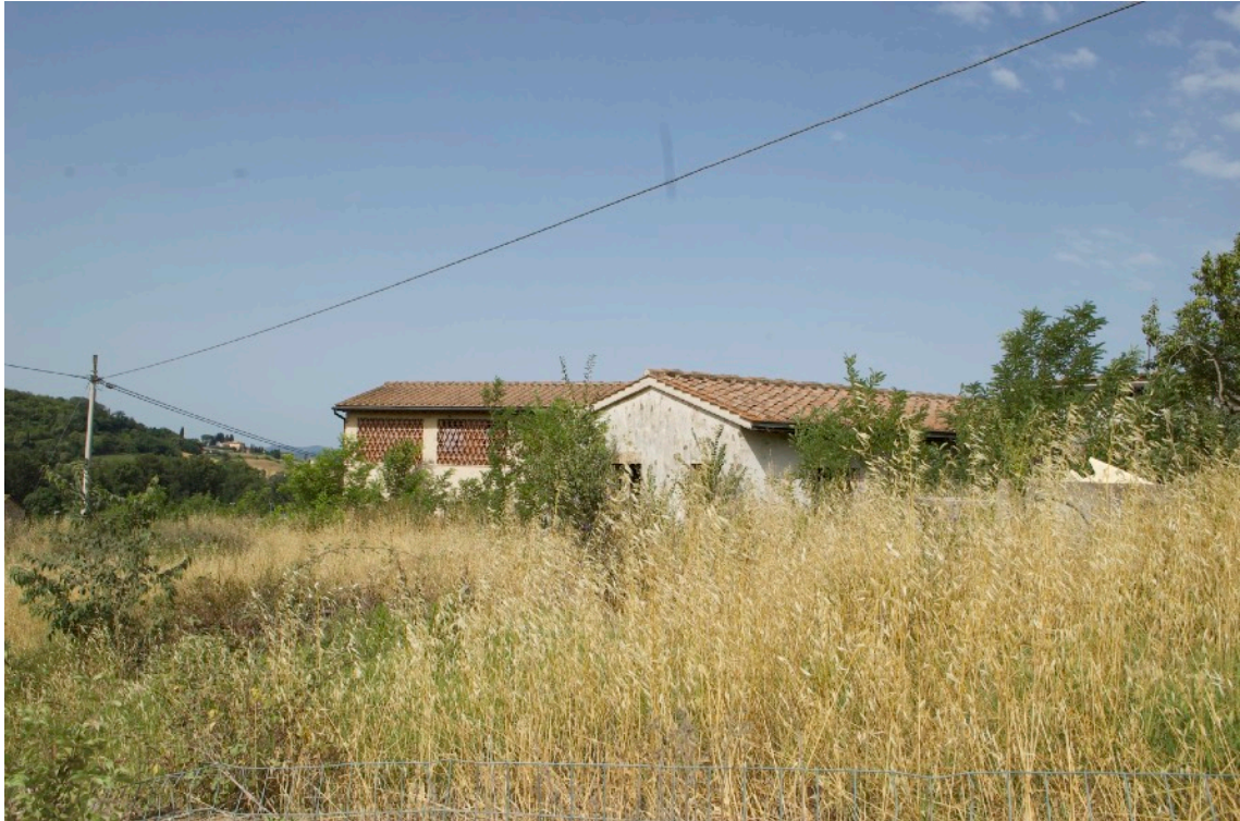
1) Vista da Via Monsanto angolo con Strada Comunale del Cimitero di San Giorgio