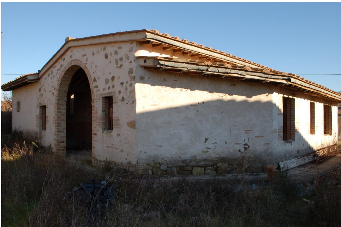
2) Ingresso fabbricato A (Ex Rimessa Agricola)