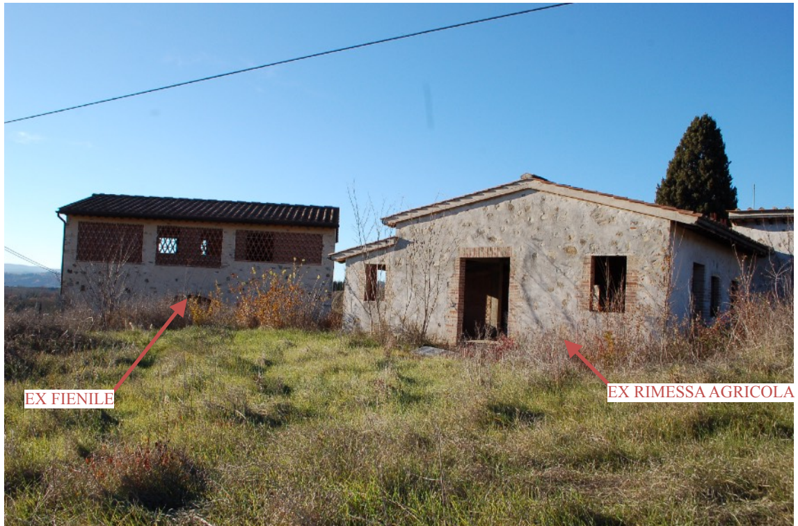
10) Vista dall'angolo di Via Monsanto e Strada Comunale del Cimitero di San Giorgio