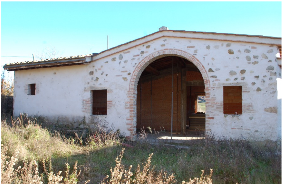
4) Fabbricato A (Ex Rimessa Agricola)