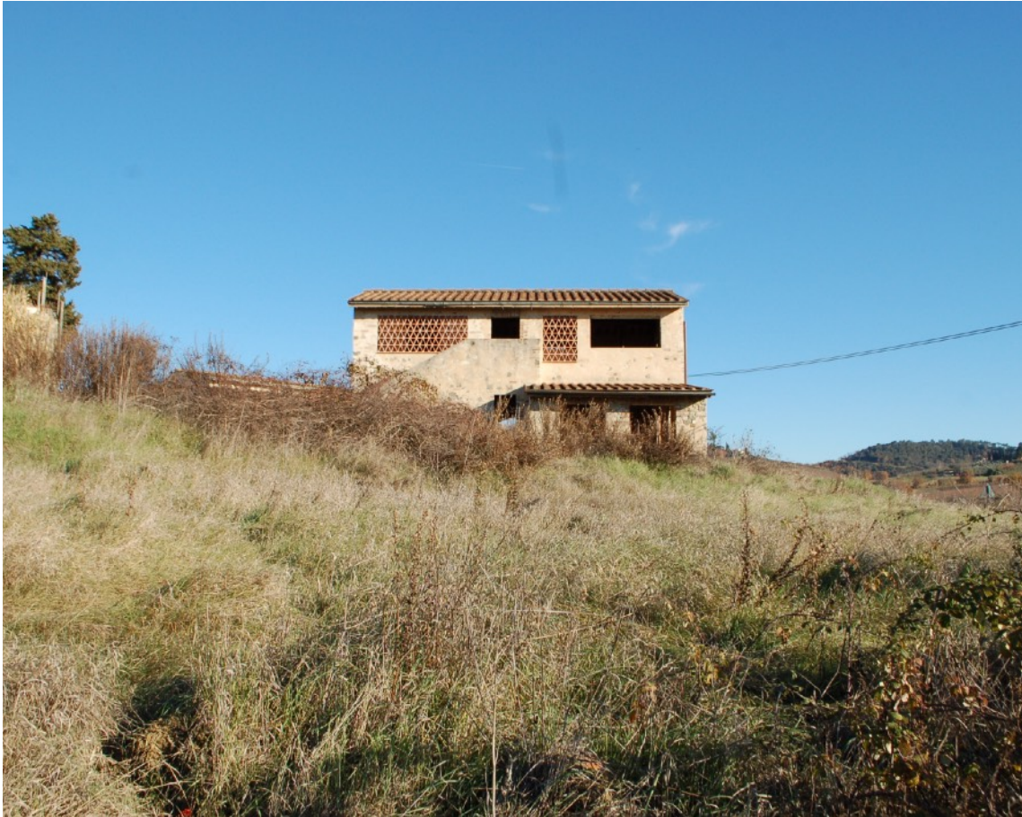
7) Fabbricato B (Ex Fienile) vista laterale