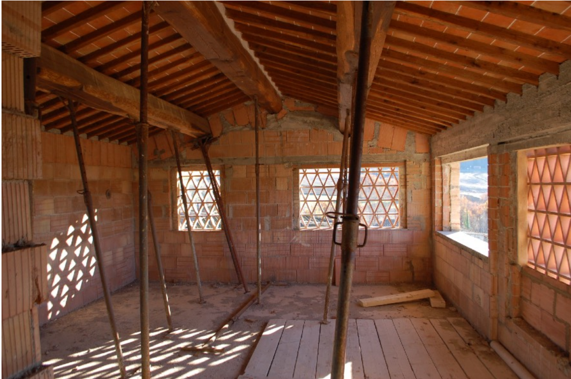
14) Fabbricato B (Ex Fienile) interni P1