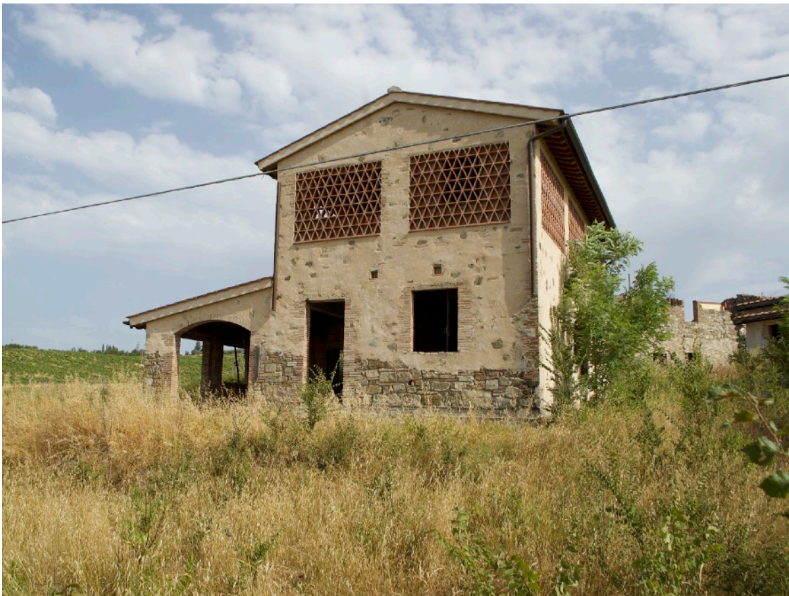
6) Fabbricato B (Ex Fienile) vista da Via Monsanto