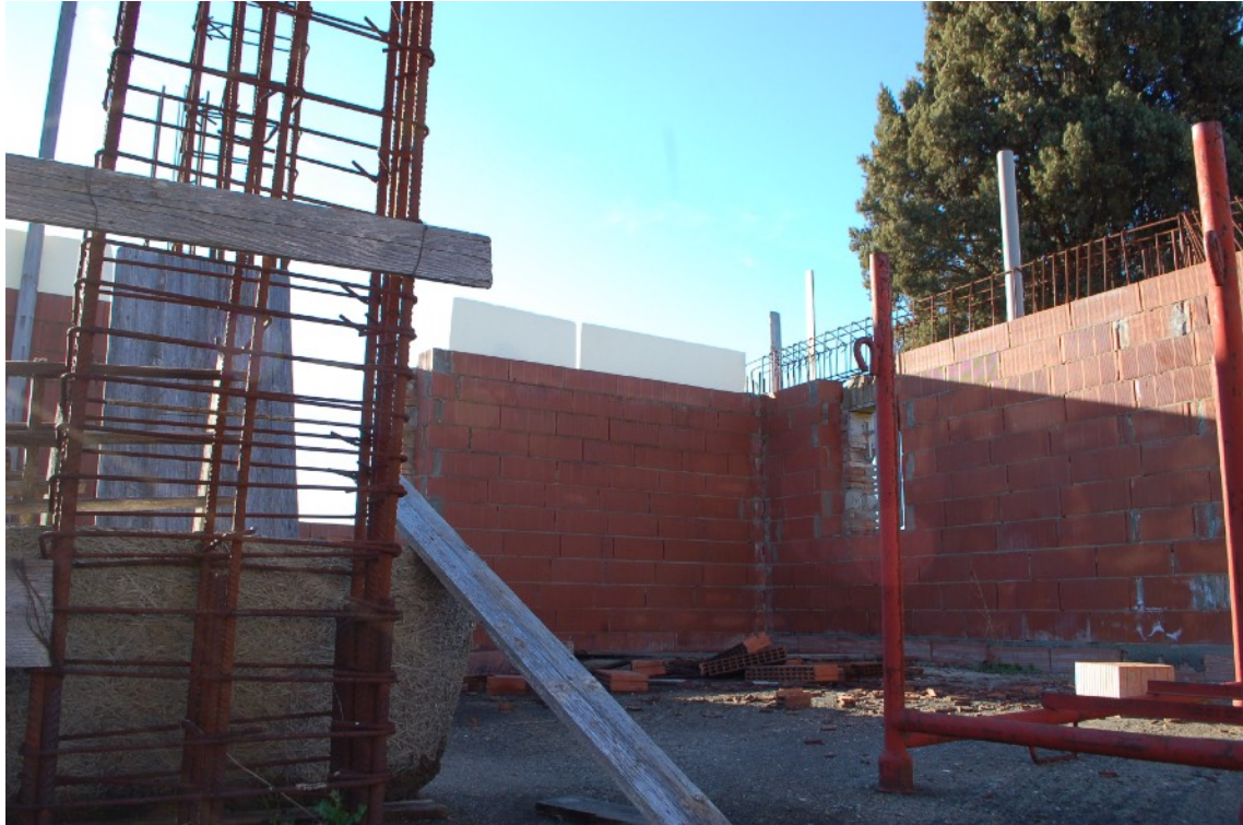
23) Fabbricato C (Ex Casa Colonica) interni P1