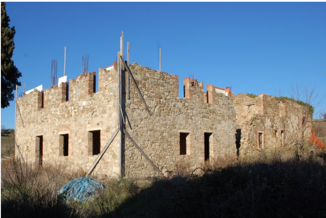
15) Fabbricato C (Ex Casa Colonica)