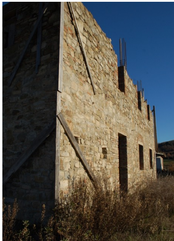
17-18) Fabbricato C (Ex Casa Colonica)