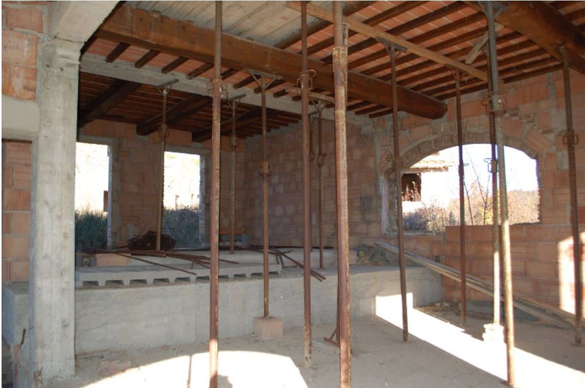
12) Fabbricato B (Ex Fienile) interni PT