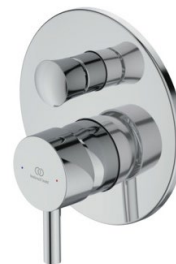
MISCELATORE AD INCASSO

Il lavabo sarà del tipo sospeso con semicolonna o, in alternativa, sarà fornito lavabo da appoggio serie extra, con relativa rubinetteria (in questo caso il successivo montaggio è escluso dal capitolato).