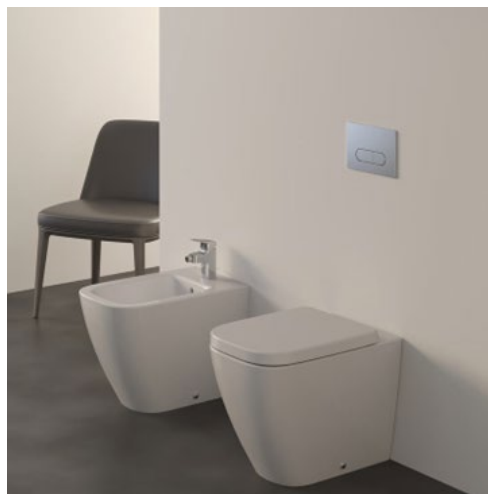
VASO E BIDET FILOPARETE

Ideal Standard serie I-LIFE B bianchi mod. filoparete.