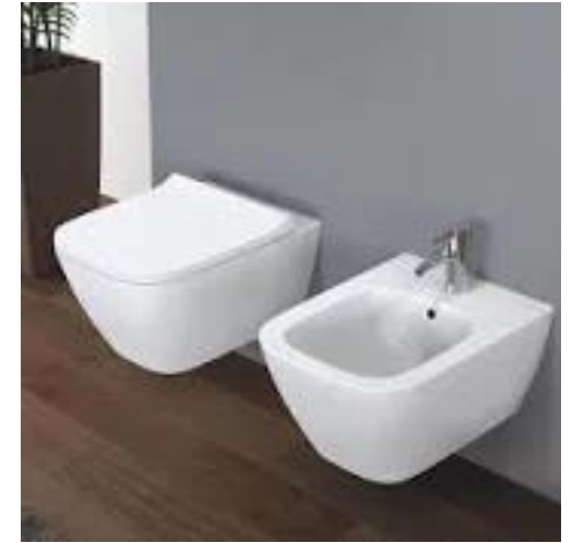
Geberit mod. Smyle