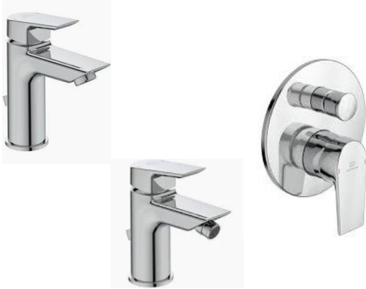
Ideal Standard mod. Ceramix