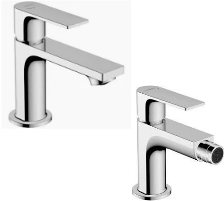
Hansgrohe mod. Rebris E