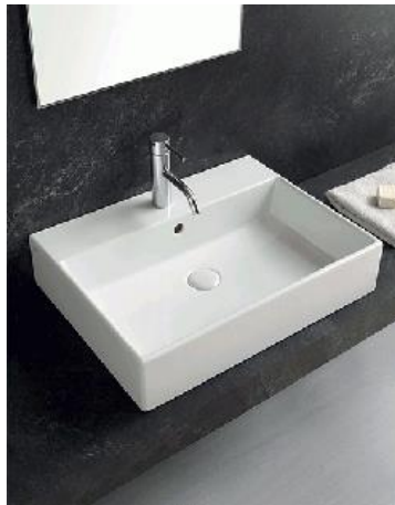
Ceramica Cielo mod. Smile