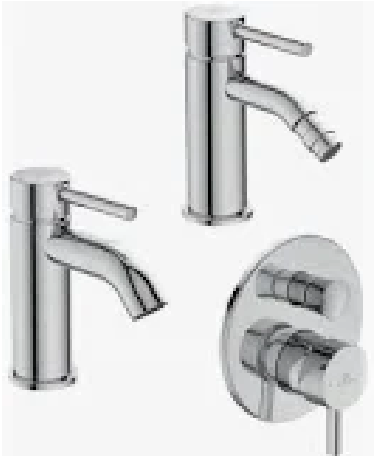
Ideal standard mod. Ceraline