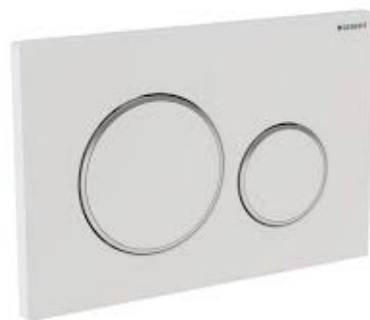
Geberit – sigma 20