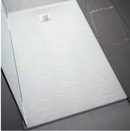
Ideal Standard Mod. UltraFlat S +