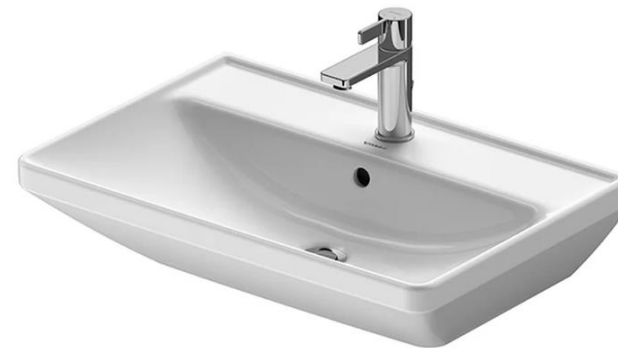
Duravit mod. D-neo