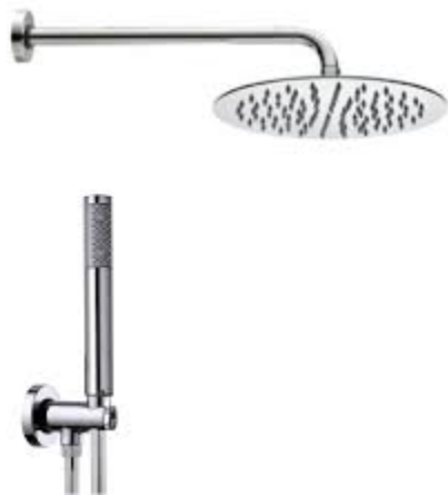
Bossini tetis - tondo