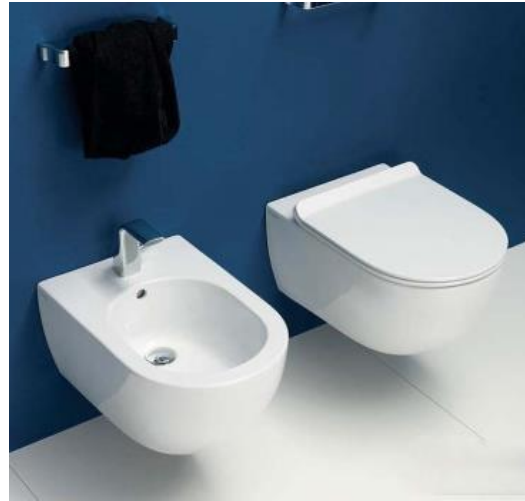
Flaminia mod. APP