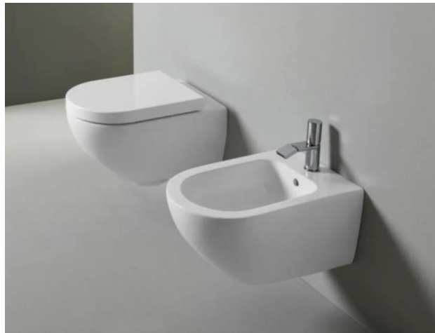
Ceramica Cielo mod. Enjoy