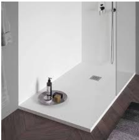
RCR mod. BASIC