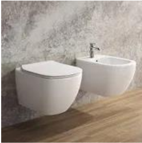
Ideal Standard mod. Tesi