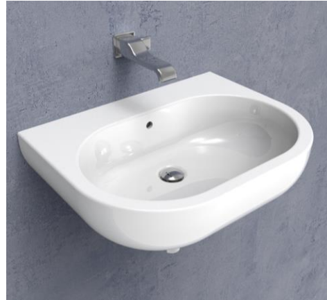
Flaminia mod. Pass