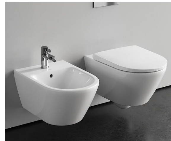
Duravit mod. D-neo