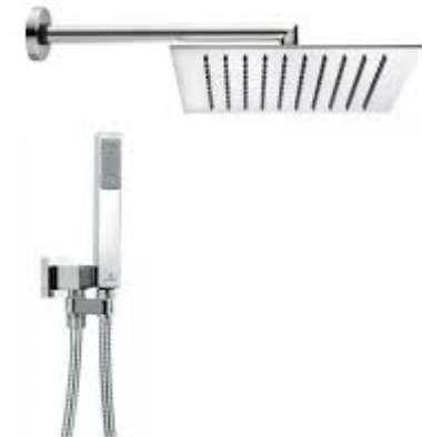
Bossini tetis - quadrato