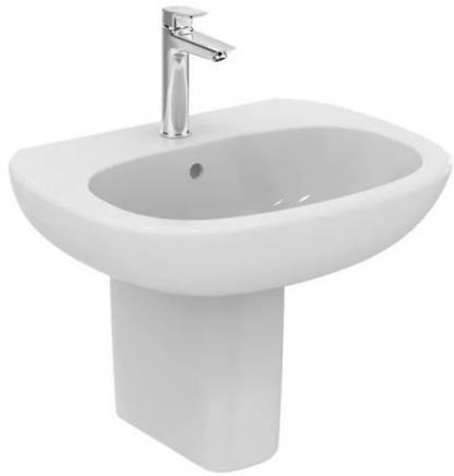
Ideal Standard mod. Tesi