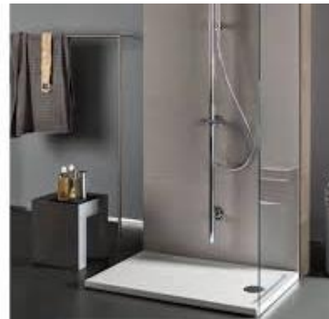
Geberit mod. geberit 45 (CERAMICA)