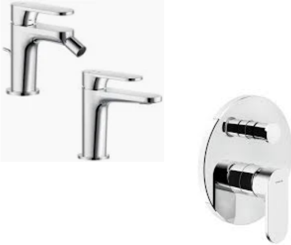
Nobili mod. Yoyo