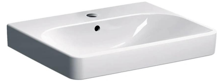
Geberit mod. Smyle