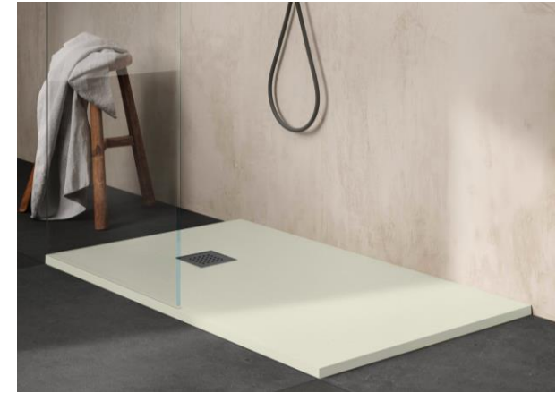
Hatria mod. Petra h3 levigato (CERAMICA)