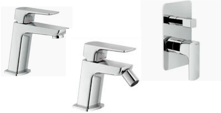
Nobili mod. Acquaviva