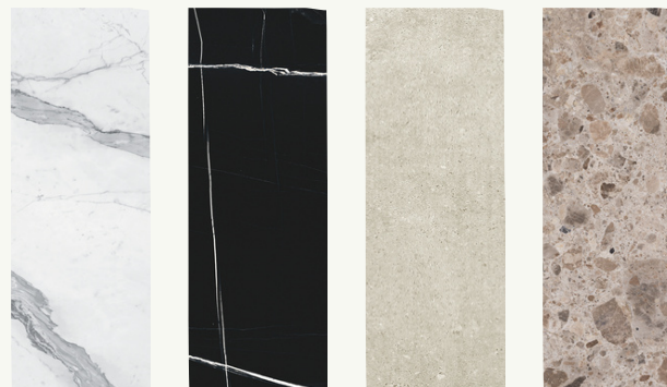
17. Colorazione piastrelle previste