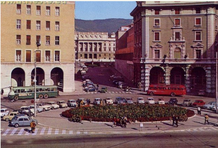
3. Piazza Oberdan

L'INTERVENTO PROPOSTO PREVEDE LA RIQUALIFICAZIONE DI UN EDIFICIO SITO IN VIA CORONEO, AL CIVICO 6 A TRIESTE, CHE RAPPRESENTA UN'ECCELLENZA ARCHITETTONICA E UN INVESTIMENTO DI PRESTIGIO. L'IMMOBILE SI DISTINGUE PER LA CLASSICITÀ E L'ELEGANZA DELLO STILE MODERNISTA "ART DECÒ", CHE CARATTERIZZA UN FORTE RICHIAMO AL LUSO E ALLA MODERNITÀ, COME ERA PREROGATIVA NEGL'ANNI '30. LE UNITÀ ABITATIVE AL SUO INTERNO OFFRONO SPAZI AMPI E LUMINOSI, GRAZIE ALLE GENEROSE APERTURE CHE PERMETTONO UN'ABBONDANTE ILLUMINAZIONE NATURALE. LA POSIZIONE CENTRALE DELL'EDIFICIO, IN PIÙ, ASSICURA UN FACILE ACCESSO AI PRINCIPALI SERVIZI, NEGOZI E LUOGHI DI INTERESSE DELLA CITTÀ, COME AD ESEMPIO IL VIALE XX SETTEMBRE DOVE SONO PRESENTI RISTORANTI E SERVIZI COMMERCIALI, CONFERENDO UN INESTIMABILE VALORE AGGIUNTO ALLA PROPRIETÀ. INOLTRE, LA SUA PROSSIMITÀ A IMPORTANTI ARTERIE STRADALI E MEZZI DI TRASPORTO PUBBLICO NE AUMENTA ULTERIORMENTE L'ATTRATTIVA PER CHI RICERCA UN'ELEVATO STANDARD DI VITA IN UNO DEI QUARTIERI PIÙ AMBITI DI TRIESTE.