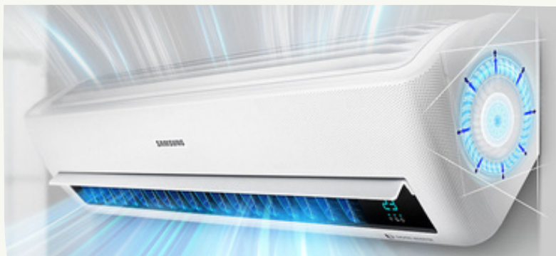
6. Sistema Samsung EHS