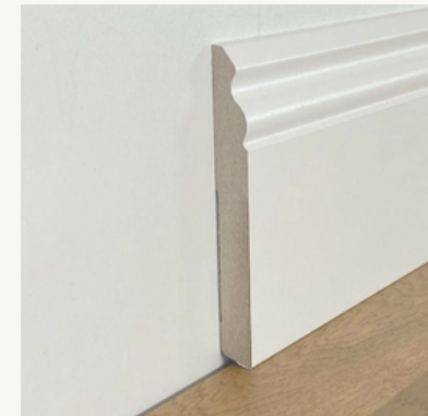
19. Battiscopa Ducale