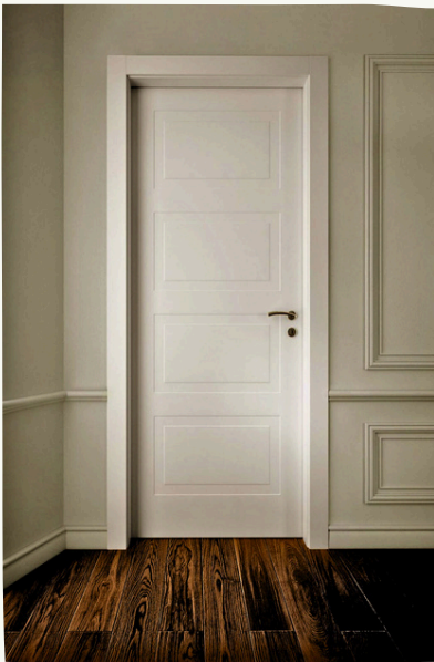
13. Porta garofoli - serie Miraquadra