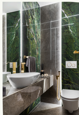
15. Rivestimento bagno

LE PIASTRELLE PREVISTE SONO IN GRES PORCELLANATO DELLA MIRAGE, SELEZIONATE DAL CATALOGO AGGIORNATO DELL'AZIENDA. IN PARTICOLARE, VERRANNO UTILIZZATE LE PIASTRELLE ESATTAMENTE COME MOSTRATE NEL CAMPIONARIO ALLEGATO, DI FORMATO 60X120 O 120X120.