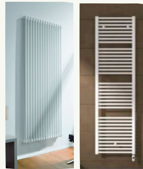
5. Radiatori e termoarredo

IL SISTEMA DI EMISSIONE DELL'IMPIANTO DI RISCALDAMENTO SARÀ COSTITUITO DA RADIATORI TUBOLARI IN ACCIAIO TIPO ZEHNDER, O SIMILARI. PERTANTO VISTO L'ATTENTO STUDIO DEGLI IMPIANTI, I CONSUMI SARANNO CONTENUTI CON IL MASSIMO RISPETTO PER L'AMBIENTE. L'ENTE SARÀ DOTATO DI CRONOTERMOSTATO PER LA REGOLAZIONE DELLA TEMPERATURA AMBIENTALE.