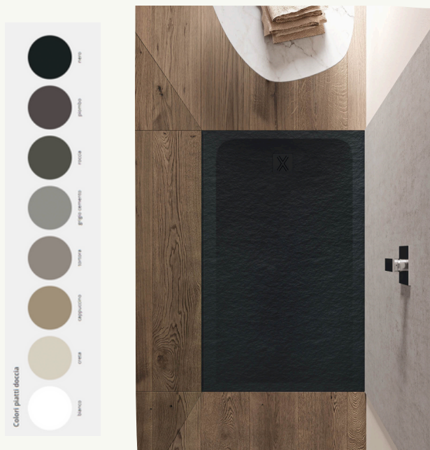
10. Piatto doccia stone filopavimento