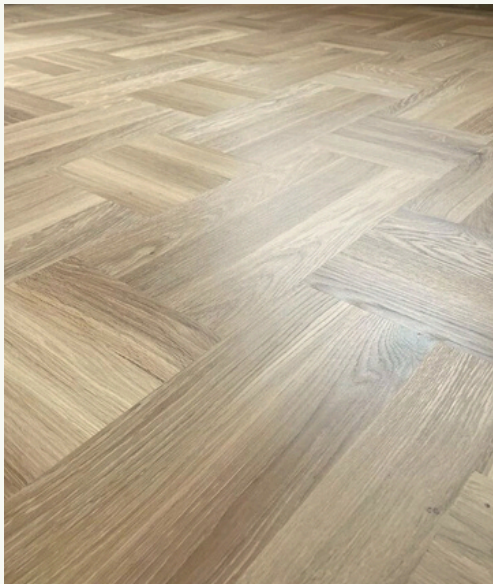
18. Pavimentazione in legno

IL PAVIMENTO IN LEGNO ORIGINALE SARÀ SOTTOPOSTO ALLA LEVIGATURA ED A UN TRATTAMENTO COMPLETO DI RIFINITURA MEDIANTE L'USO DELLA CERA, RIPRISTINANDO LA SUA LUCENTEZZA NATURALE E PROTEGGENDOLO DALL'USURA QUOTIDIANA.