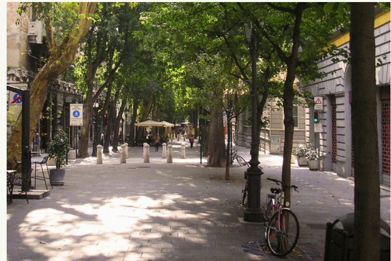
4. Viale XX Settembre