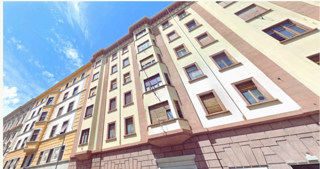
2. Foto facciata dell'edificio