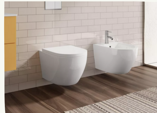
9. Sanitari sospesi