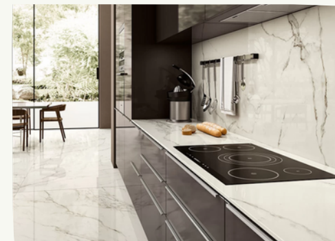
16. Rivestimento cucina