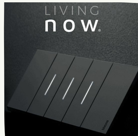
7. BTicino - Living Now

L'IMPIANTO ELETTRICO ALL'INTERNO DELL'APPARTAMENTO E DEI SERVIZI COMUNI SARÀ ESEGUITO CON TUBAZIONI IN PVC FLESSIBILE INCASSATE A SOFFITTO E/O A PARETE E FARANNO CAPO A CASSETTE DI DERIVAZIONE INCASSATE, POSTE IN POSIZIONI ACCESSIBILI. I CONDUTTORI ALL'INTERNO DELLE TUBAZIONI FLESSIBILI SARANNO IN RAME ISOLATO DEL TIPO FS17 DI SEZIONE ADEGUATA AI CIRCUITI PRESENTI IN OTTEMPERANZA ALLA NORMA CEI 64-8, DI LIVELLO 1°. LA SERIE PROPOSTA È LIVING-NOW DELLA BTICINO IN TECNOPOLIMERO.