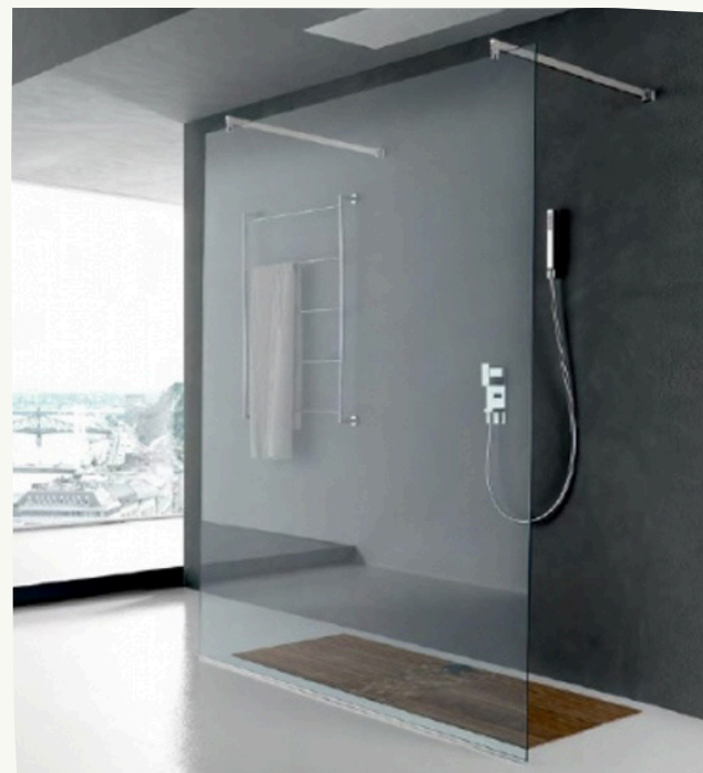
12. Vetro doccia Mirage