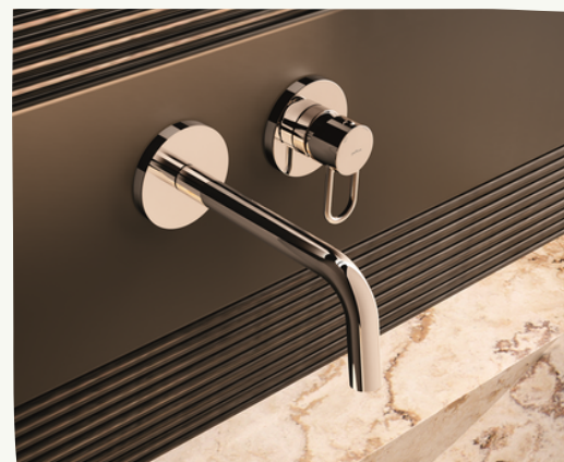
11. Rubinetti Paffoni - serie Joker