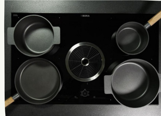
8. Piastre ad induzione

LA CUCINA SARÀ REALIZZATA CON PIASTRE AD INDUZIONE, IN QUESTO LOCALE È PREVISTA LA PREDISPOSIZIONE DI UN PUNTO ACQUA E SCARICO PER IL LAVELLO.