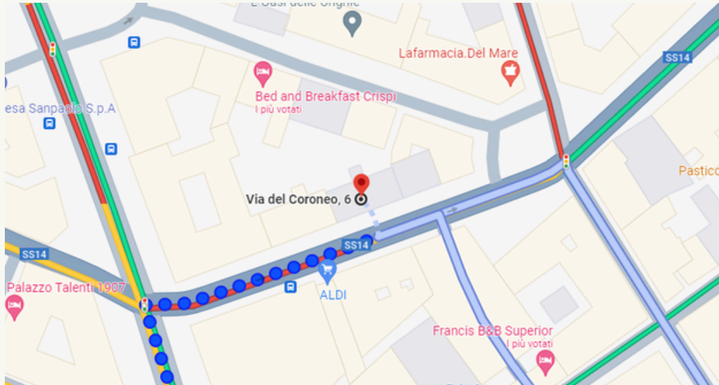
1. Ubicazione dell'edificio