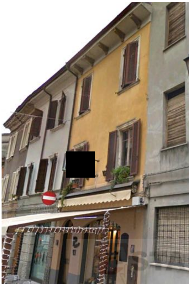
Esterno – via XX Settembre