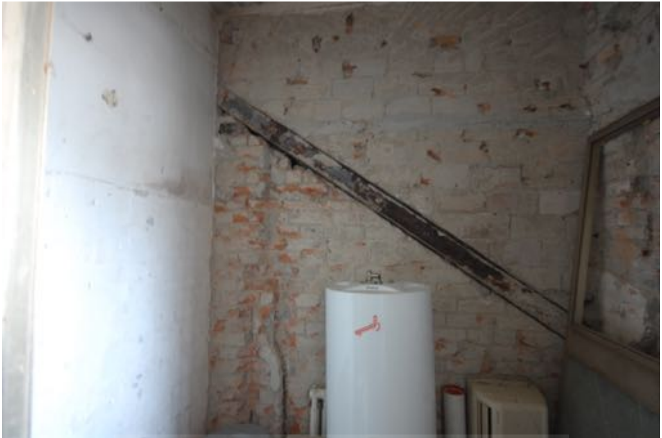
Sale interne Sub. 10