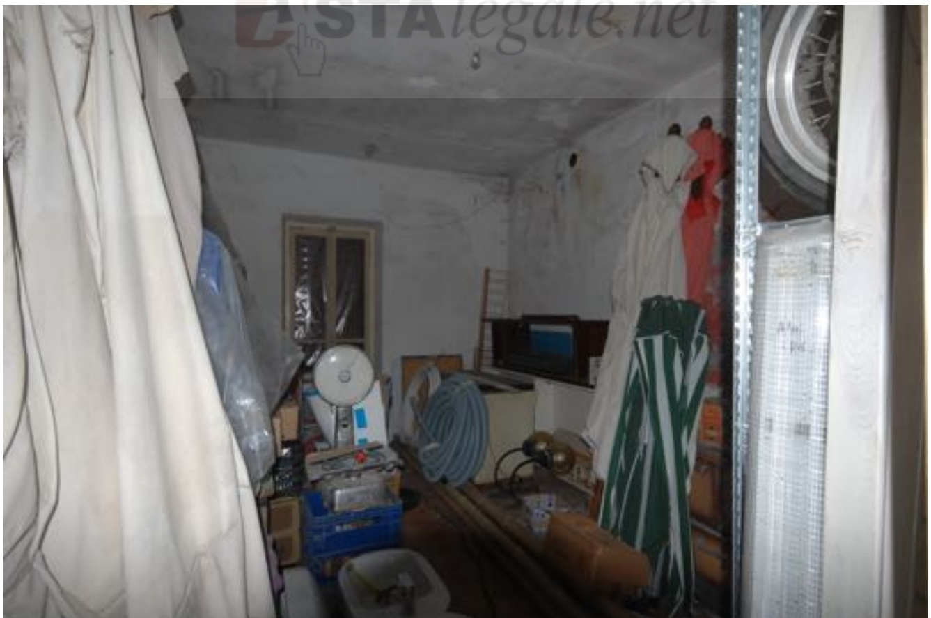
Sale interne Sub. 10