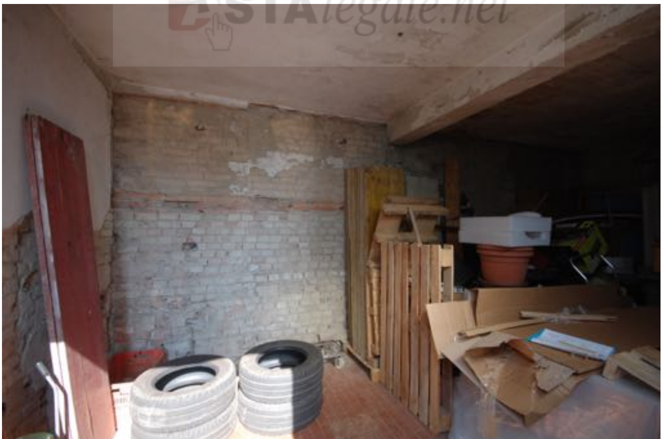
Sale interne Sub. 10