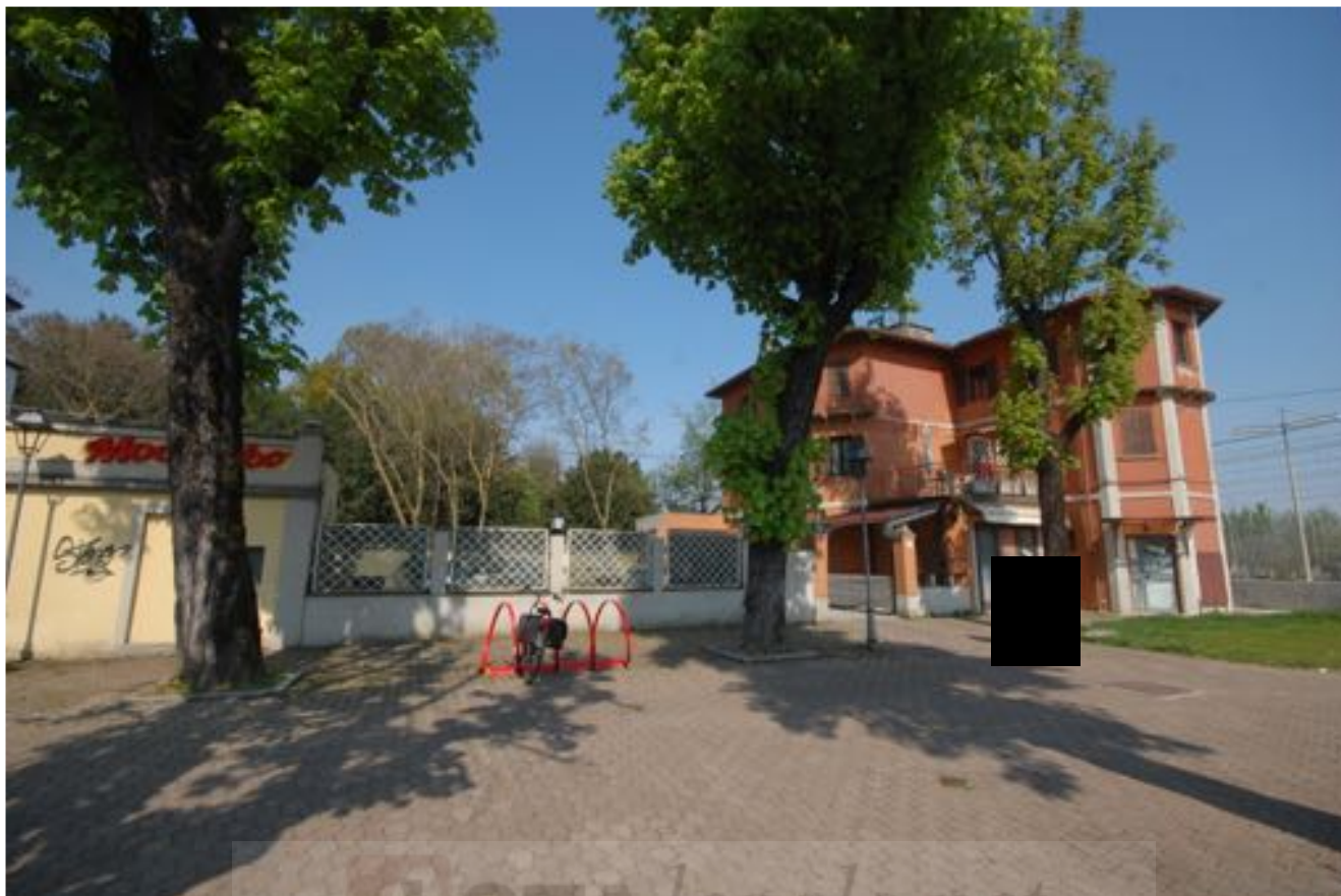
Vista esterna del fabbricato