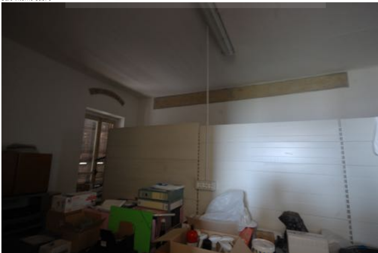
Sale interne sub. 9