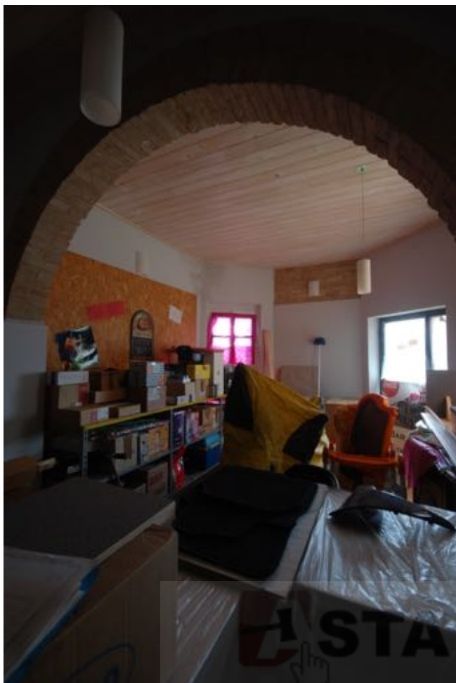
Sale interne sub. 9