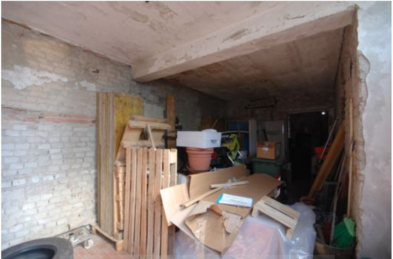
Sale interne Sub. 10