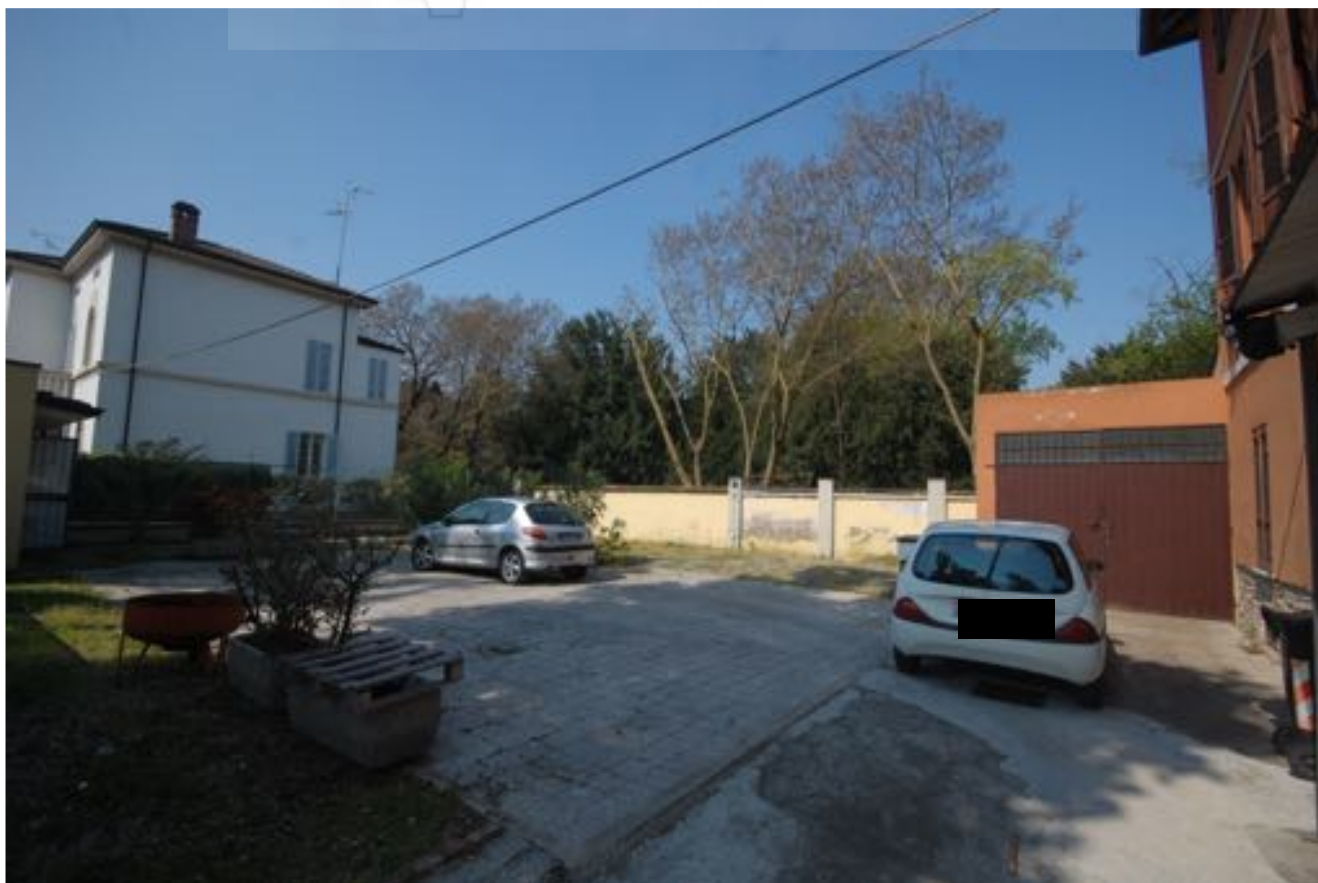
area di pertinenza esterna