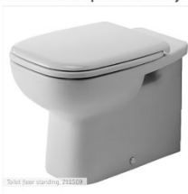
D-Code Toilet floor standing