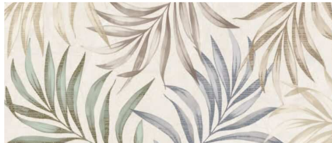
ALWAYS DECO MIX 25 X 60