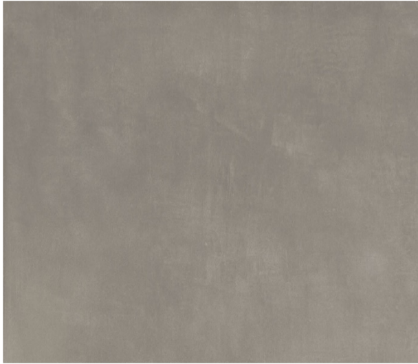
LIGHT CEMENT 60 X 60 GRAFITE