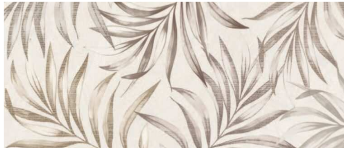
ALWAYS DECO MIX 25 X 60