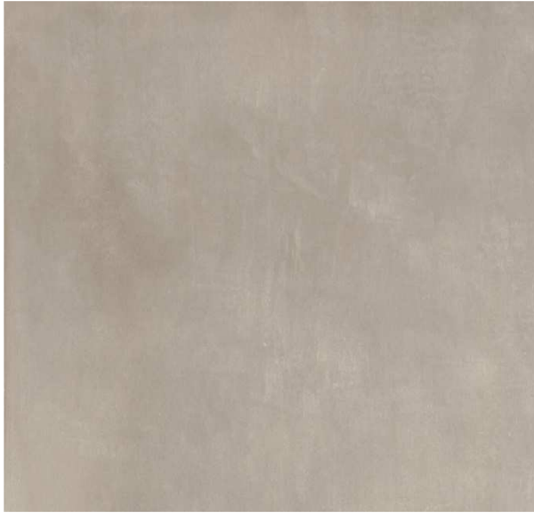
LIGHT CEMENT 60 X 60 SABBIA