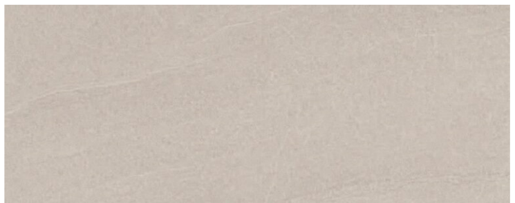
ALWAYS GRIGIO 25 X 60