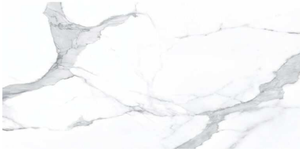
SAHARA NOIR MAIL 60 X 120 (SOLO PER I RIVESTIMENTI BAGNI)