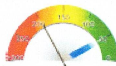
RISCALDAMENTO E PROD. ACS 197,78kWh/m 2 /anno