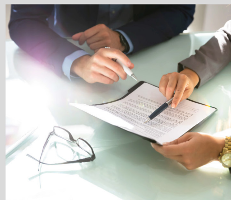
Polizza fideiussoria e postuma decennale