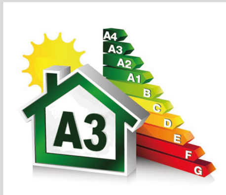
Classe energetica A3