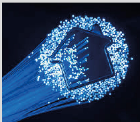
Edificio in banda ultralarga