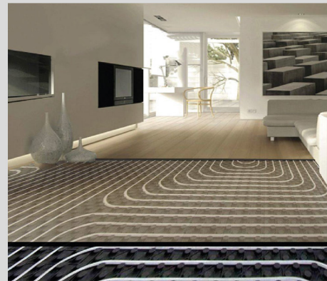
Riscaldamento a pavimento