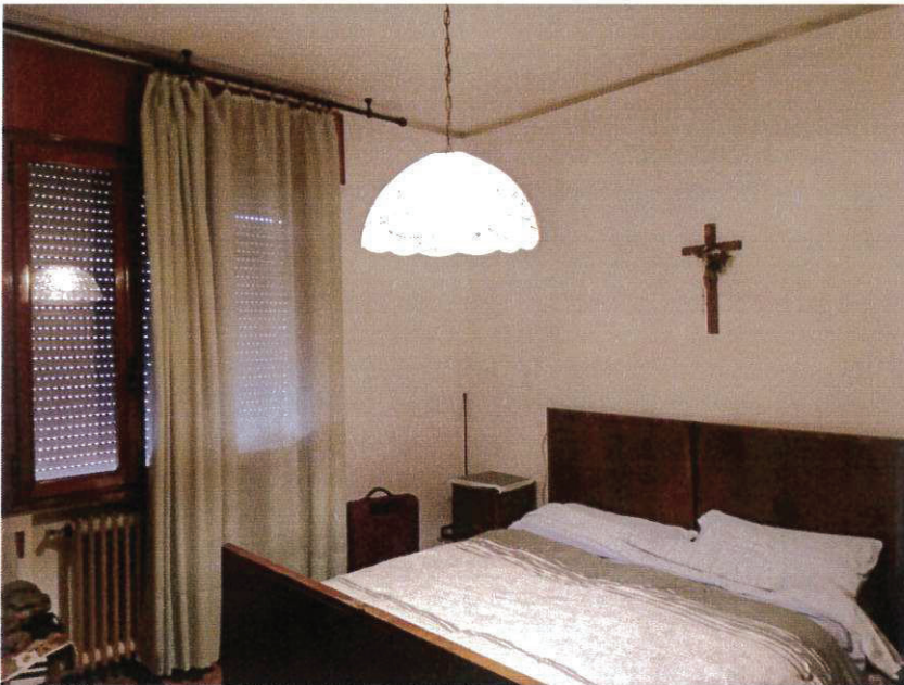
SUB 2 - CAMERA N-W