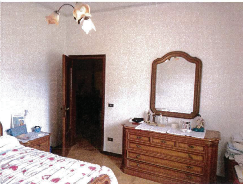
SUB 2 - CAMERA N-E