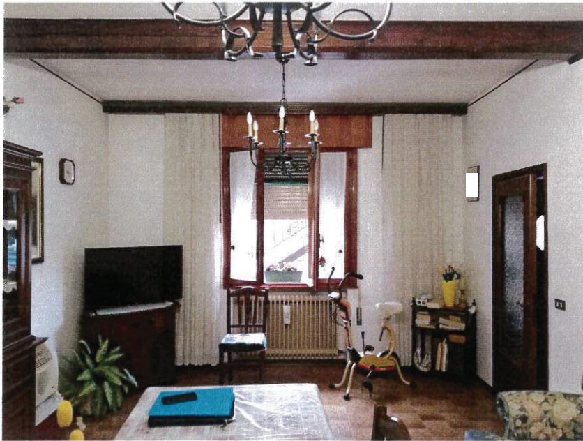
SUB 2 - SOGGIORNO