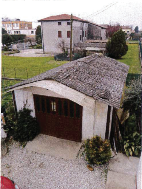
SUB 5 - GARAGE