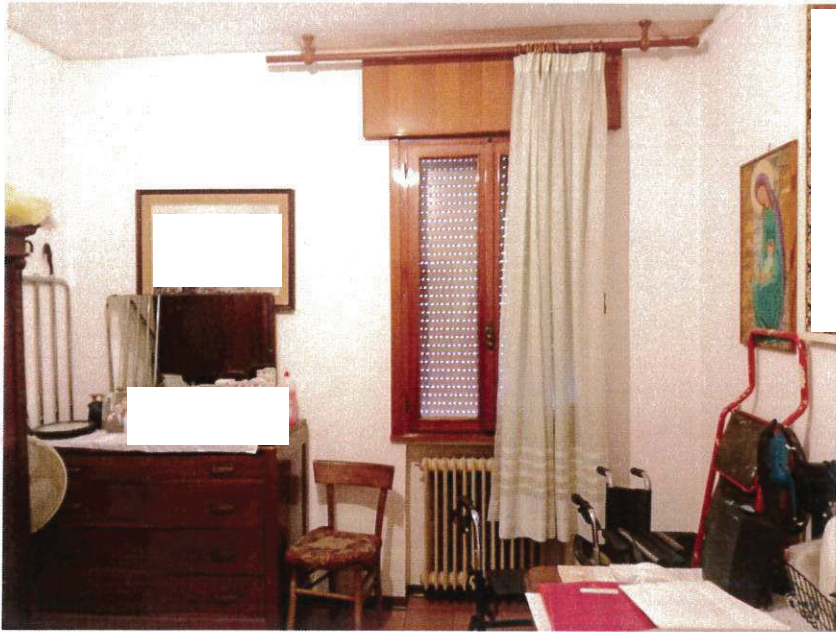
SUB 2 CAMERA W