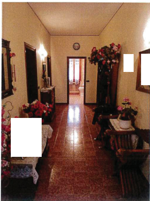
SUB 2 – CORRIDOIO CENTRALE