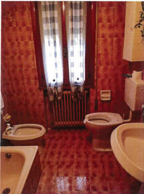
SUB 2 - BAGNO