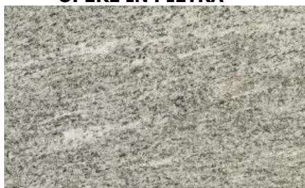
Es. Beola grigia Iragna o di Lodrino

Le soglie delle porte finestre su logge, terrazzi e balconi e di delimitazione delle logge, i davanzali delle finestre, le copertine dei parapetti delle logge e dei terrazzi, le soglie dei portici e delle logge saranno realizzate in beola grigia a grana medio-fine Iragna o di Lodrino, levigata nelle parti a vista.