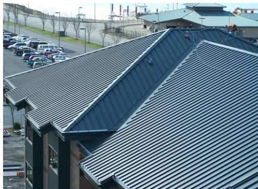
Es. copertura in lamiera grecata

Le coperture inclinate a vista saranno realizzate in legno, con travi e travetti in legno lamellare, adeguatamente dimensionati, compreso soprastante assito maschiato, con finitura sbiancata. Le gronde saranno rivestite con cappotto isolante, rasate con intonaco civile per esterni e tinteggiate.