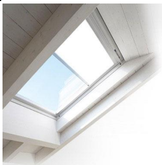
Es. finestra da tetto

Ove previsto dal progetto saranno montate finestre per tetti con apertura elettrica telecomandata a bilico in legno finitura bianca, con rivestimento esterno in alluminio plastificato grigio scuro, con vetrata isolante antigrandine, complete di persiana avvolgibile esterna elettrica telecomandata e con sensore pioggia automatico, fornite complete di telecomando (uno per finestra).