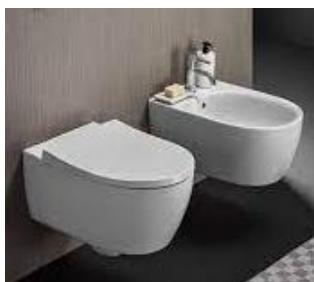
Es. sanitari sospesi Geberit Icon

La distribuzione dell'acqua calda avrà come punto di partenza il bollitore ad accumulo per la produzione di acqua calda di ogni singolo alloggio, con rubinetti d'arresto sulle diramazioni in multistrato od in polipropilene ad alta densità accuratamente protette ed isolate per l'alimentazione del lavello posto in cucina e degli apparecchi sanitari nei bagni.