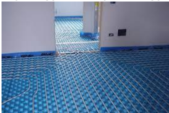
Es. Riscaldamento/raffrescameto a pavimento

Ogni singolo alloggio sarà riscaldato/raffrescato autonomamente da un sistema ibrido integrato ad incasso esterno di primaria marca costituito da caldaia a condensazione e pompa di calore aria/acqua (in unità esterna). Tale sistema sarà inoltre integrato da bollitore ad accumulo con scambiatore a serpentino per la produzione e l'accumulo dell'acqua calda sanitaria.