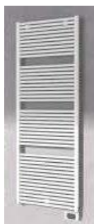
Es. Scaldasalviette elettrico

L'impianto di riscaldamento e di raffreddamento realizzato in ogni appartamento sarà del tipo a bassa temperatura con pannelli radianti a pavimento.