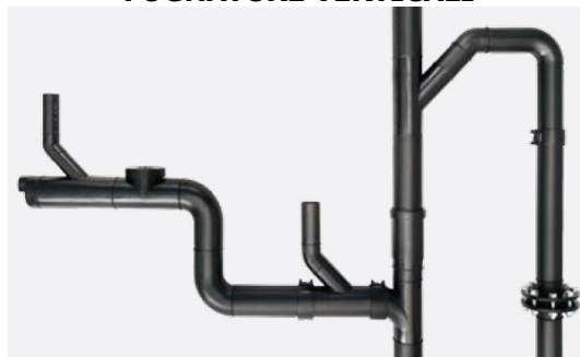
Es. sistema di scarico insonorizzato

Le colonne di scarico ed i tubi di ventilazione primaria delle colonne stesse, incassati nelle pareti, saranno eseguiti con sistema altamente insonorizzato.