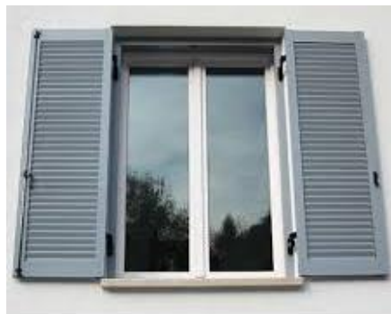
Es. persiane in alluminio

Ove previsto dal progetto saranno montate finestre per tetti con apertura elettrica telecomandata a bilico in legno finitura bianca, con rivestimento esterno in alluminio plastificato grigio scuro, con vetrata isolante antigrandine, complete di persiana avvolgibile esterna elettrica telecomandata e con sensore pioggia automatico, fornite complete di telecomando (uno per finestra).