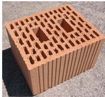
Es. Poroton da 25 cm.

Le murature perimetrali contro terra dei piani interrati e le muratura in elevazione dei vani scala saranno realizzate in cemento armato.