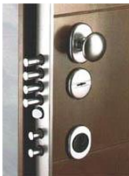
Es. Serratura portoncino blindato

I portoncini d'ingresso degli appartamenti saranno di tipo blindato, dimensioni standard 90x210 cm., con finitura interna con pannello di rivestimento cieco, liscio e di colore coordinato con le porte interne e con finitura esterna con pannello di rivestimento cieco laccato opaco in tinta verde scuro RAL 6009, maniglia esterna ed interna a pomolo in alluminio cromo-satinato, con grado di protezione antieffrazione Classe 3.