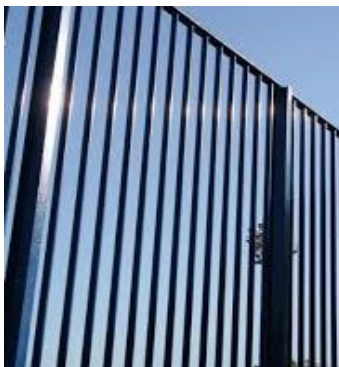
Es. recinzione Celeno della Nuova Defim