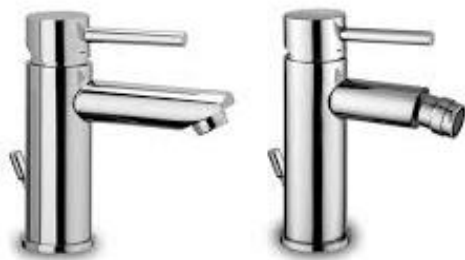
Es. rubinetteria Paffoni serie Stick

I gruppi rubinetterie monocomando saranno della Grohe serie Lineare New o serie Eurocube o della Paffoni, serie Stick.