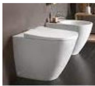
Es. sanitari a terra Geberit Icon

Nei bagni sono previsti apparecchi sanitari di colore bianco della Ideal Standard serie Blend Cube o serie Blend Curve o della Geberit serie Icon, sospesi o a pavimento, vasca ad incasso in acrilico di colore bianco europeo rettangolare da cm. 170x70 della Ideal Standard serie Connect, piatto doccia della Ideal Standard modello Strada di colore bianco europeo fino a cm. 100x80.