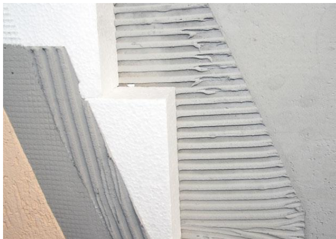
Es. Isolamento a cappotto in poliestere EPS

L'isolamento termo-acustico della soletta inclinata di copertura dell'ultimo piano abitabile od accessibile sarà realizzato con pannelli rigidi in lana di roccia calpestabili ad alta densità.