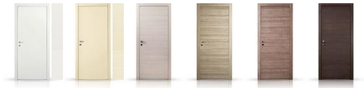
Es. Finiture porte interne

Per consentire il transito dell'aria previsto dal sistema di ventilazione meccanica controllata le porte interne saranno montate a 0,5 cm. dal filo del pavimento.