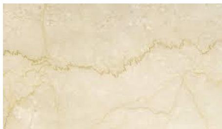
Es. Botticino classico

I pavimenti dei pianerottoli delle scale comuni e dei relativi atrii di ingresso, le soglie, le spallette ed i voltini dei portoncini blindati interni e delle porte dell'ascensore, le pedate, le alzate e gli zoccolini delle scale comuni saranno realizzati in Botticino classico, levigato e lucidato.