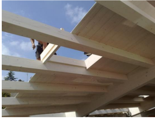
Es. Tetto in legno

Le coperture inclinate a vista saranno realizzate in legno, con travi e travetti in legno lamellare, adeguatamente dimensionati, compreso soprastante assito maschiato, con finitura sbiancata. Le gronde saranno rivestite con cappotto isolante, rasate con intonaco civile per esterni e tinteggiate.