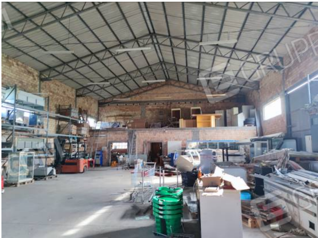
Vista del capannone 3, porzione dell'interno da nord verso la zona posta a sud