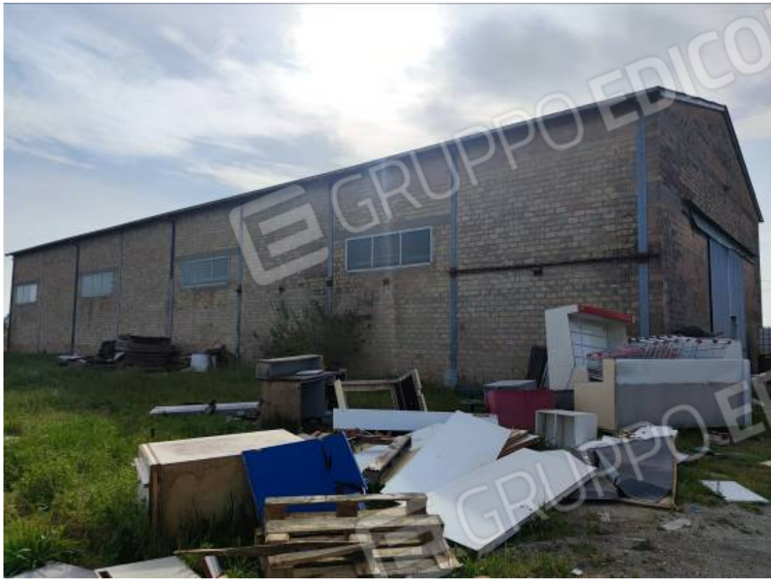
Vista del capannone 3, prospetto est