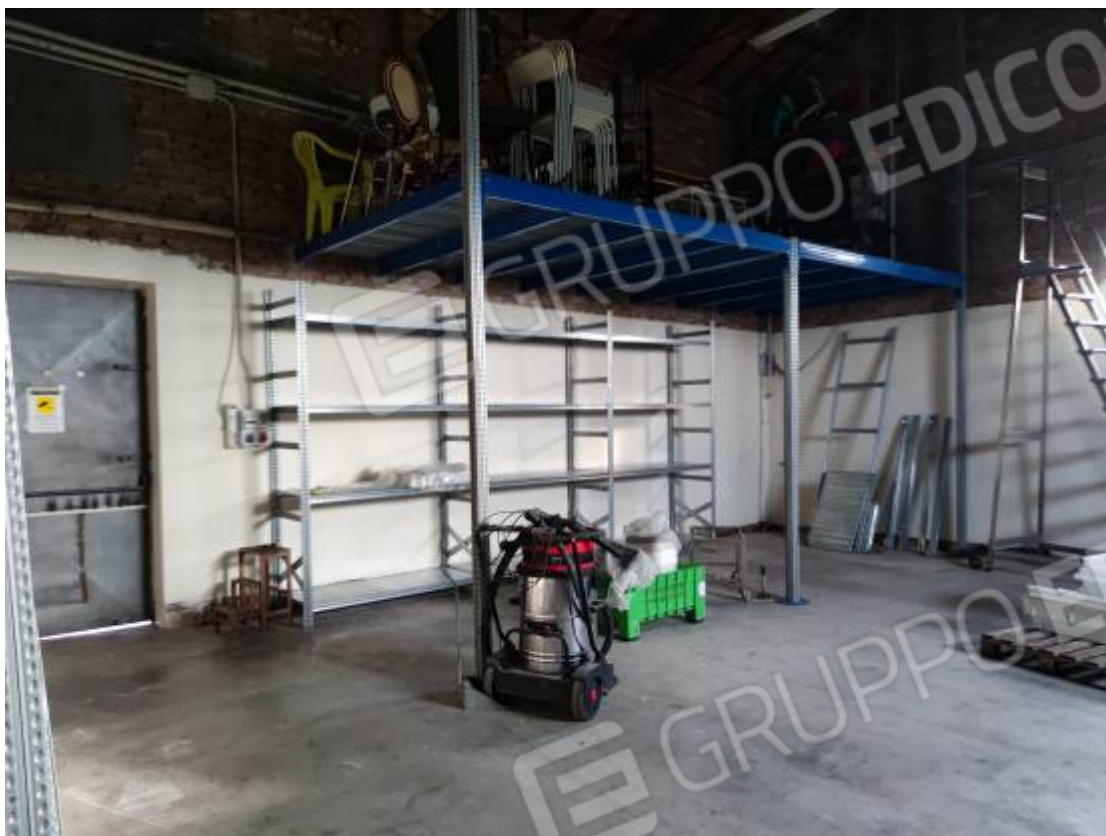
Vista del capannone 1, porzione della zona sud adibita a deposito e particolare del soppalco con struttura metallica