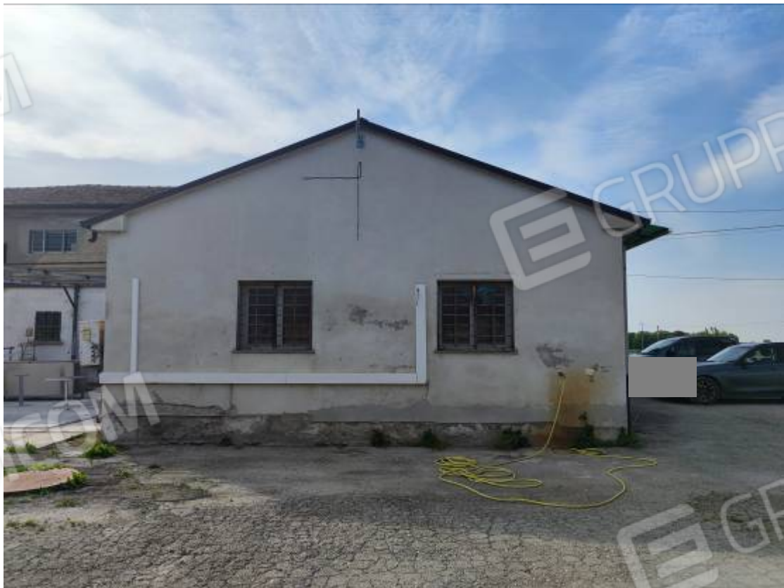
Vista del capannone 1, prospetto est della porzione più bassa dell'edificio