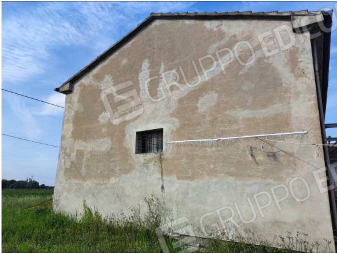
Vista del capannone 1 prospetto sud