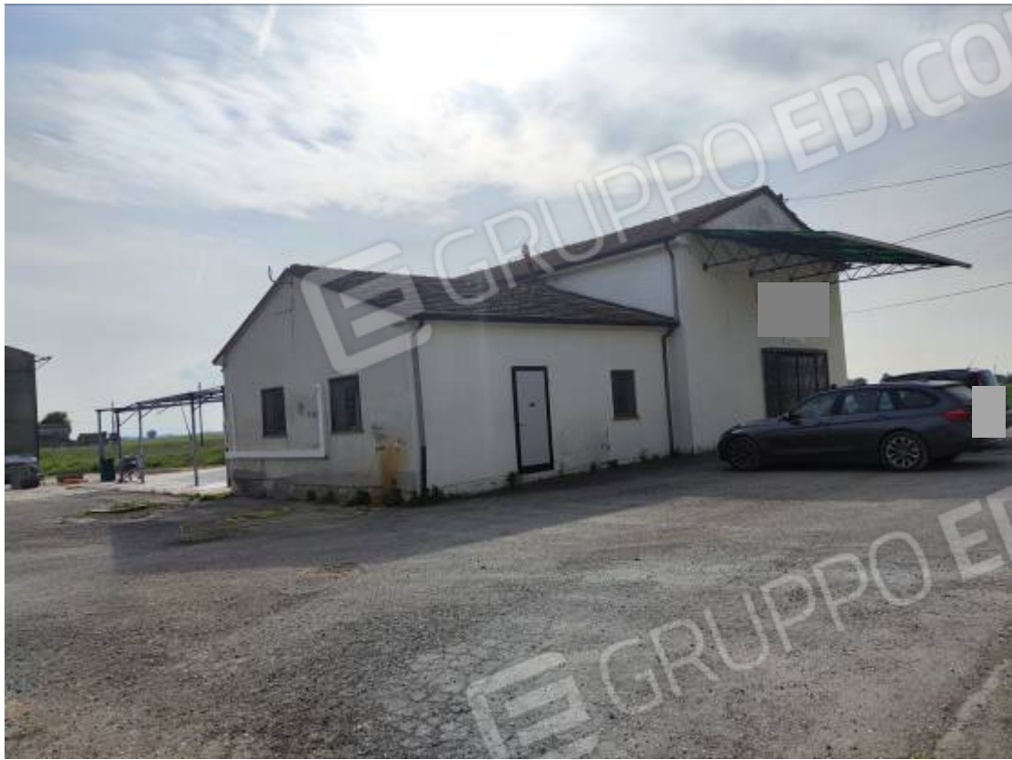
Vista del capannone 1, prospetto nord ed est