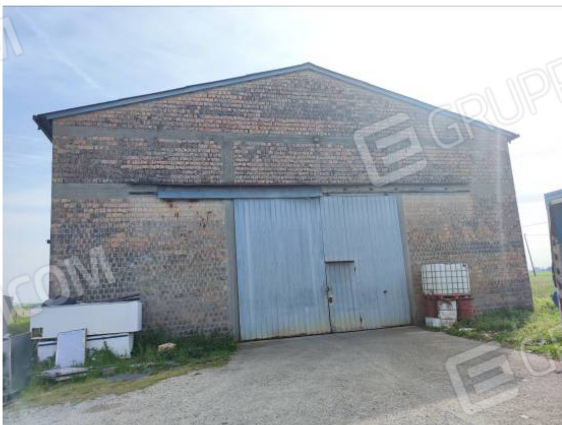
Vista del capannone 3, prospetto nord