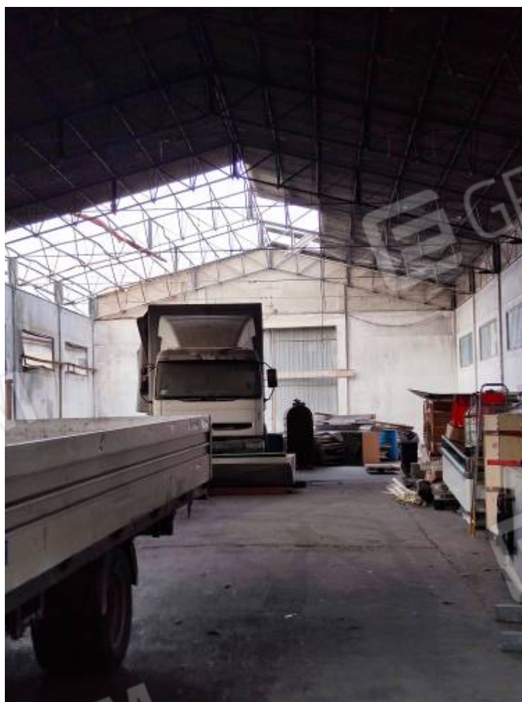
Vista del capannone 2, particolare dei danni causati dall'incendio del 2015