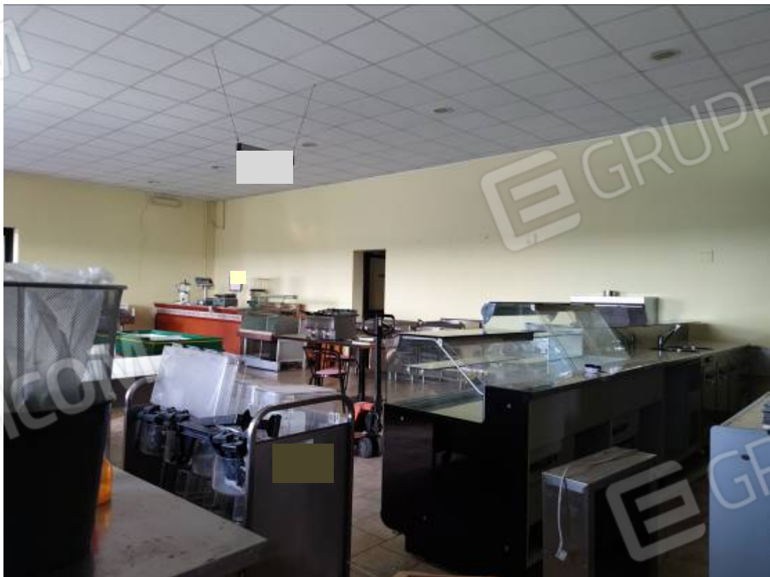
Vista del capannone 1, porzione della zona nord adibita a sala mostra