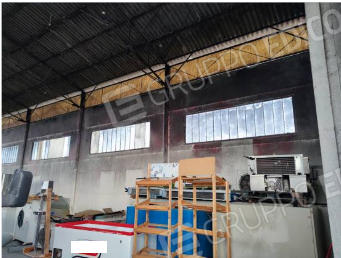
Vista del capannone 2, particolare dell' interno