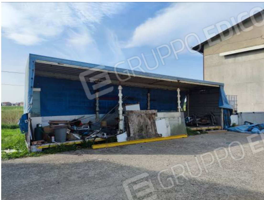
Vista dei depositi di materiali posti nell'area cortiliva