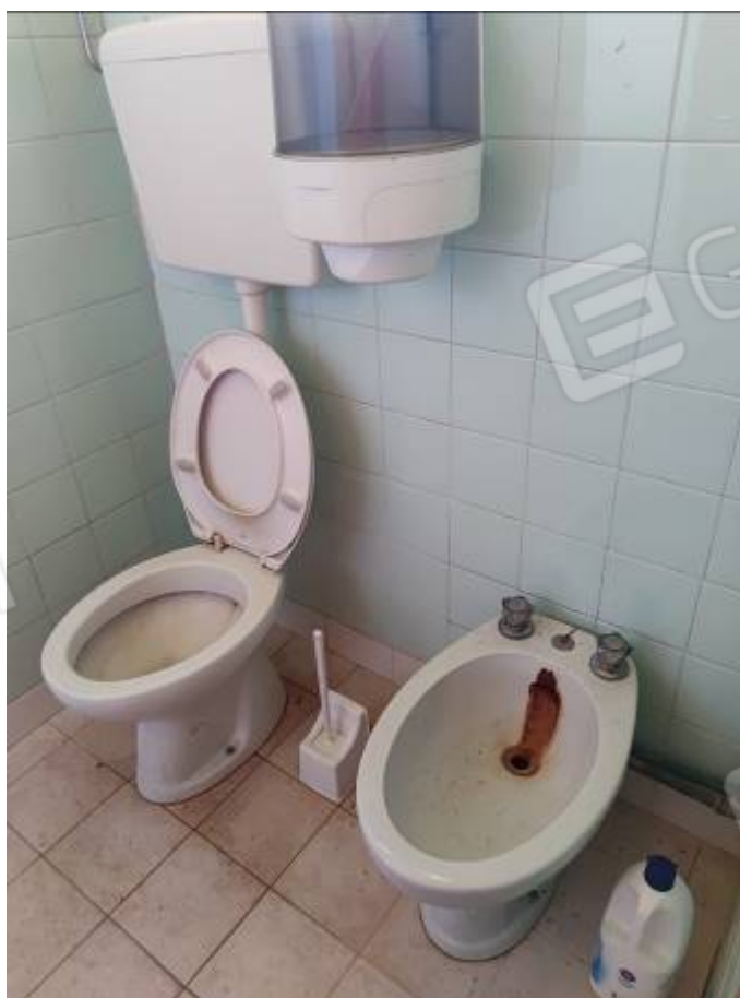
Vista del capannone 1, porzione del bagno