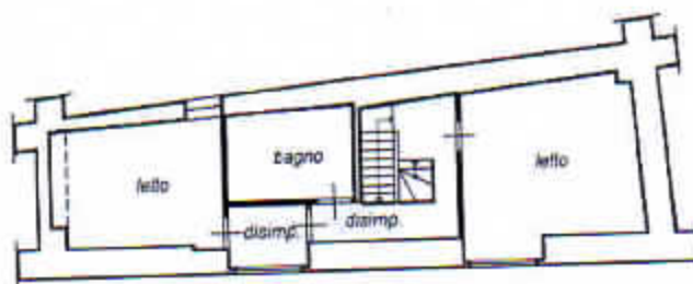
PIANO SECONDO h= 3,30 mt