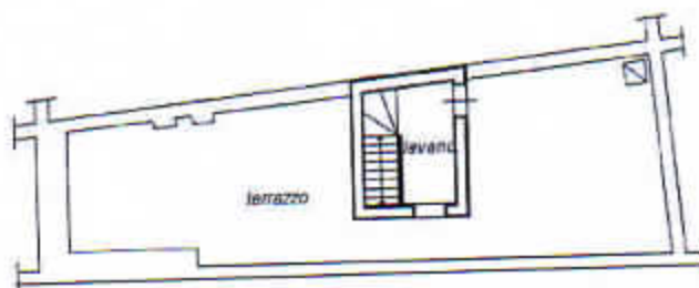
PIANO TERZO h= 2,70 mt