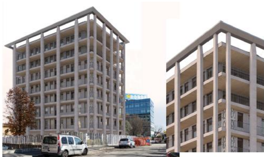
GREEN DOMUS MILANO

La qualità architettonica è sottolineata da scelte stilistiche estremamente moderne, eleganti ed essenziali, che vestono con gusto volumi armonici e proporzionati, generati dall'aggregazione di unità abitative concentrate in un solo complesso funzionale, ognuna dotata di terrazzo esclusivo.