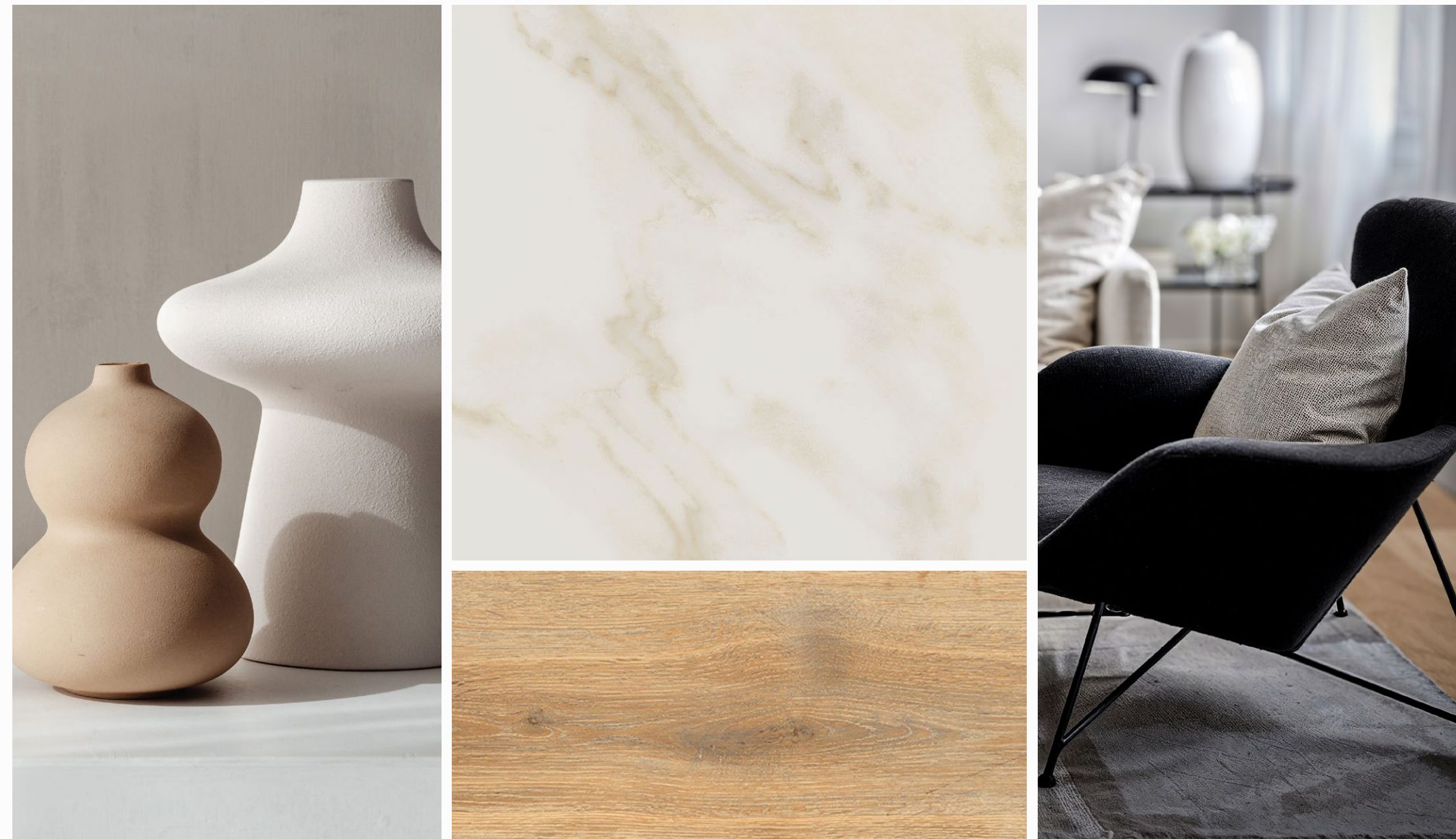
MOODBOARD SUITE PARADISE