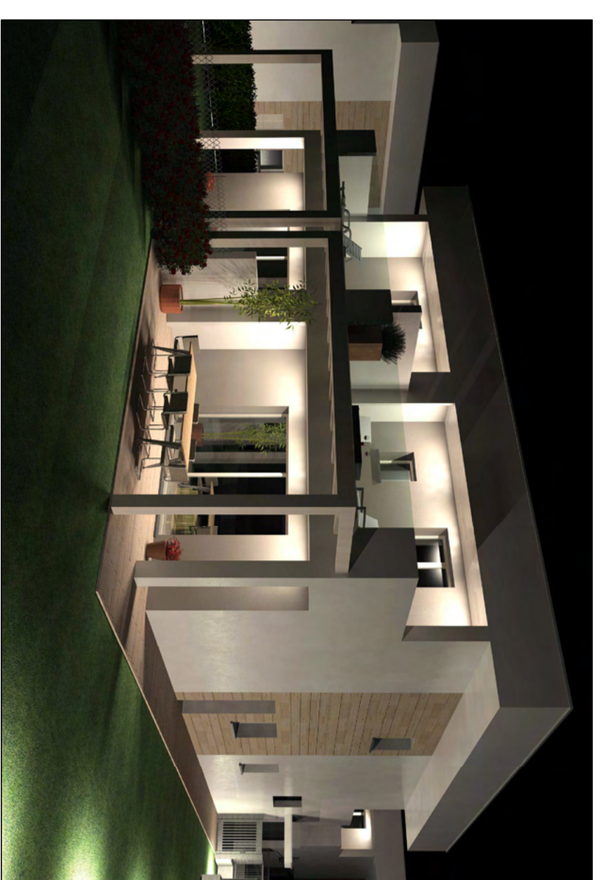
BIFAMILIARE 4 - Alloggi G-H