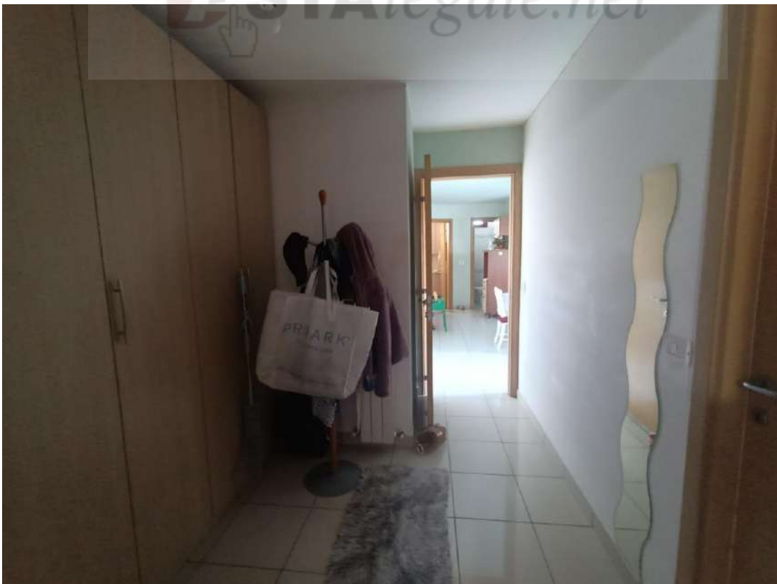
Vista interna del disimpegno