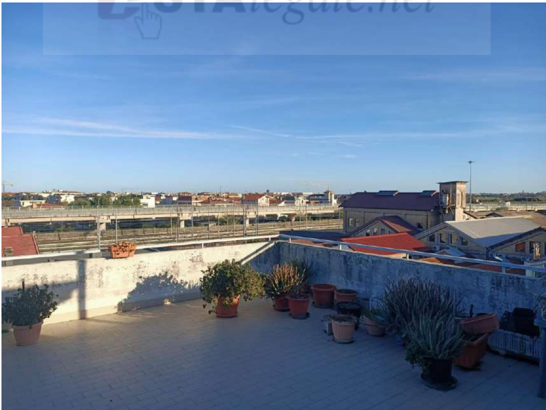
Vista della terrazza