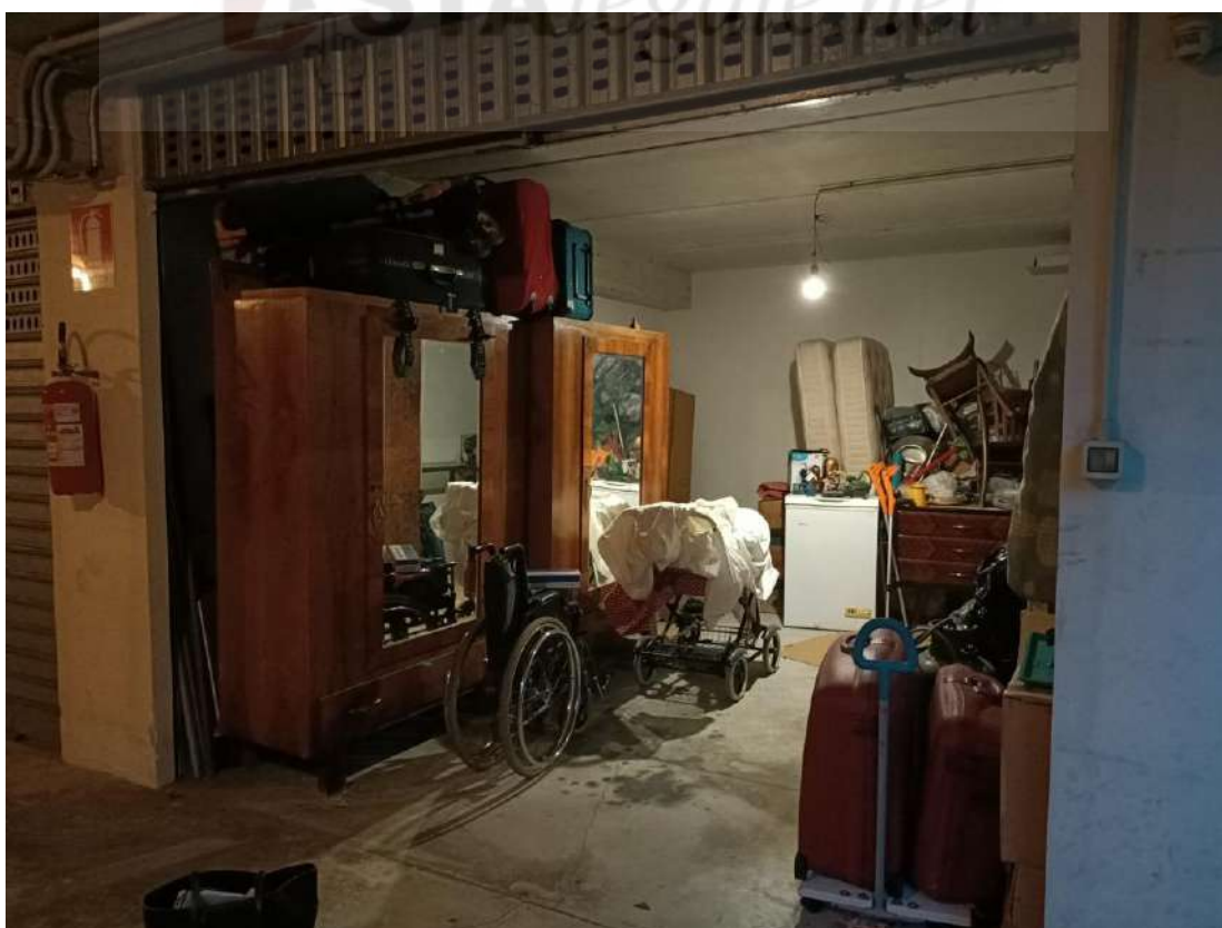
Vista interna del garage