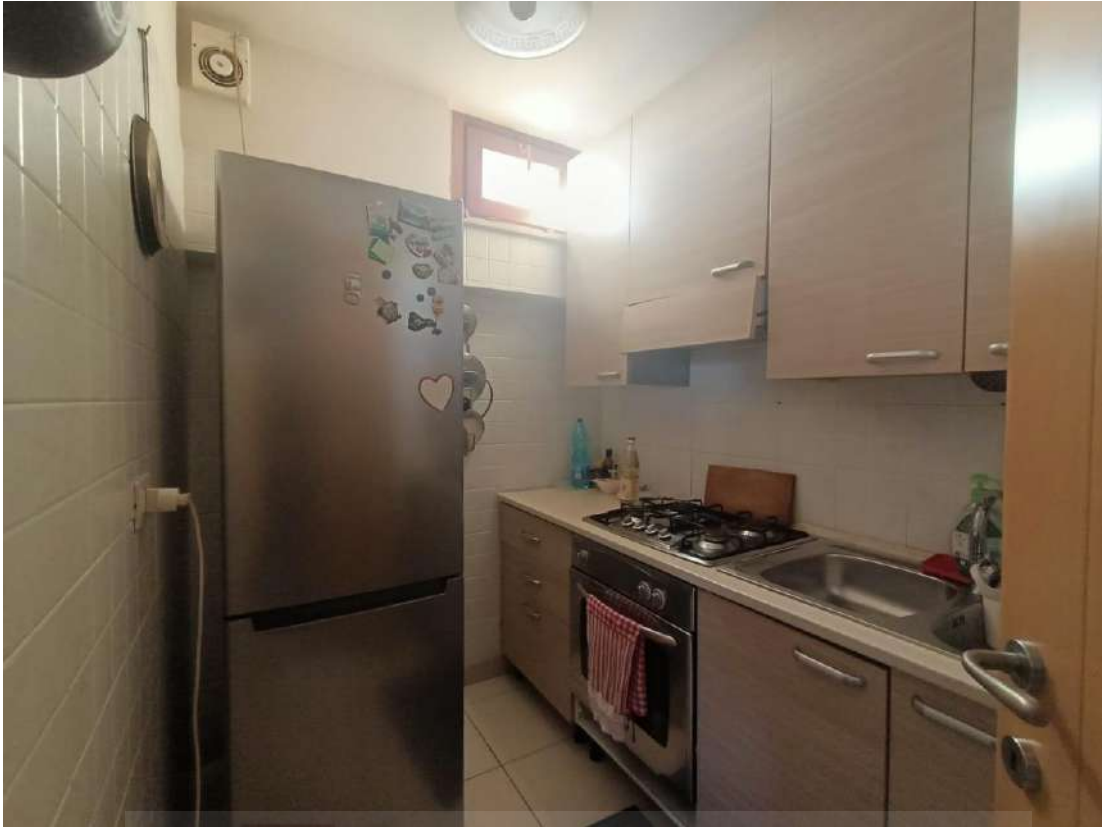
Vista interna del cucinino