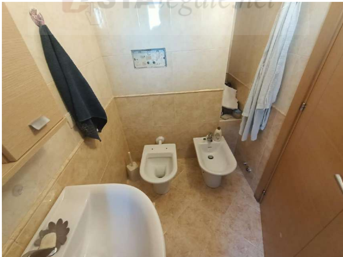
Vista interna del bagno in camera