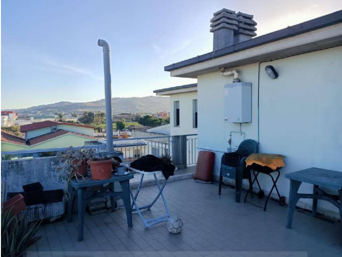
Vista della terrazza