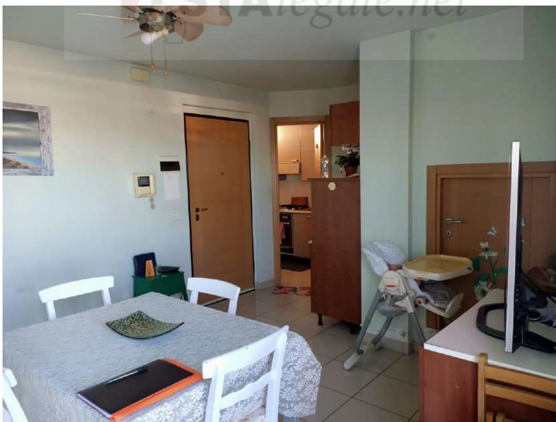
Vista interna "particolare dell'ingresso sul soggiorno"