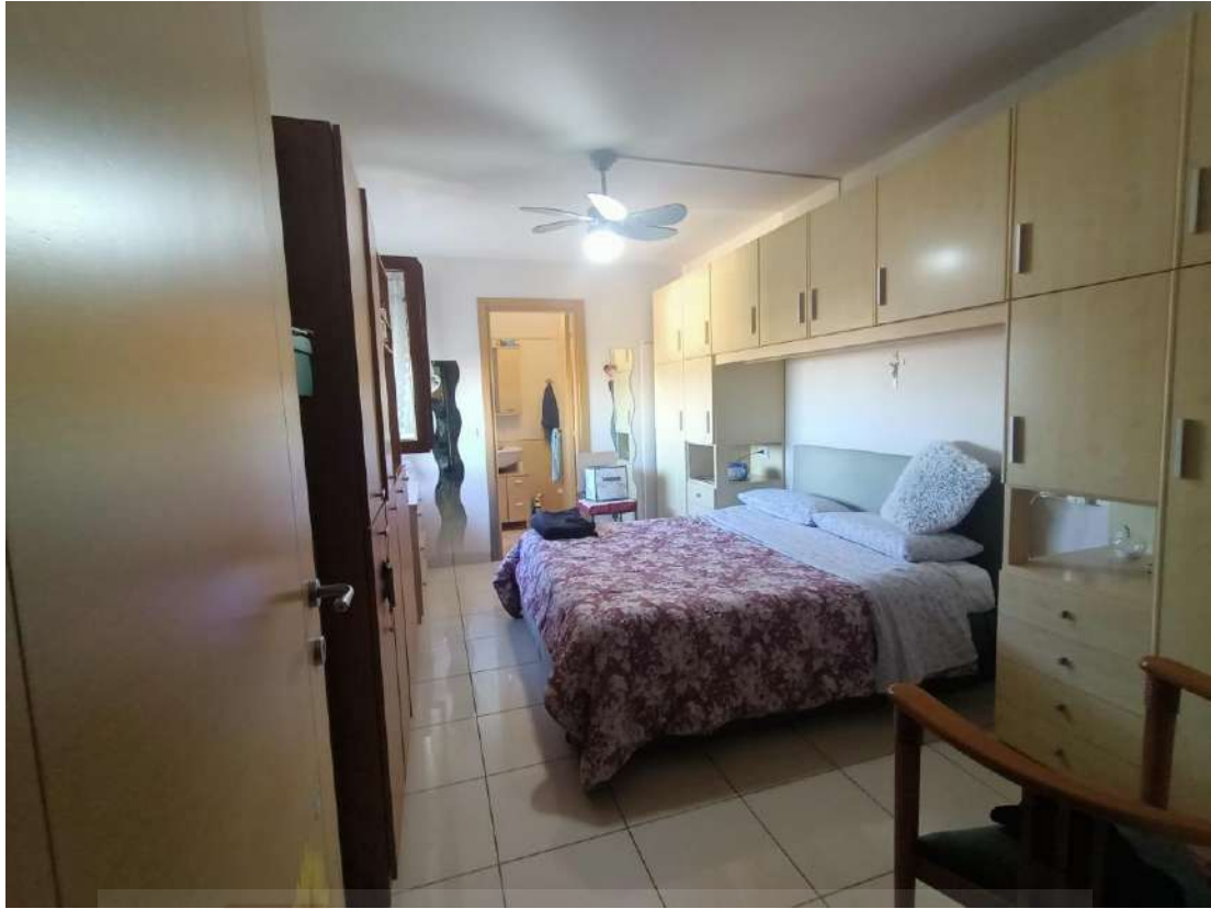
Vista interna della camera