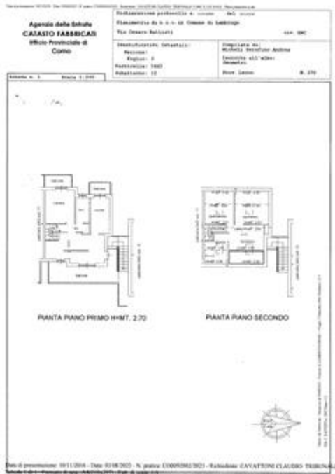
appartamento lotto 7