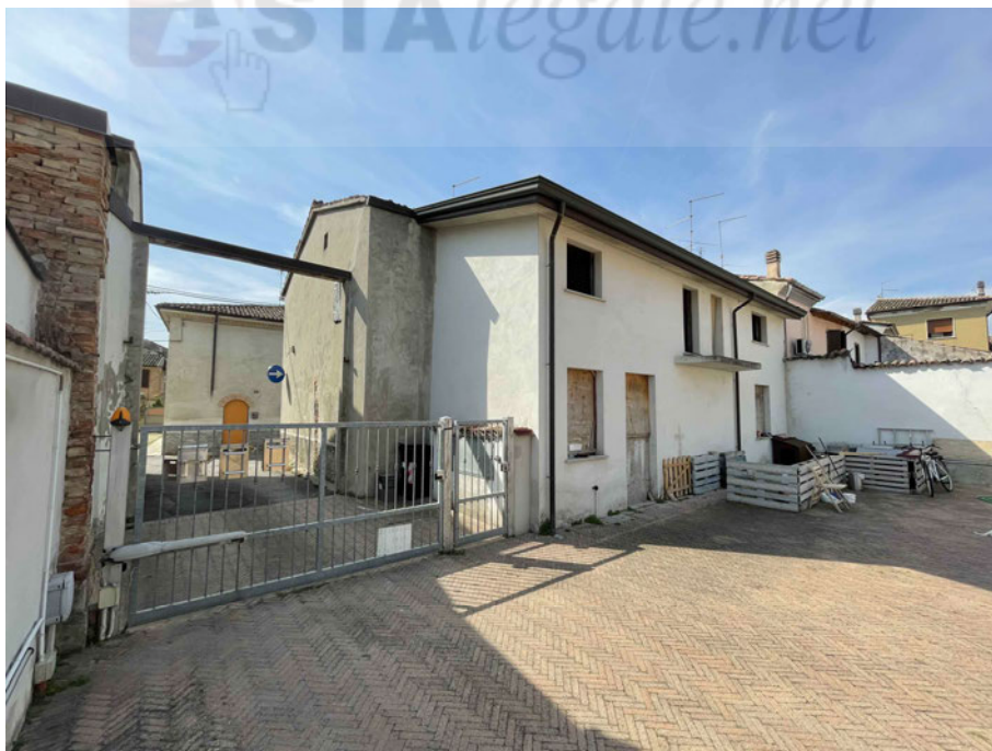
F4: Unità abitativa (partt. 865/5-866) e ingresso comune, vista dalla corte (part. 869)