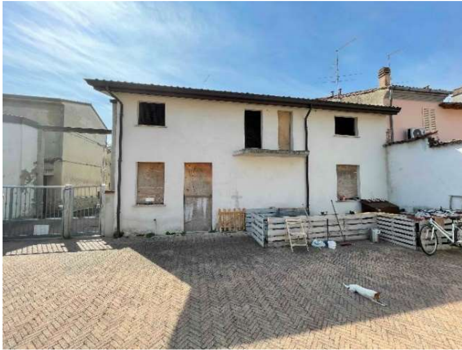
F5: Unità abitativa (partt. 865/5-866) e ingresso comune, vista dalla corte (part. 869)