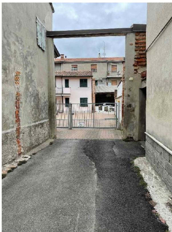
F2: Ingresso alla corte comune, vista dal passaggio comune (part. 224)