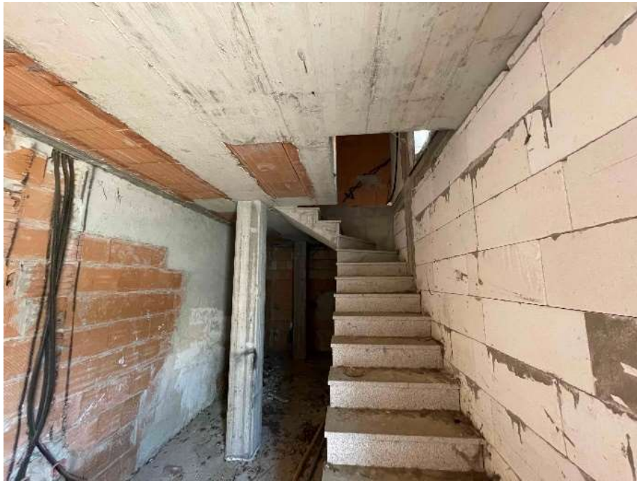
F7: Scala interna di collegamento al piano 1°