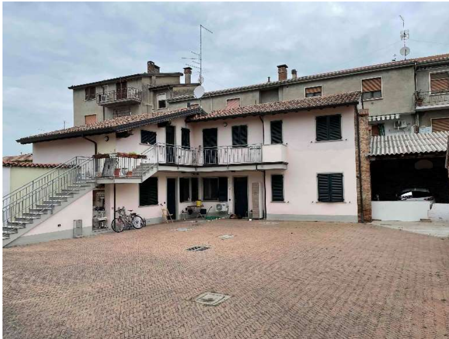
F3: Corte comune (part. 869), vista dall' ingresso comune