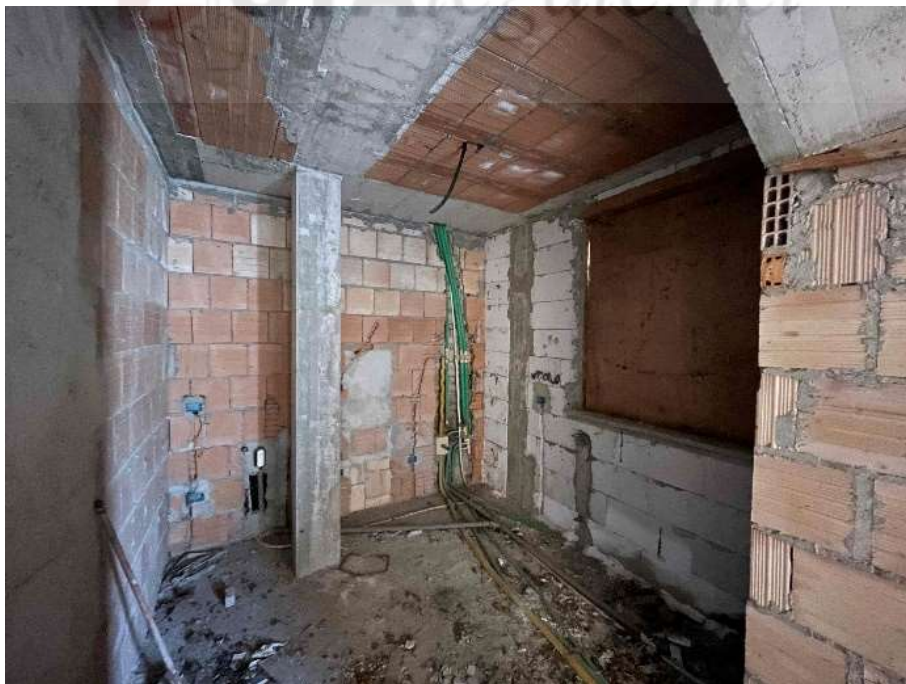
F8: Cucina/angolo cottura