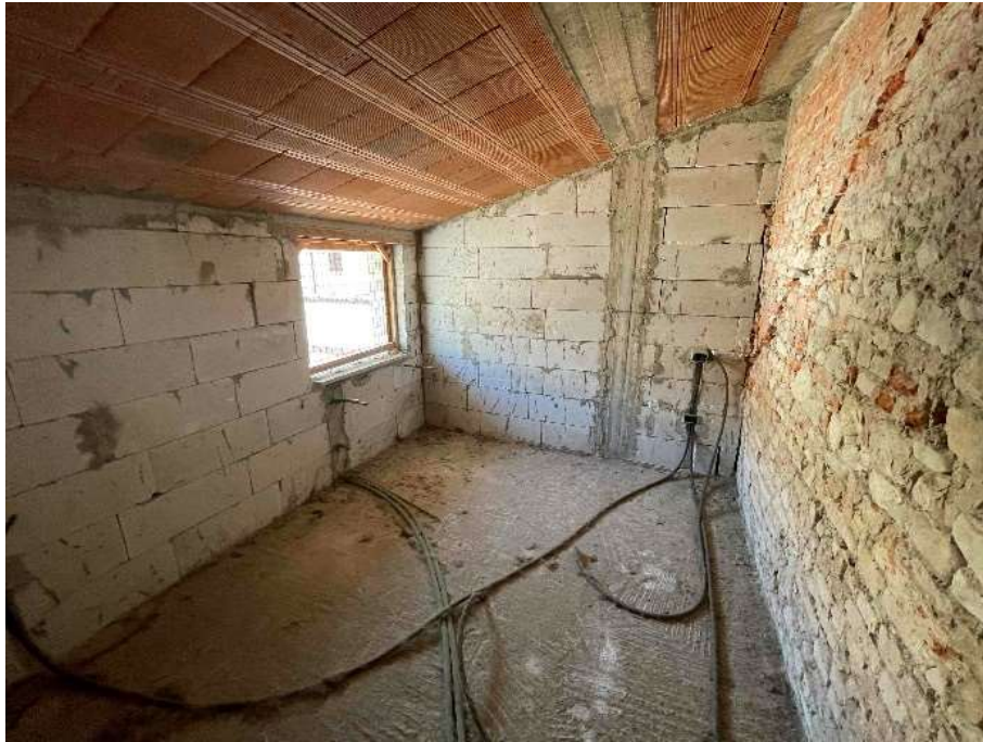
F9: Camera lato est – p. 1°