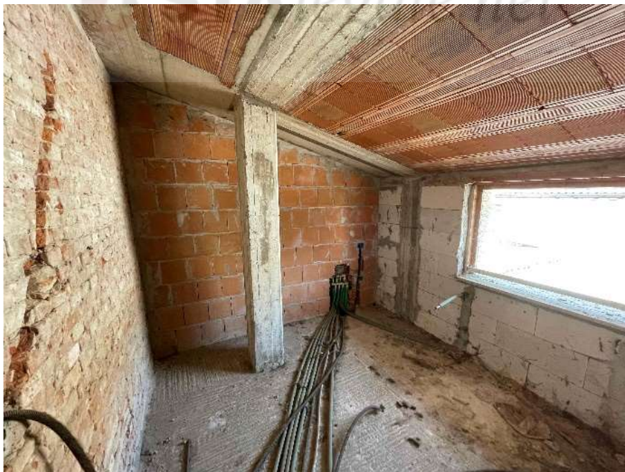
F10: Camera lato ovest – p. 1°