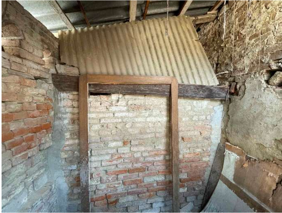
F13: Deposito (part. 862/1) – p. terra