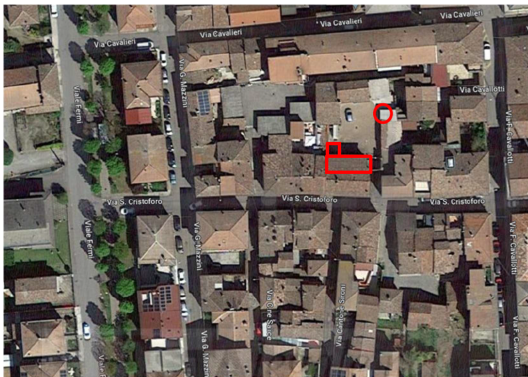
F1: Vista dall'alto