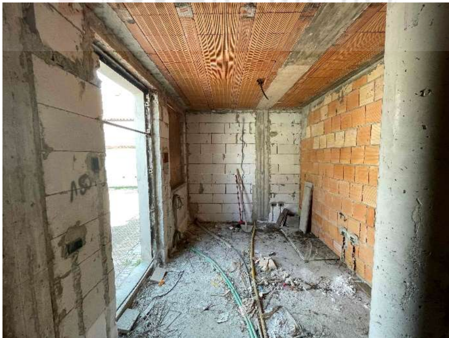
F6: Ingresso/soggiorno – p. terra