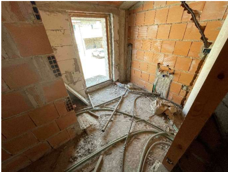
F11: Bagno – p. 1°