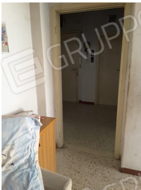
Vista interna alloggio oggetto di pignoramento