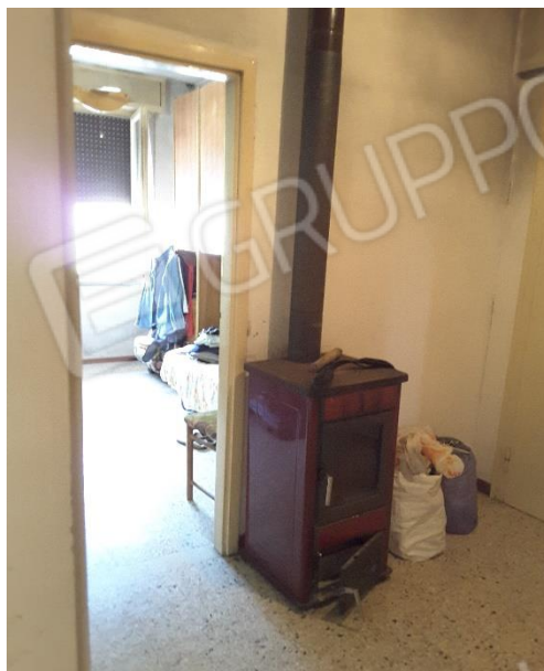
Vista vecchia stufa a legna per il riscaldamento dell'alloggio