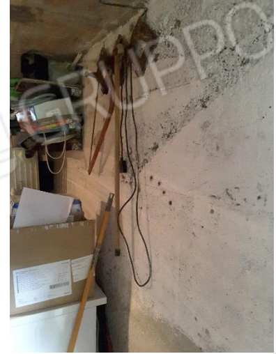
Vista locale cantina al piano cantinato