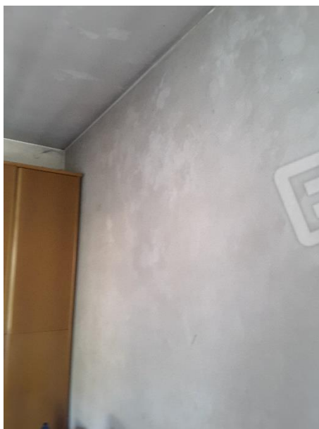
Vista pareti e soffitto intonacate e tinteggiate al civile