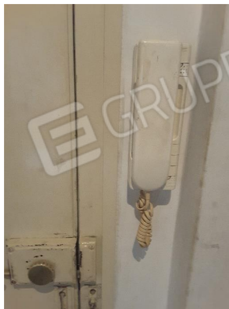
Vista impianto elettrico e citofono