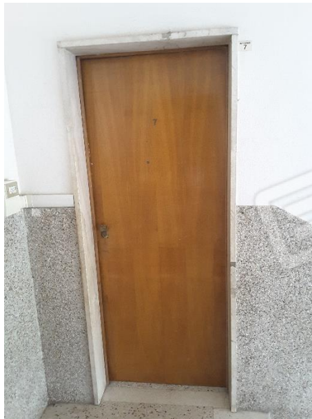
Vista del portoncino d'ingresso