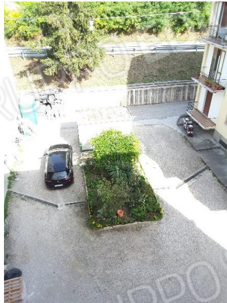
Vista area cortilizia del fabbricato che ospita la porzione immobiliare oggetto di pignoramento