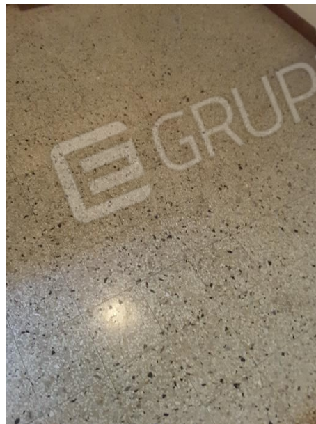
Vista interna alloggio oggetto di pignoramento