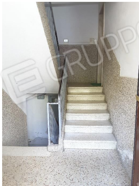
Vista scala comune condominiale per accedere all'appartamento (oggetto di pignoramento) posto al piano terzo del fabbricato condominiale