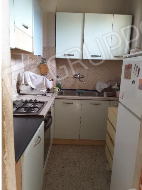
Vista parete attrezzata cucina