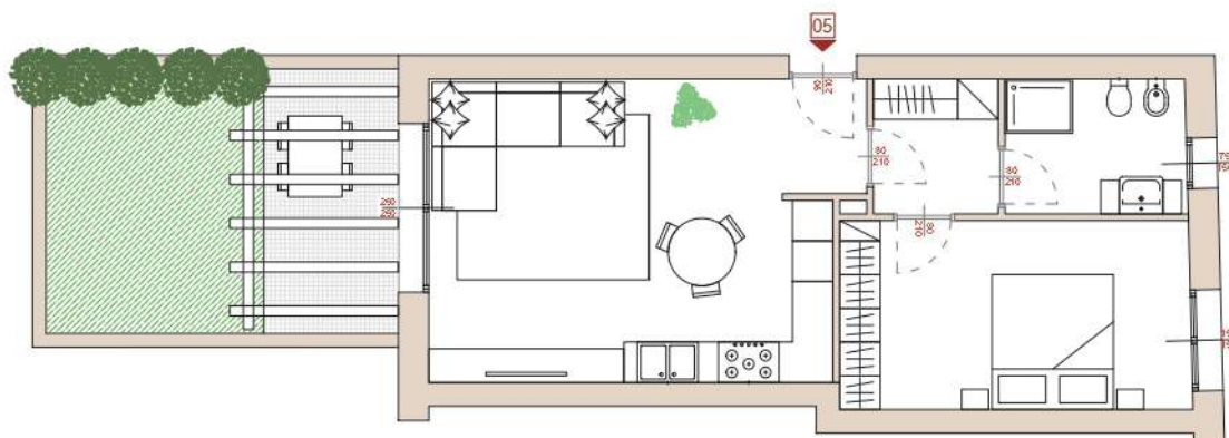
BILOCALE con giardino - PIANO TERRA

La suddivisione degli spazi interni è personalizzabile secondo le esigenze di chi ci abiterà.