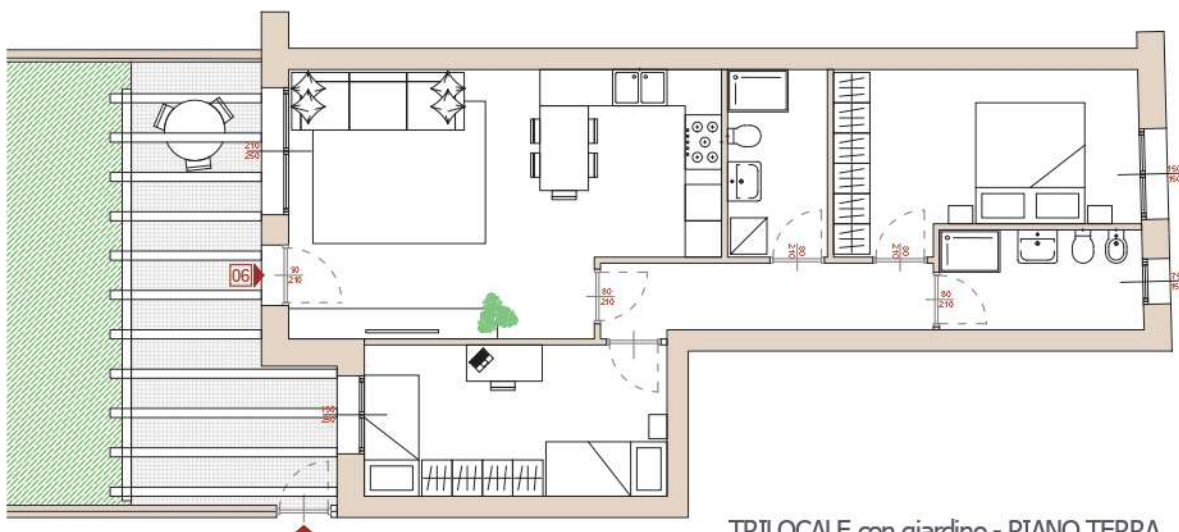
TRILOCALE con giardino - PIANO TERRA