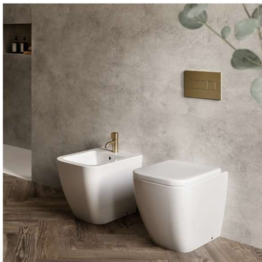
SANITARI HATRIA SERIE BIANCA