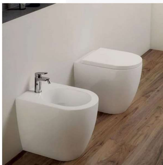
SANITARI AZZURRA SERIE COMODA

Cerchiamo di rendere unico il tuo bagno affidandoci alle ceramiche Made in Italy attraverso due aziende leader del settore: Hatria e Azzurra.