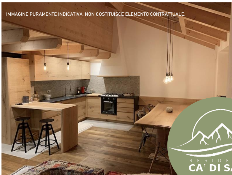
IMMAGINE PURAMENTE INDICATIVA, NON COSTITUISCE ELEMENTO CONTRATTUALE.