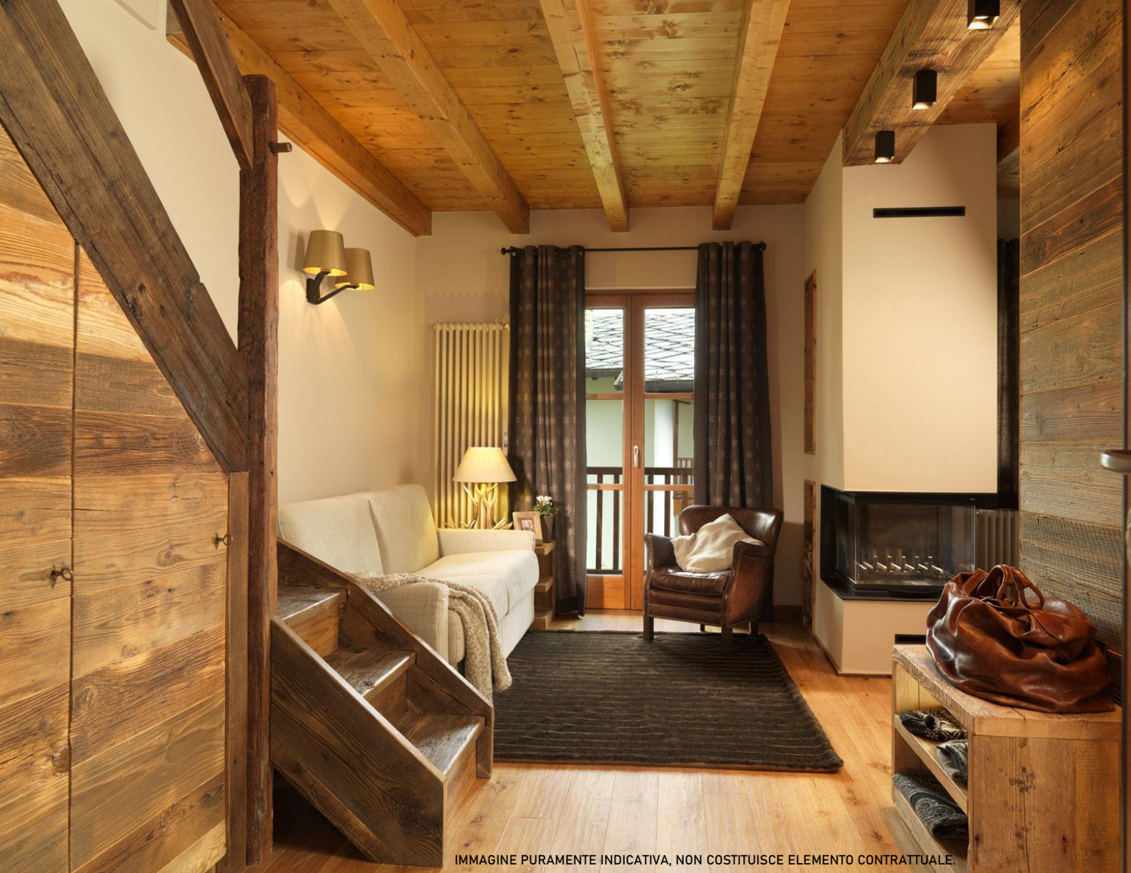
IMMAGINE PURAMENTE INDICATIVA, NON COSTITUISCE ELEMENTO CONTRATTUALE.

IL CAPITOLATO DESCRITTIVO DELLE OPERE E' IL VADEMECUM PER CHI VUOLE ACQUISTARE UNA DELLE NOSTRE SOLUZIONI ABITATIVE.