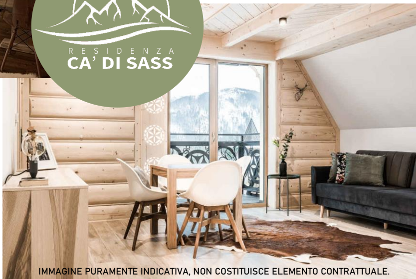
IMMAGINE PURAMENTE INDICATIVA, NON COSTITUISCE ELEMENTO CONTRATTUALE.

- Zona bagno: verranno realizzati rivestimenti dell'altezza di 210/220 cm in piastrelle di ceramica smaltata su tutte le pareti in base alla campionatura messa a disposizione dalla ditta costruttrice presso il proprio fornitore con prezzo di listino del solo materiale di € 40,00 /mq, la posa in opera e relativa assistenza muraria sono a cura e spese della ditta costruttrice.