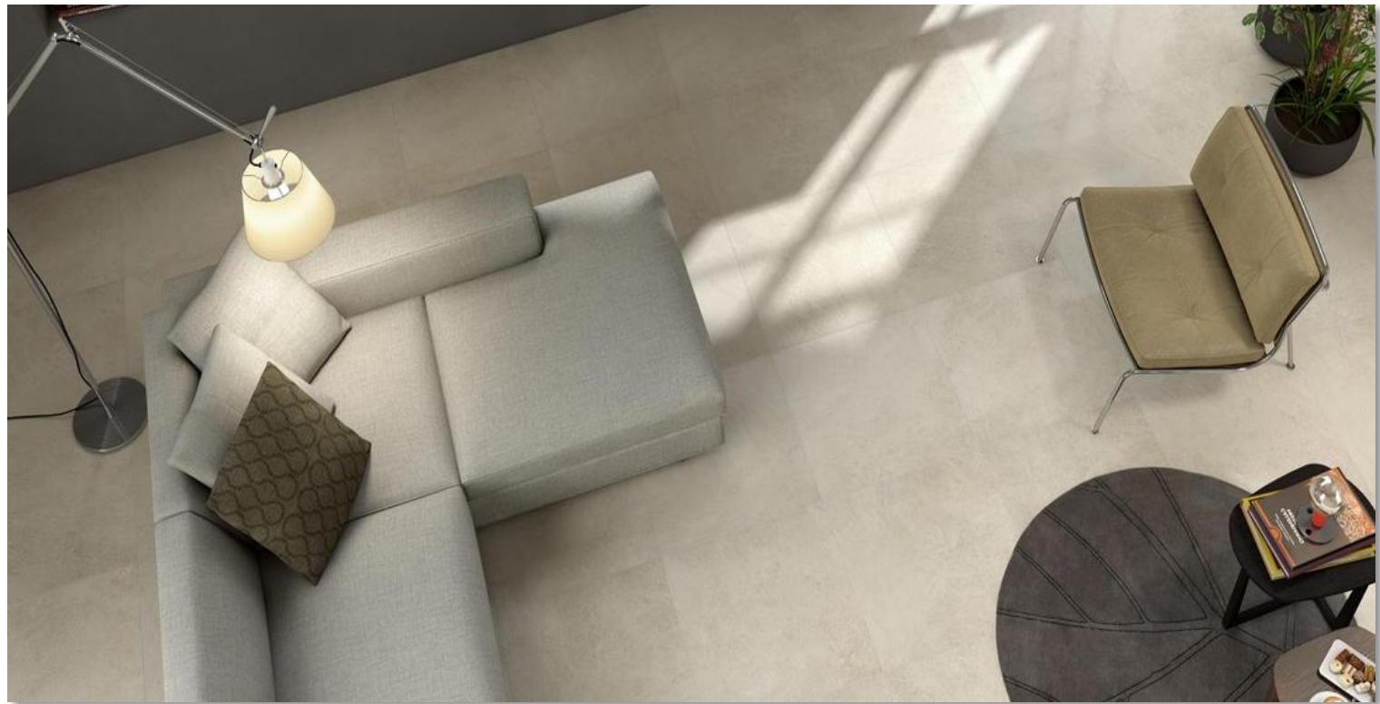
Esempio di ceramiche

In tutti i locali pavimentati interni, è prevista la posa di uno zoccolino battiscopa in legno.