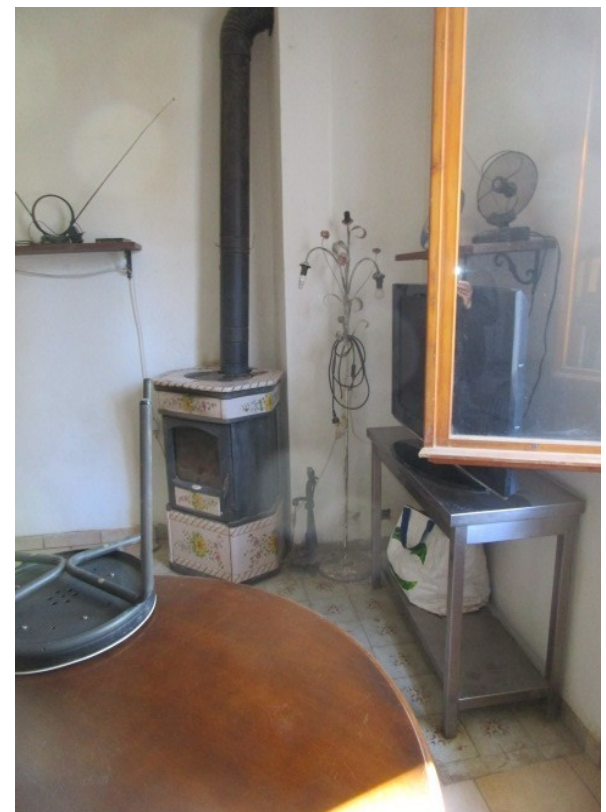
Figura 8: Scorcio del soggiorno , con stufa per il riscaldamento a legna, al piano terra.