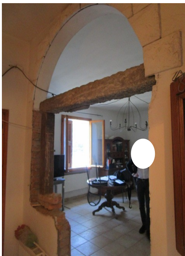
Figura 21: Malsicura condizione architettonica, tra ingresso e soggiorno.