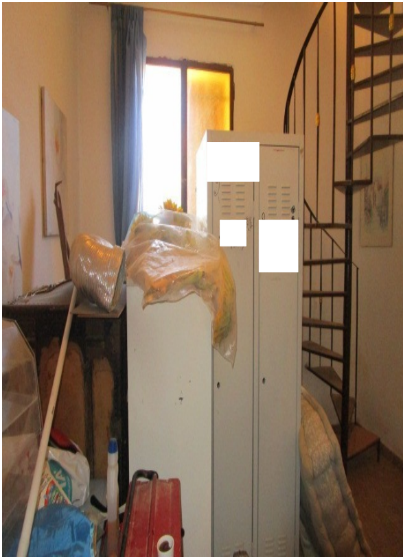
Figura 25: Piano seminterrato, con vano sottoscala.