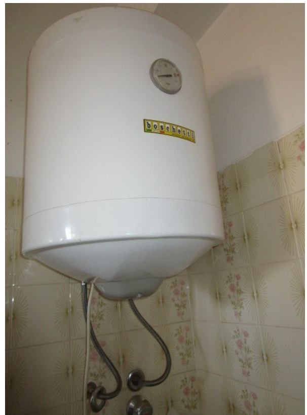
Figura 20: Impianto di trasformazione, alimentato elettricamente, per la produzione d'acqua calda sanitaria.