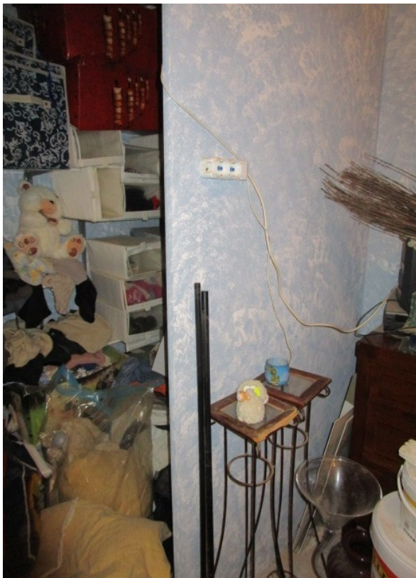
Figura 15: Parete posticcia in legno, ricavata in una stanza da letto.