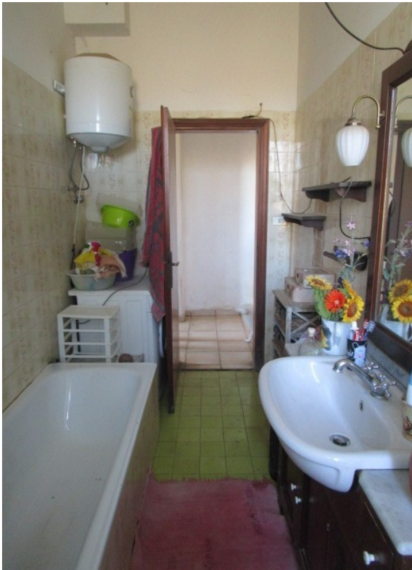
Figura 17: Piano terra, vista del bagno, con ingresso dal corridoio.