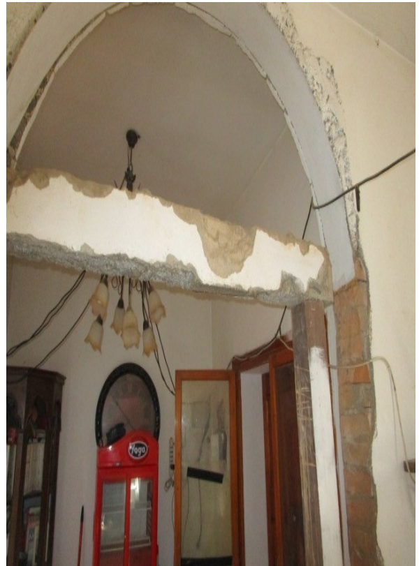
Figura 10: Piano terra, modifiche murarie incomplete.