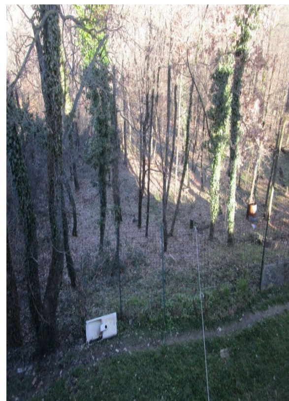
Figura 36: Bosco incolto esclusivo alla villa, con servitù d'impianto fognario.