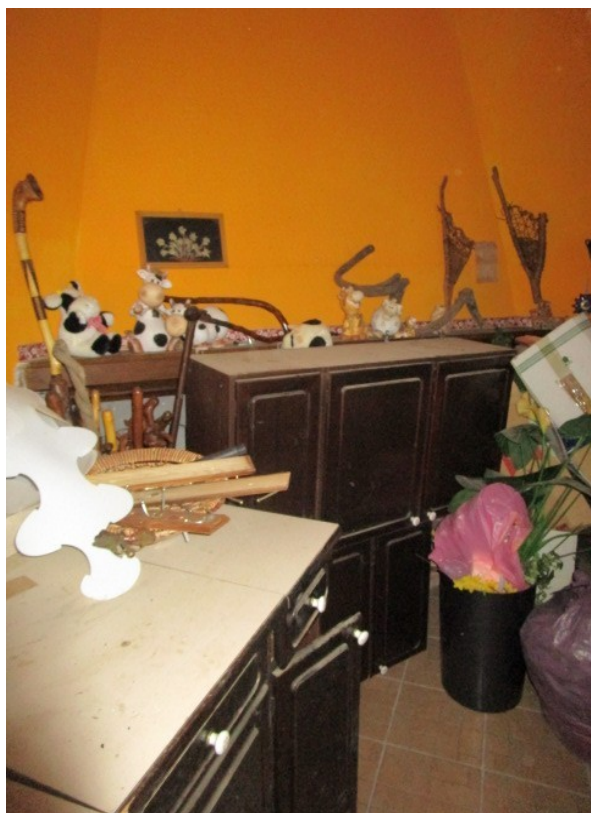
Figura 33: Piano cantinato, stanza con ampio camino, celato dal mobilio.