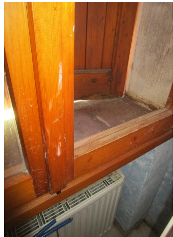
Figura 16: Particolare degli infissi interni ed esterni, oltre loro usura.