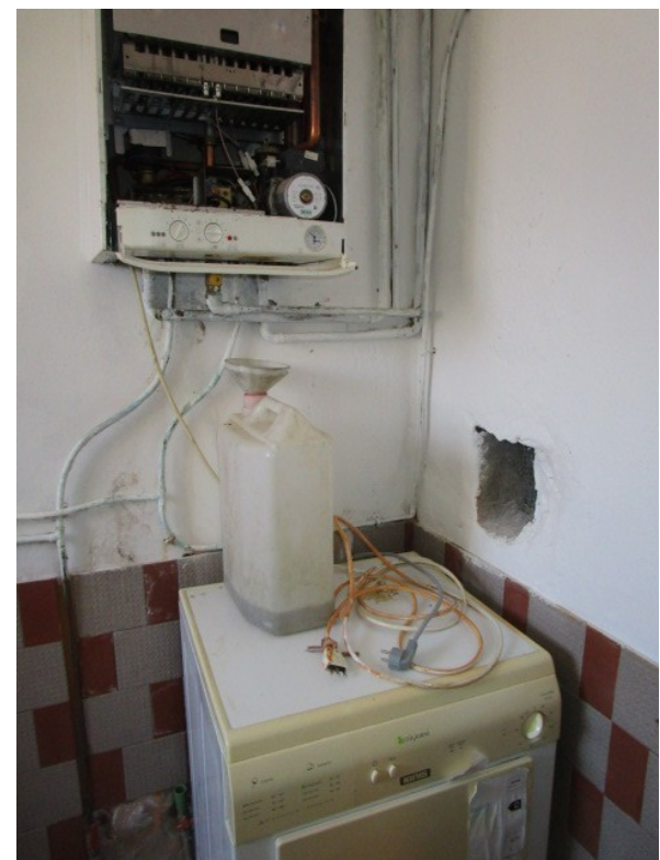
Figura 28: Insufficiente condizione manutentiva, della centrale termica dell'edificio.