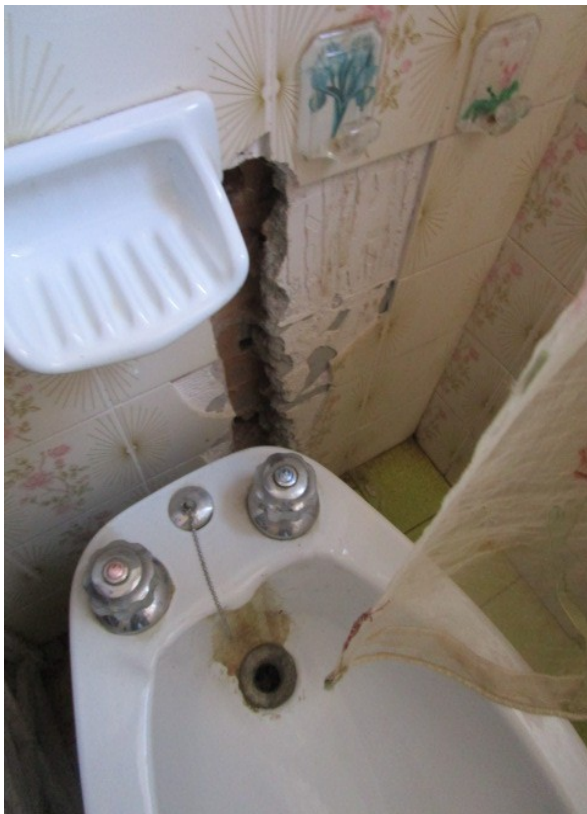
Figura 19: Dettaglio di opere edili incomplete, all'interno del gabinetto.