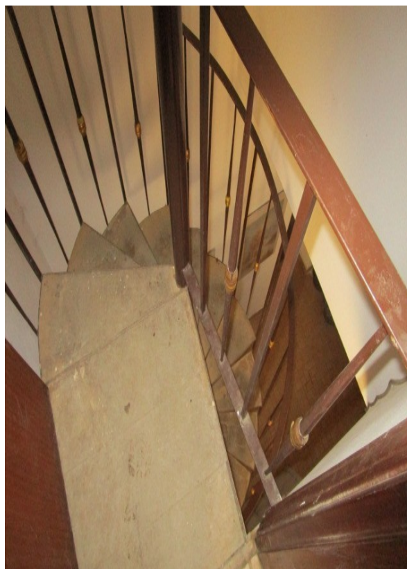
Figura 24: Scala a chiocciola, che collega il piano terra, ai locali del seminterrato.