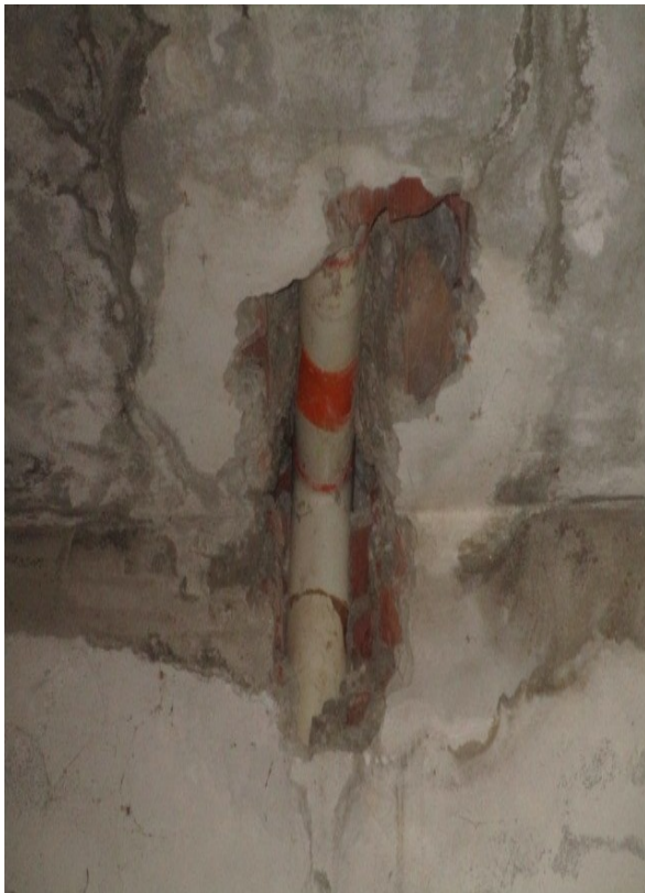
Figura 31: Dettaglio delle parti deteriorate.