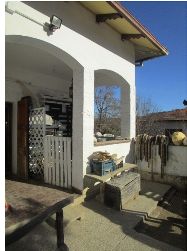
Figura 4: Portico prospiciente la casa, affiancato da ingresso carrabile.