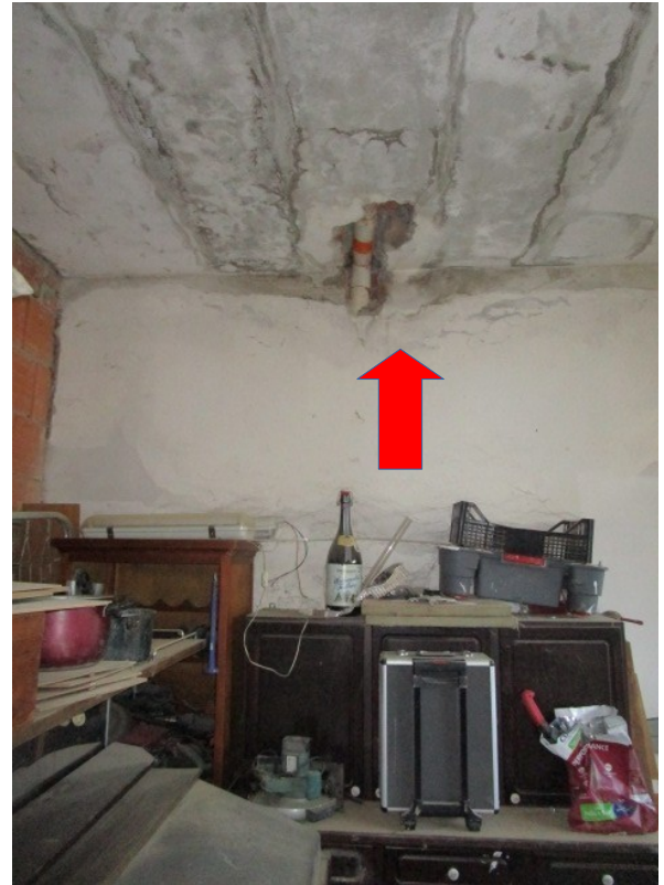
Figura 30: Autorimessa, con problematiche al solaio.