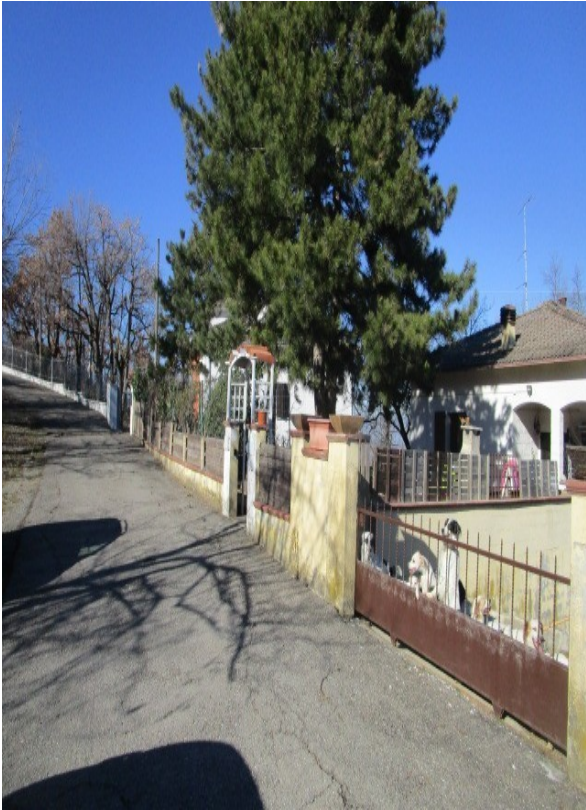
Figura 1: Viabilità d'accesso alla borgata "Piattello", in Valsamoggia (BO).