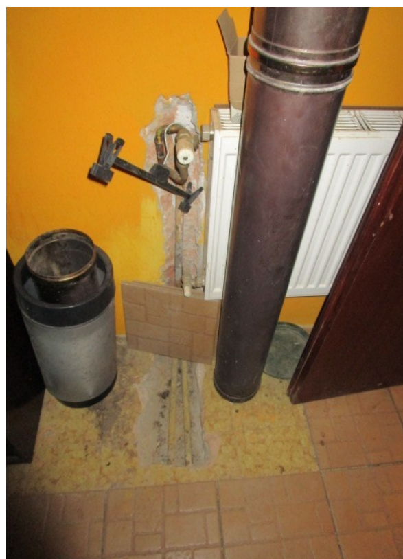
Figura 34: Scassi murari ed a pavimento, per interventi sulla rete termica precaria.