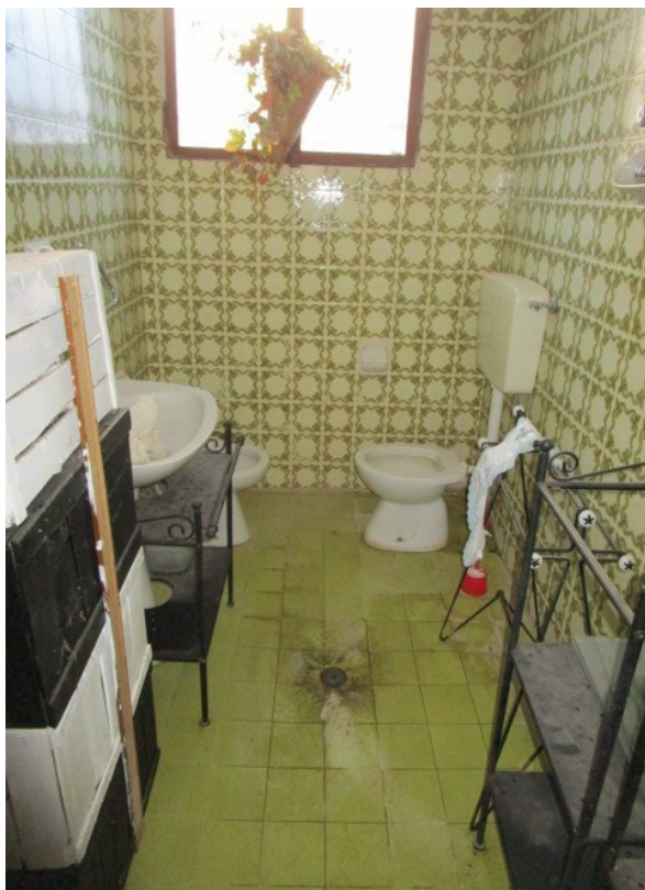
Figura 27: Latrina di servizio, al piano sotto strada.