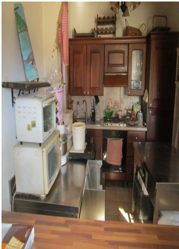
Figura 7: Angolo di cucina, presso il soggiorno della residenza, al piano stradale.