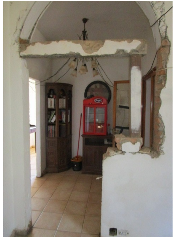
Figura 6: Piano terra, disimpegno d'ingresso alla villa , con modifiche architettoniche interne ed in stato precario.