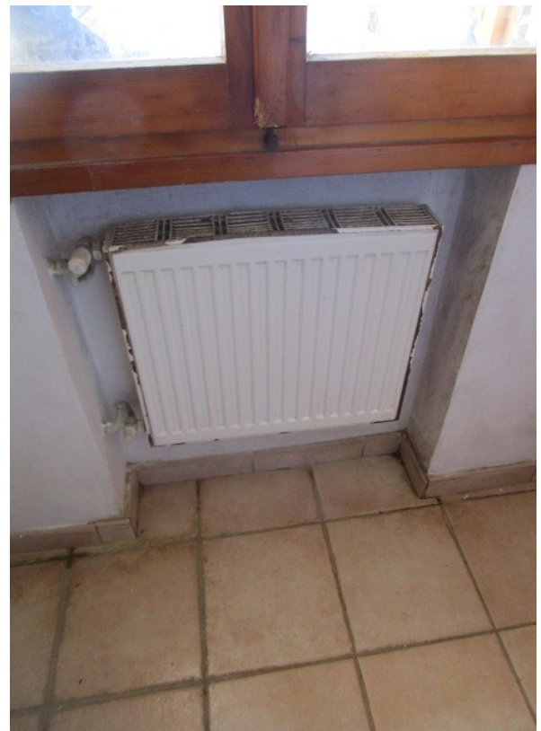
Figura 14: Tipologia di massa radiante, in carente stato d'efficienza,