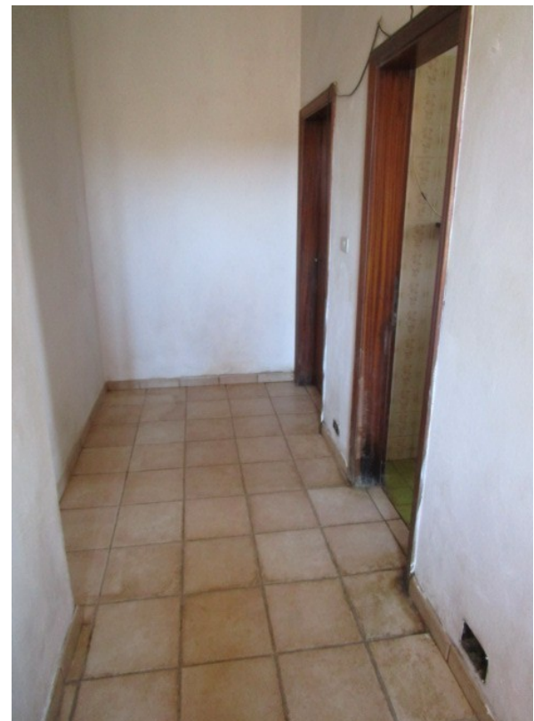
Figura 12: Dettaglio dello scadente stato manutentivo, delle finiture interne.