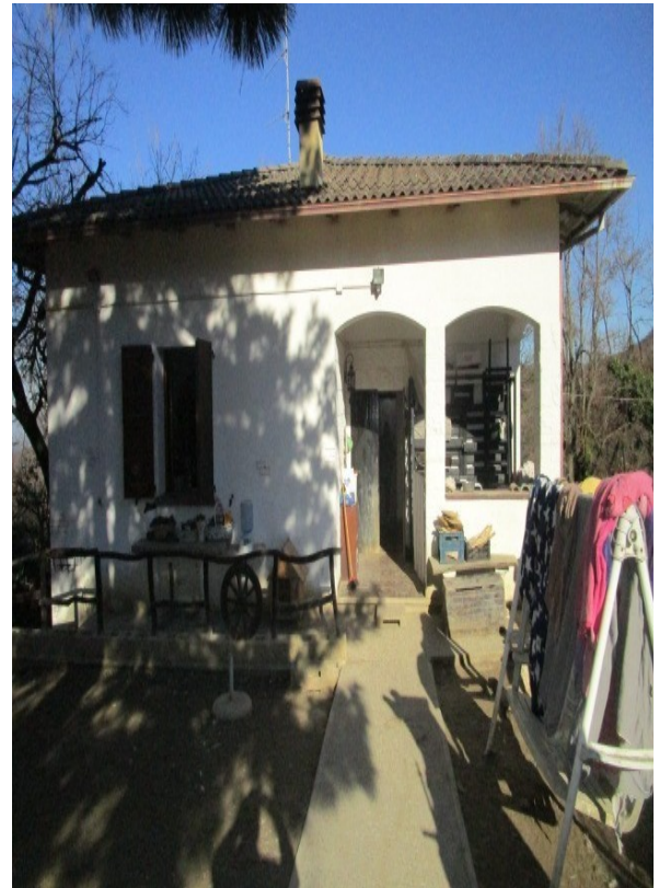
Figura 2: Villa unifamiliare, in via San Prospero 4051 / B, ex comune di Savigno, oggi Valsamoggia (BO) loc. San Prospero.