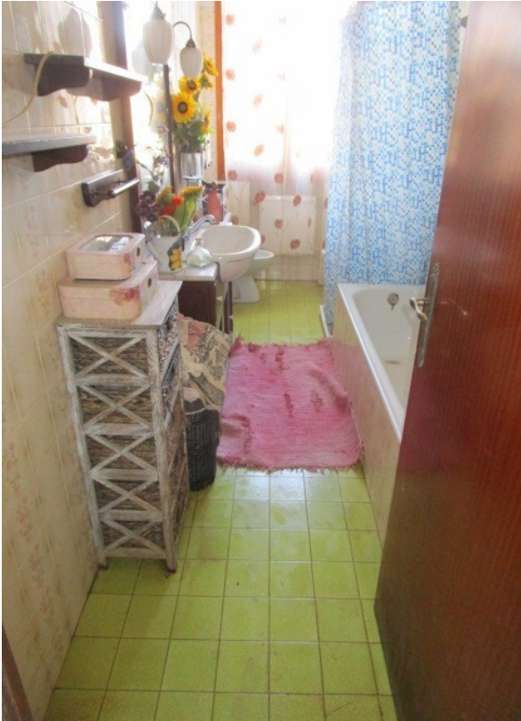
Figura 13: Piano terra, servizio igienico in zona notte.