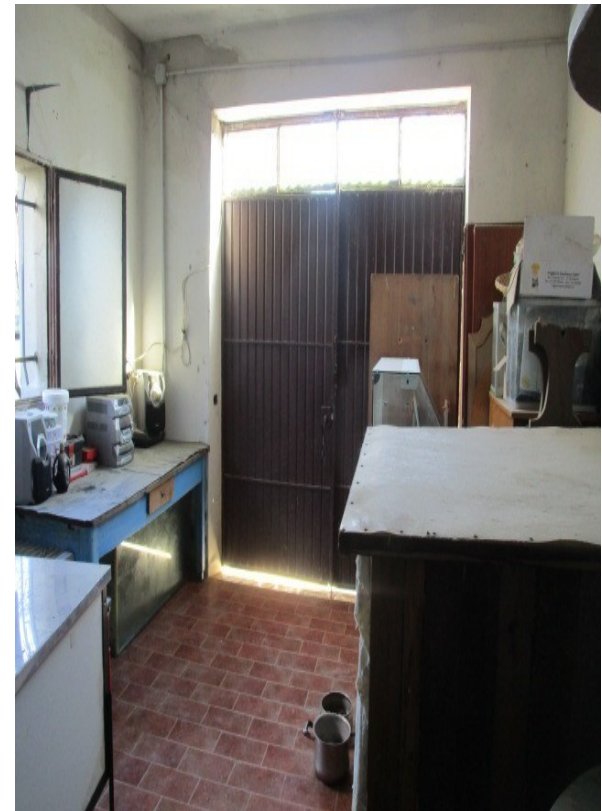
Figura 32: Panoramica della rimessa, con porta carrabile.