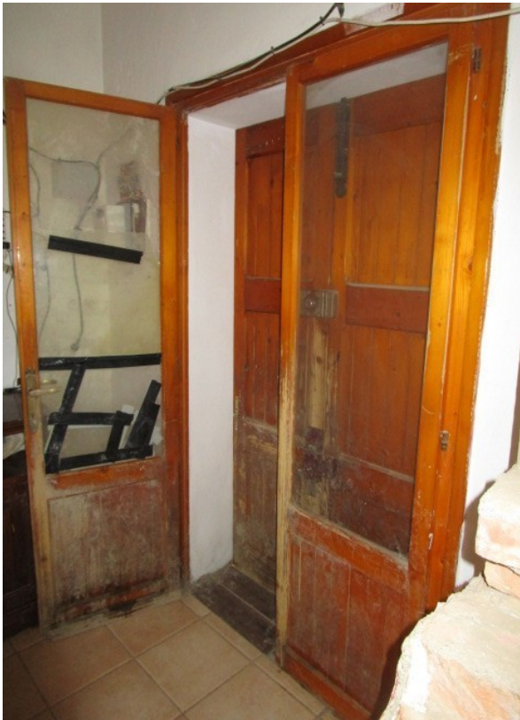
Figura 5: Piano terra , porta d'ingresso principale, all'abitazione in Savigno (BO).