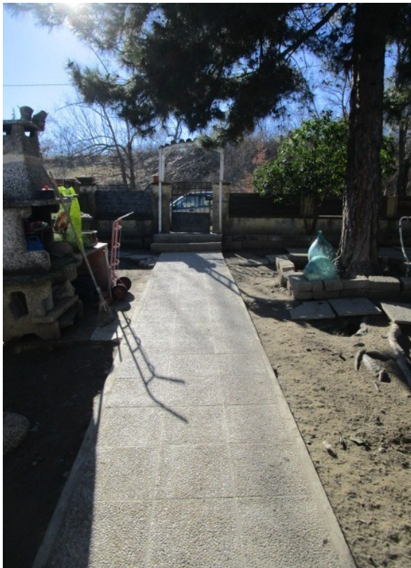
Figura 3: Ingresso pedonale dalla strada, su corte privata e circoscritta la villa.