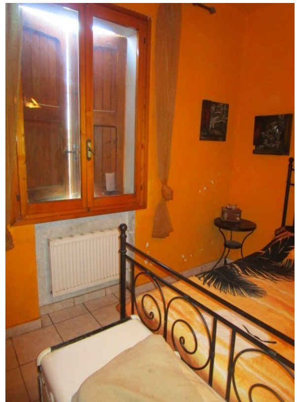
Figura 18: Camera matrimoniale.