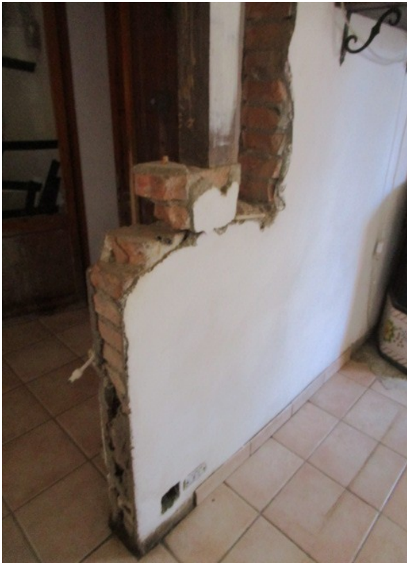
Figura 9: Piano terra , demolizione parziale di tramezzo interno al soggiorno, senza titolo edilizio.