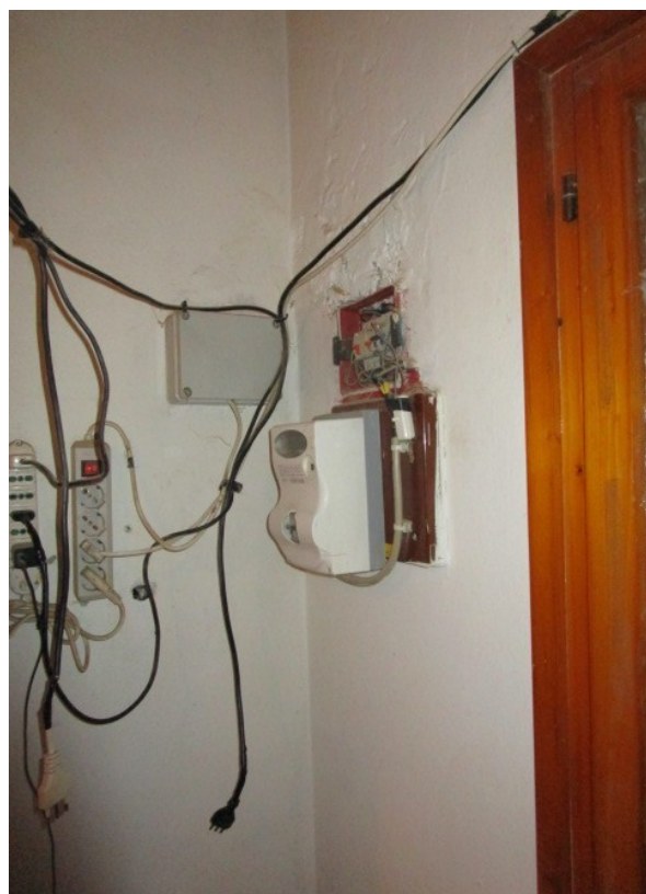
Figura 23: Inadeguata condizione di funzionamento e sicurezza, dell'impianto elettrico civile.