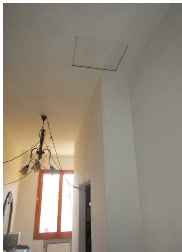
Figura 22: Corridoio con botola d'accesso al sottotetto e cavi elettrici precari.