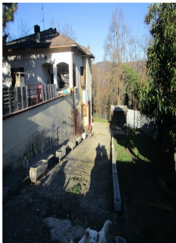
Figura 35: Rampa carrabile, d'accesso alla rimessa.