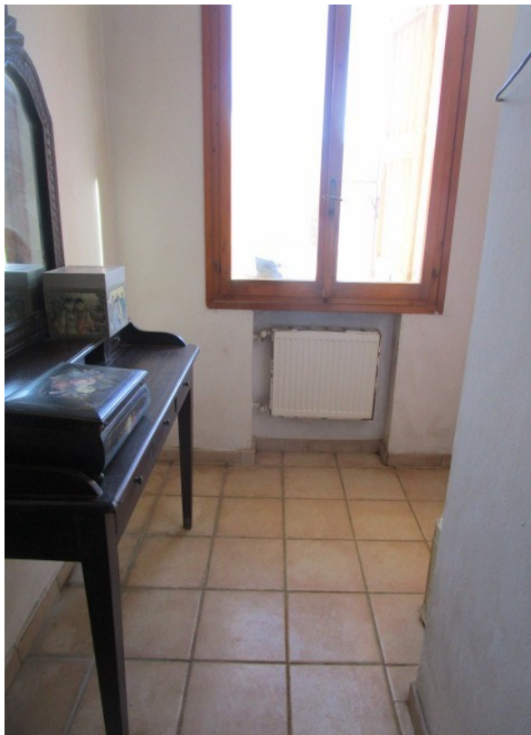
Figura 11: Piano terra, corridoio interno tra zona giorno e camere da letto.