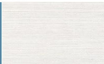
SPIGA BOTTEGA ACERO