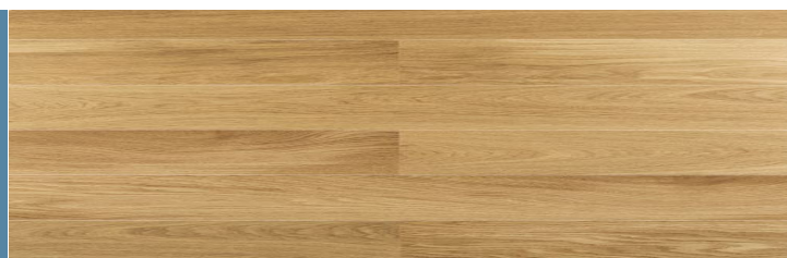
TORTONA IL PIAZZA